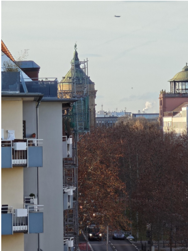
Ausblick auf den Wasserturm