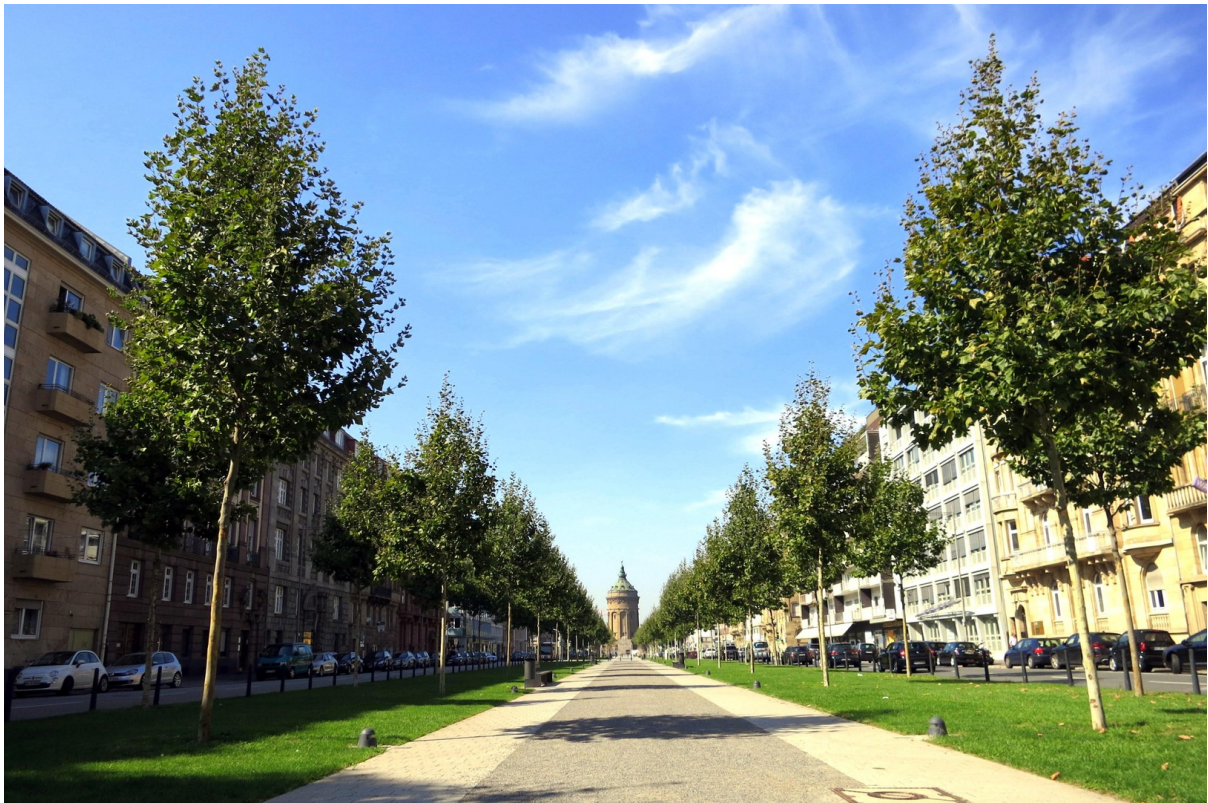
Grüne Allee direkt vor der Tür