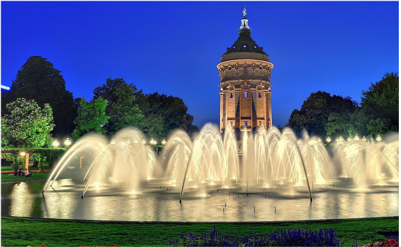
Wasserturm 12min zu Fuß