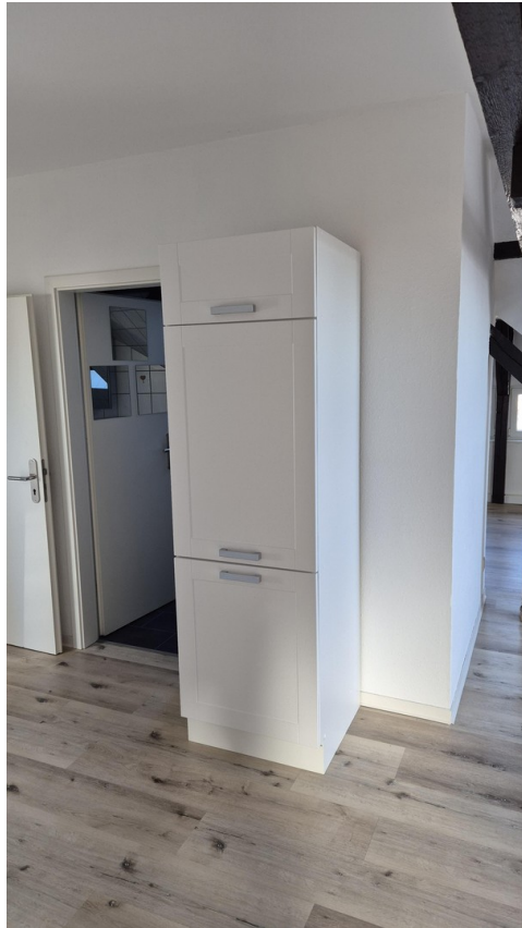
Blick zur Badtür mit Schrank