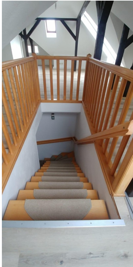
Innentreppe zur Wohnung