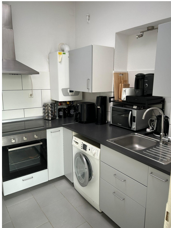
Einbauküche 2. OG Anbau