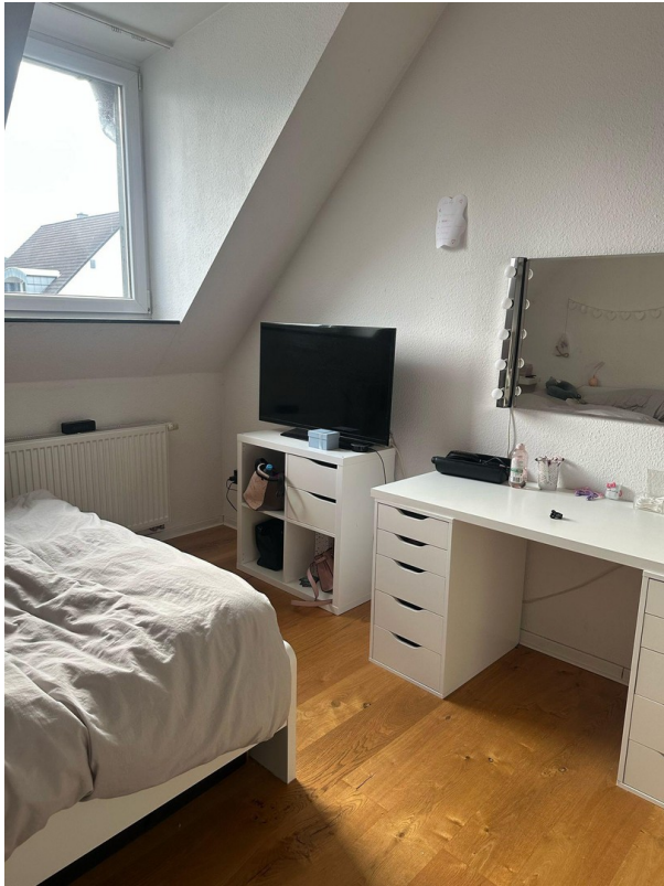
Schlafzimmer 2 DG