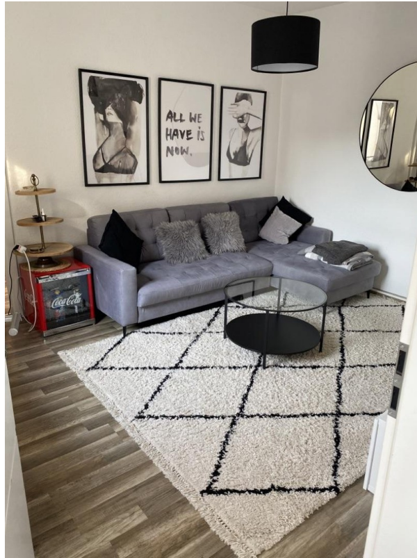
Wohnzimmer 2. OG Anbau