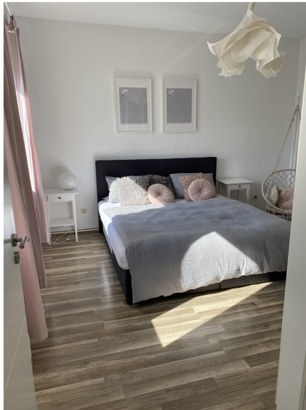
Schlafzimmer 2. OG Anbau