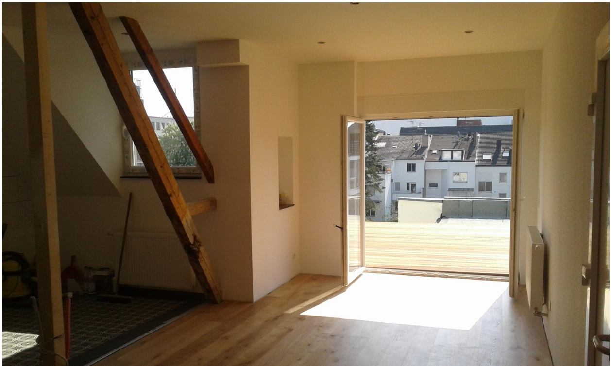
Esszimmer DG / Dachterrasse