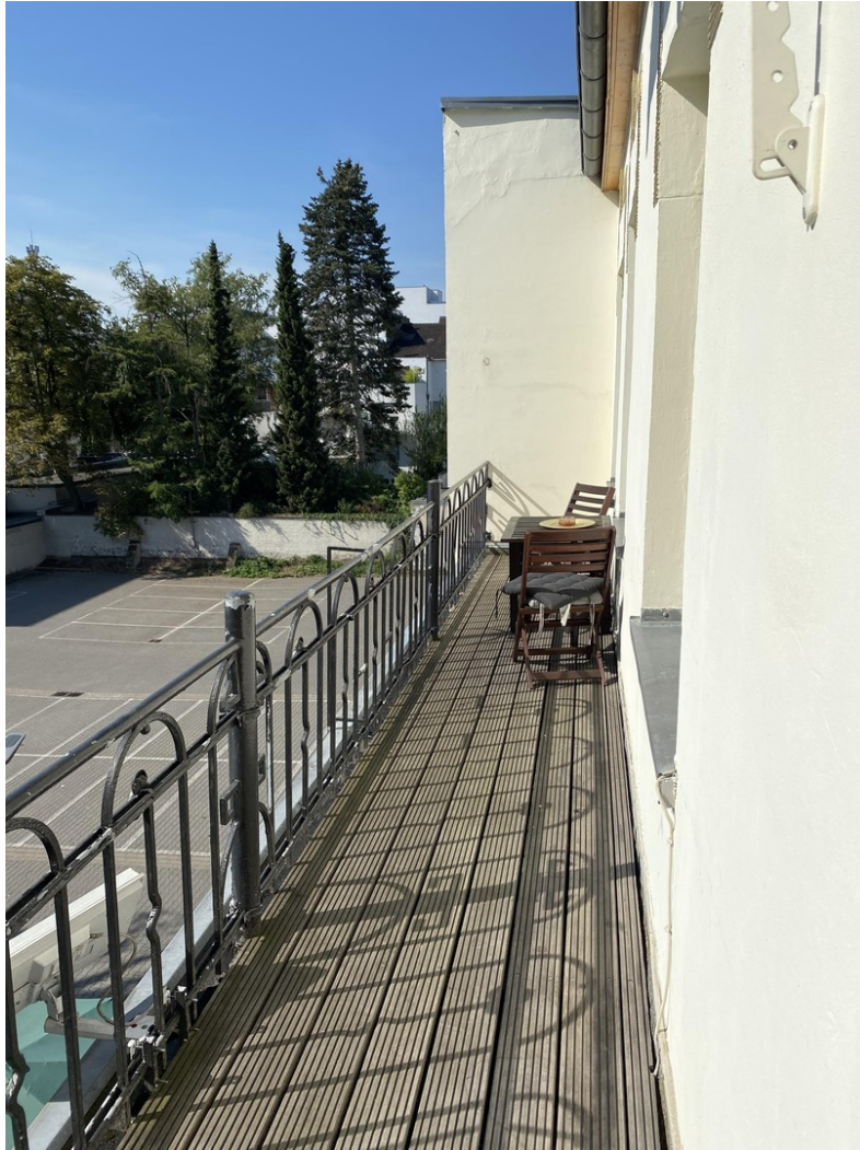
Balkon 1. und 2. OG Anbau