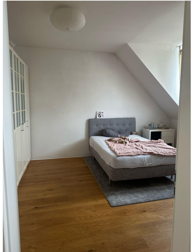
Schlafzimmer 1 DG