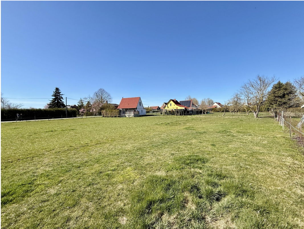
Bauplätze 3 und 4