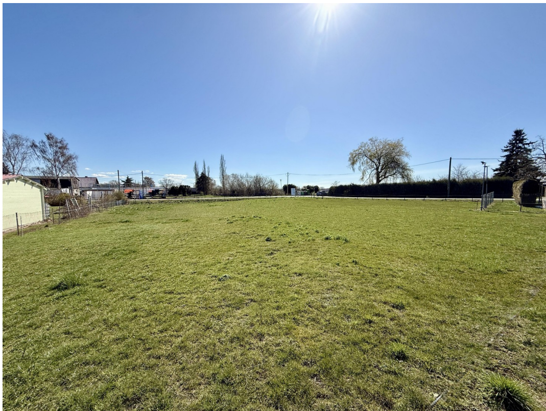
Bauplätze 3 und 4