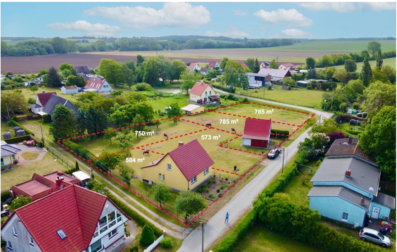
Luftbild mit Grundstücken