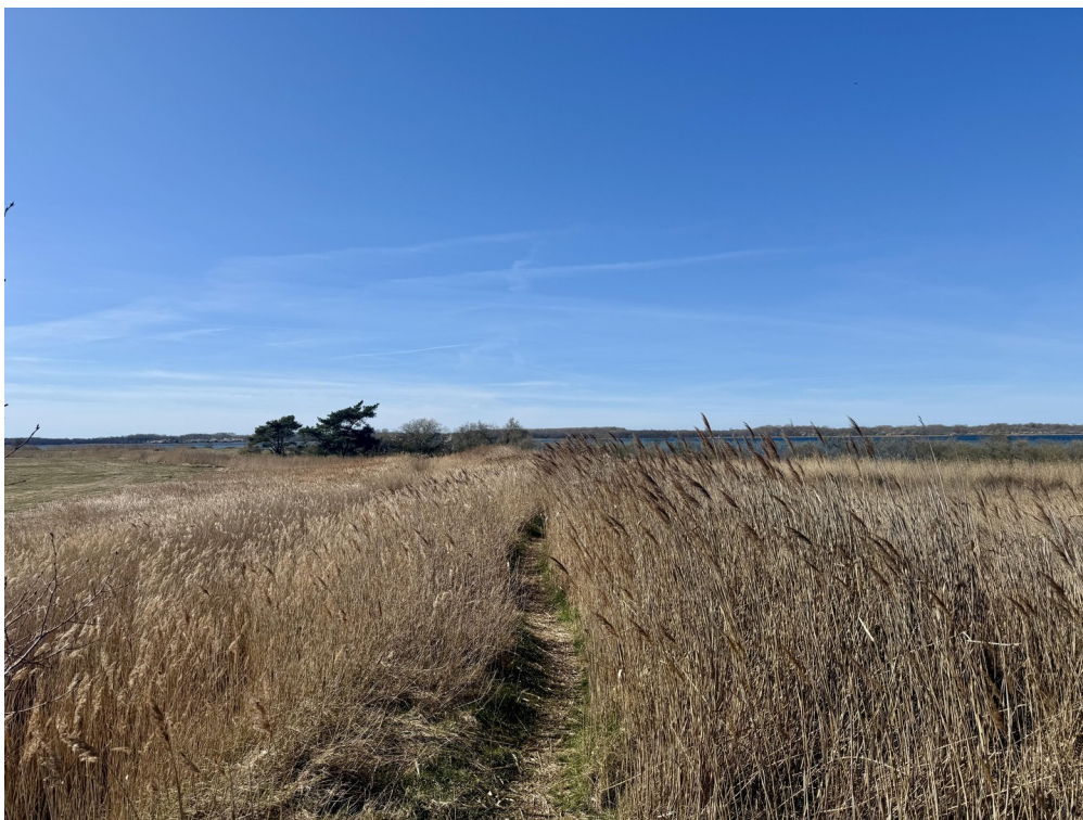
Weg zum Haff (2 km entfernt)