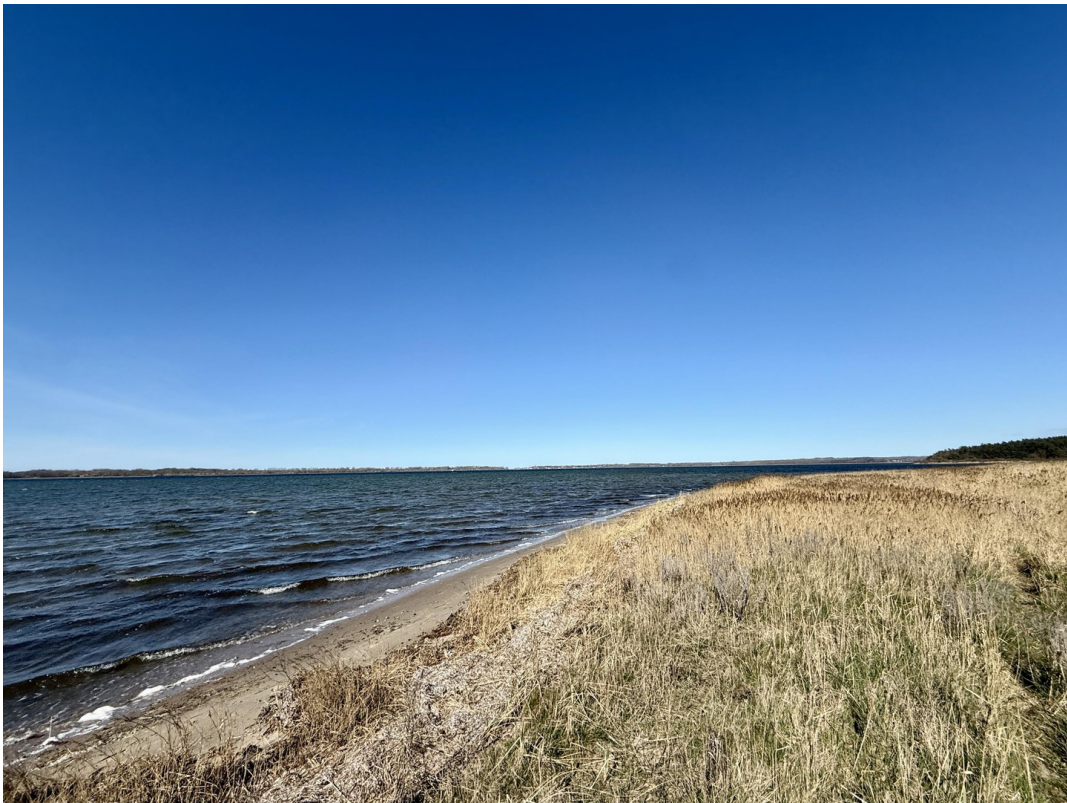
Haff mit Blick auf Rerik