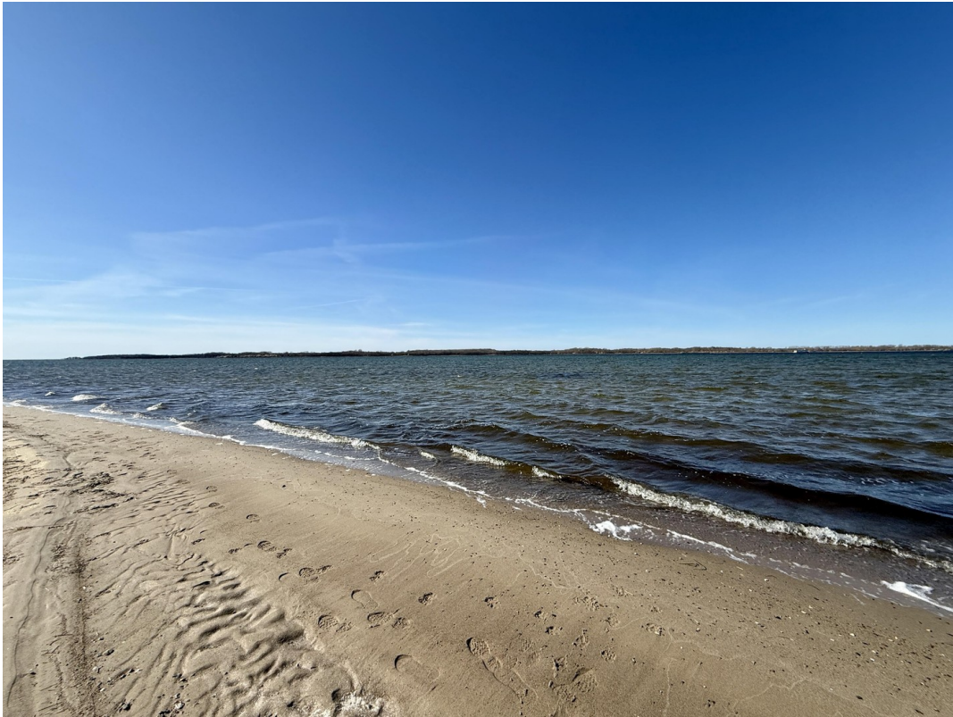
Strand am Haff (ca. 2 km)