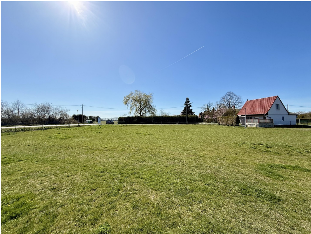
Bauplätze 3 und 4