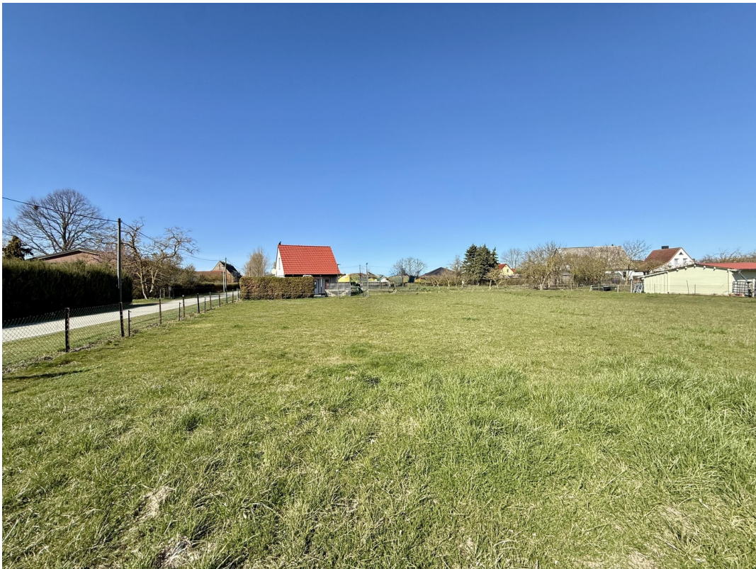
Bauplätze 3 und 4