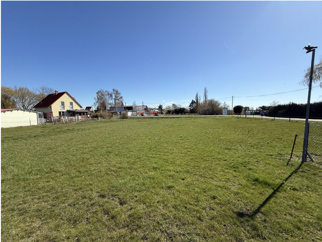
Bauplätze 3 und 4