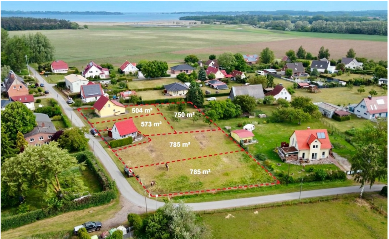
Luftbild mit Grundstücken