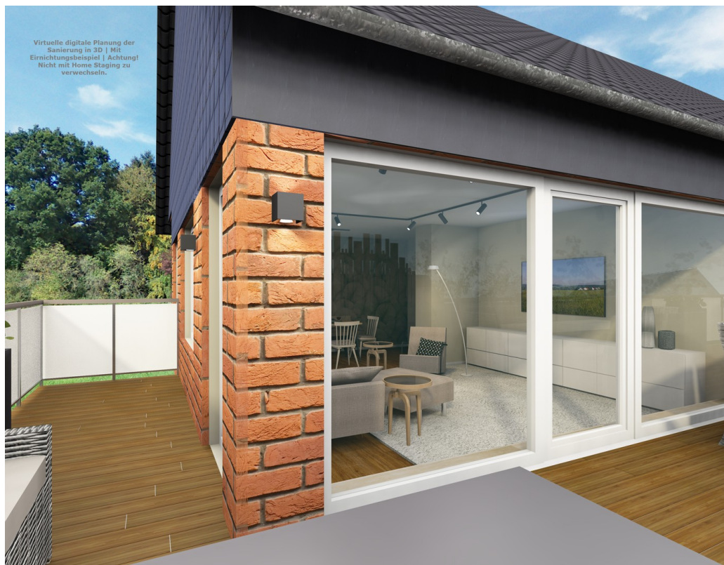
Blick in den Wohnbereich Visu