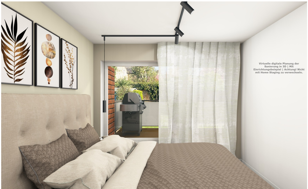
Gemütliches Schlafzimmer Visu