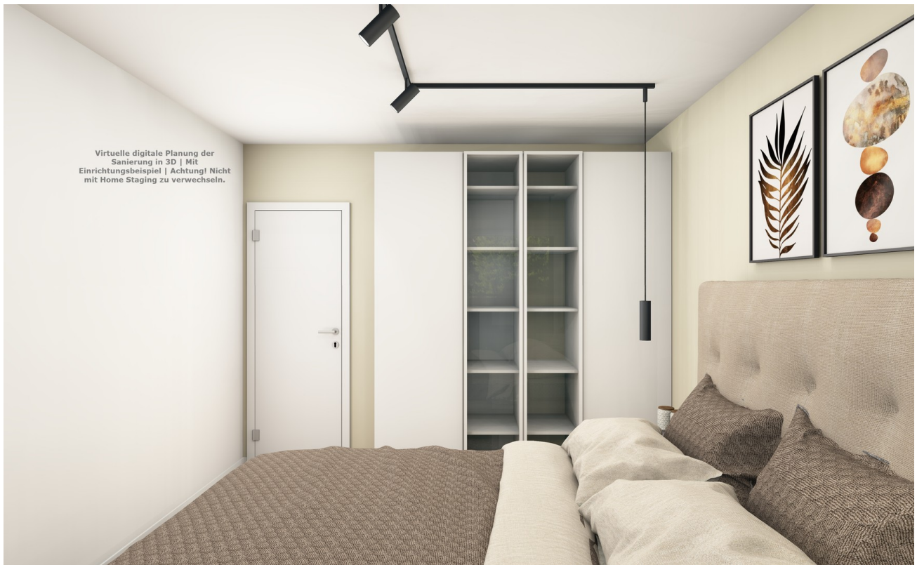
Schlafbereich & Stauraum Visu