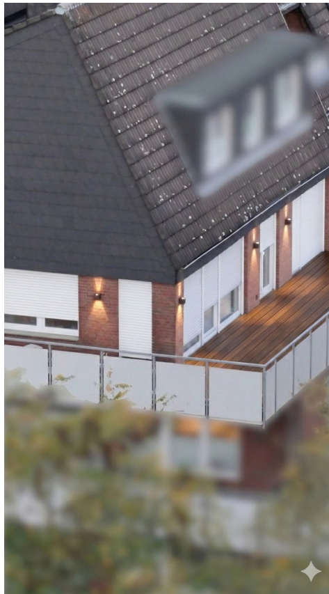
Großzügiger Dachgarten Foto