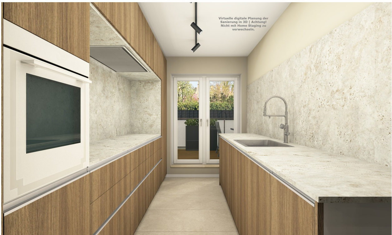
Hochwertige Tischlerküche Visu