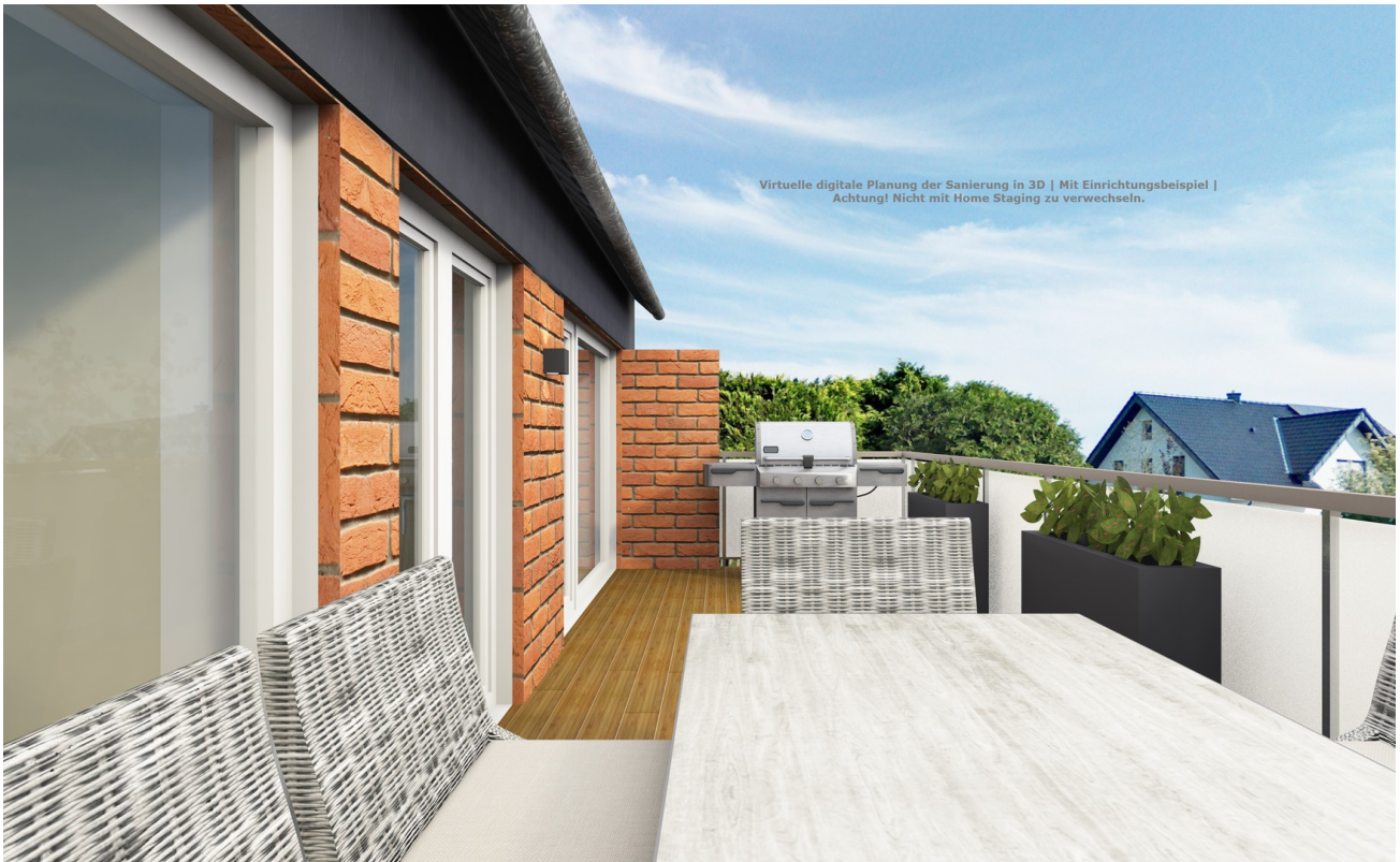
Visualisierung neue Terrasse