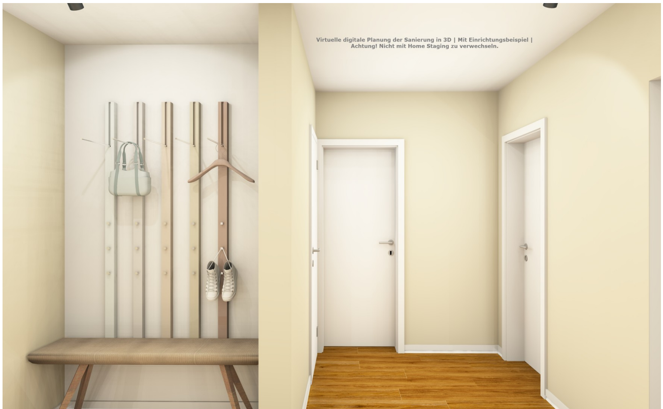
Eingangsbereich & Garderobe