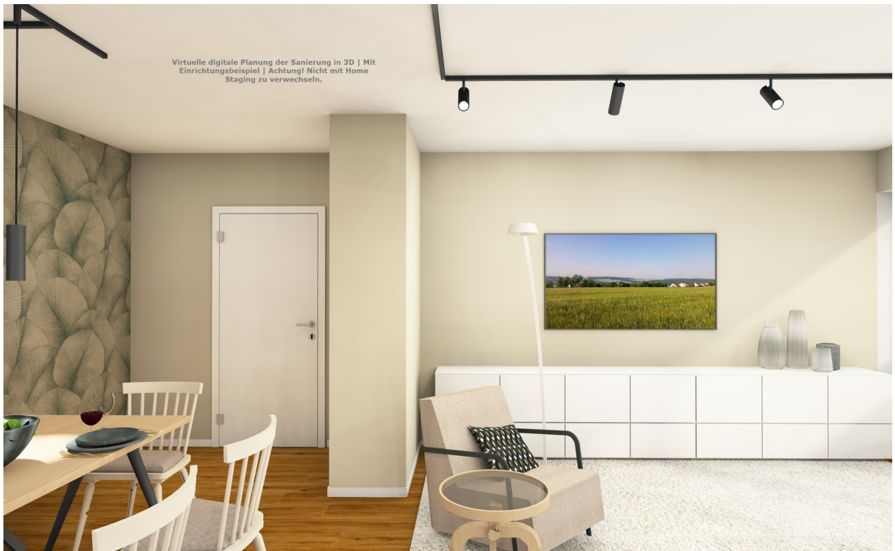
Wohnwand & Medienbereich Visu