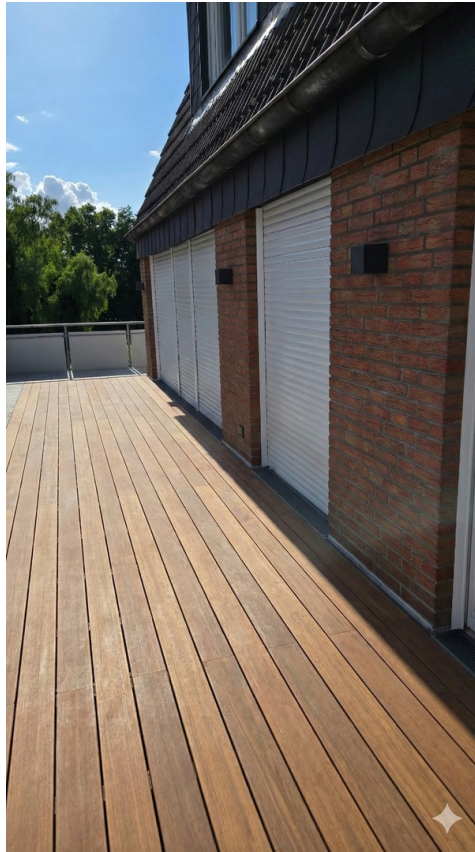
Neuer Boden und Beleuchtung