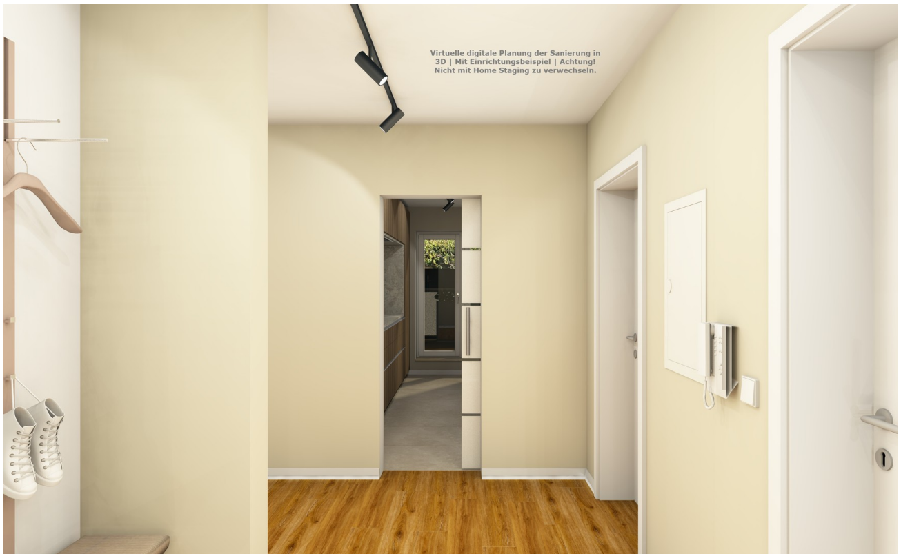
Freundlicher Flur (Planung)