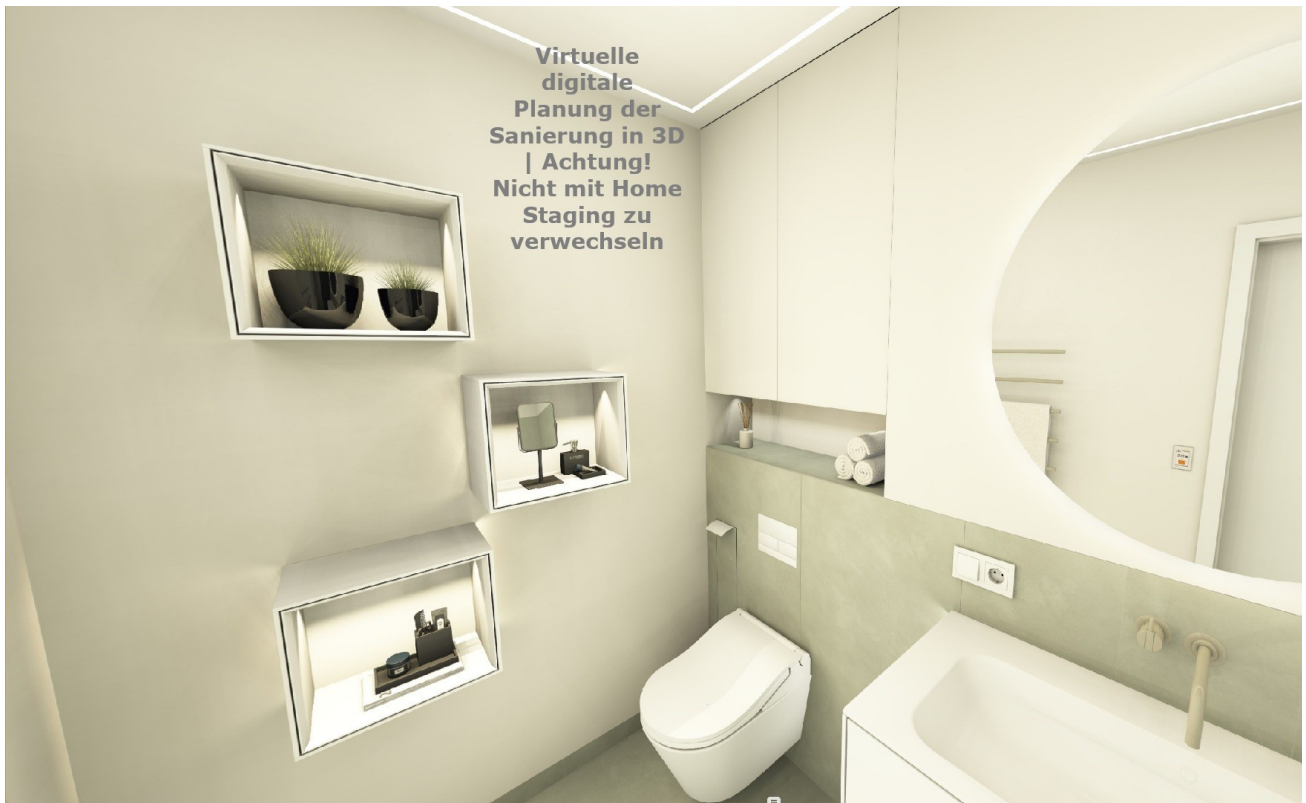
Helles Badezimmer (Planung)