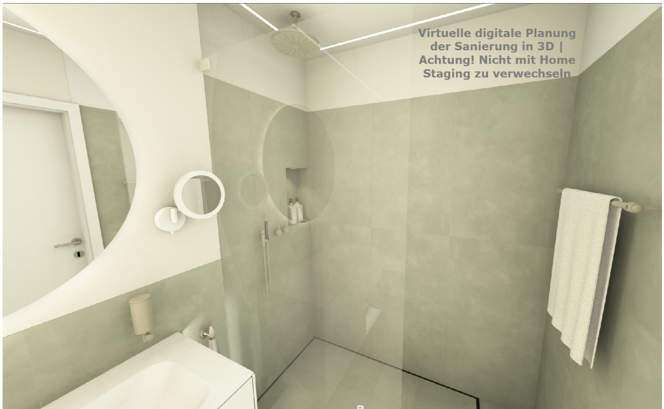
Modernes Duschbad (Planung)