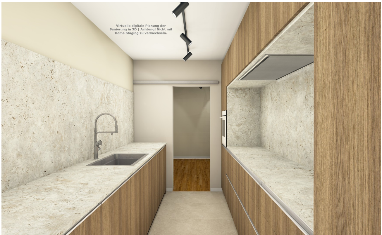
Küche mit viel Stauraum Visu