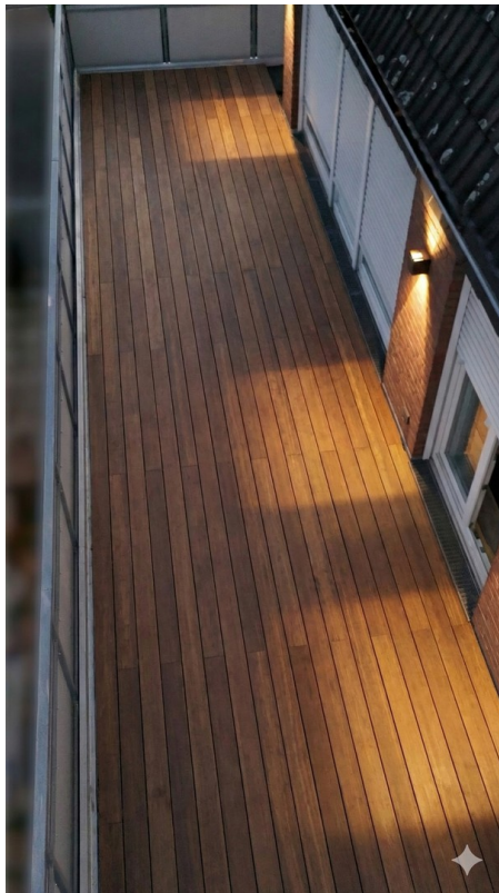
Terrasse neuer Boden