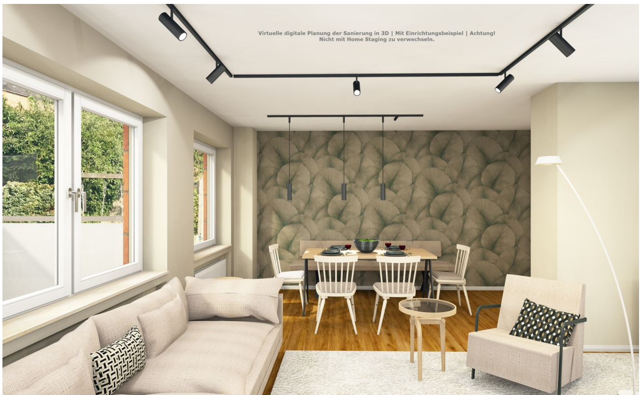
Heller Wohn-/Essbereich (Visu)