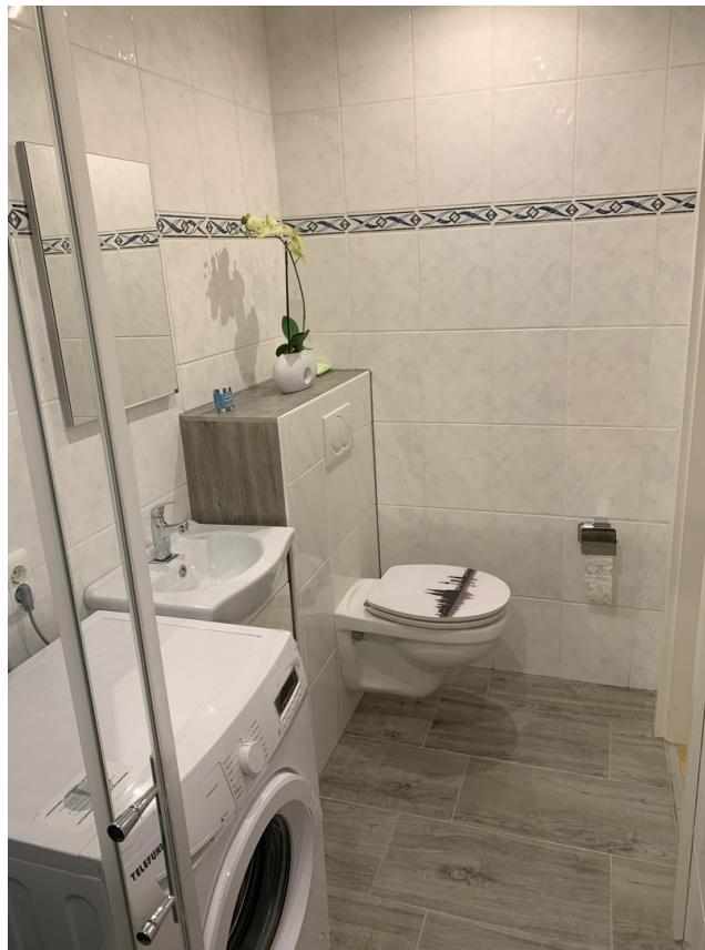
Gäste WC mit Dusche