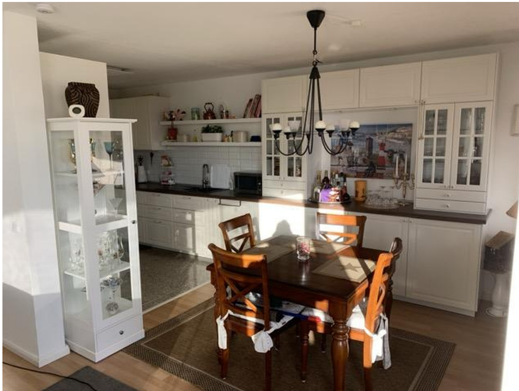
Blick vom Wohnzimmer in Küche