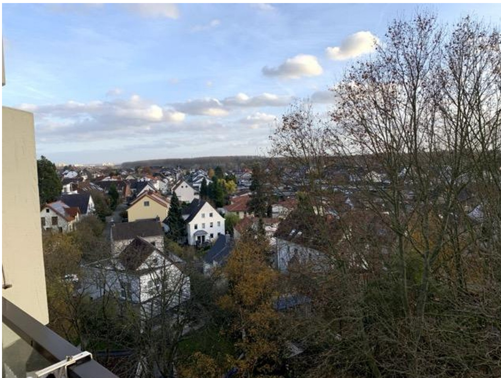
Aussicht nach Süden