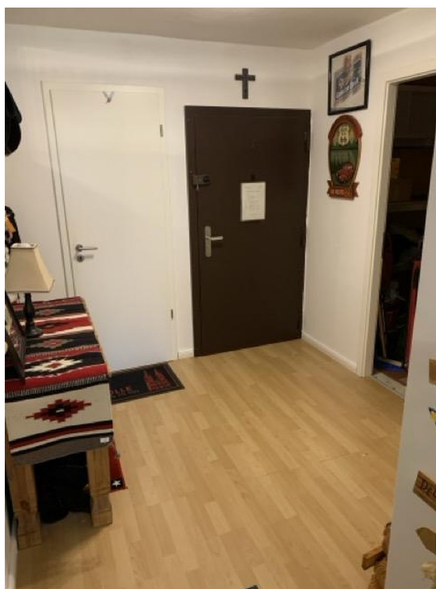
Flur mit Abstellraum