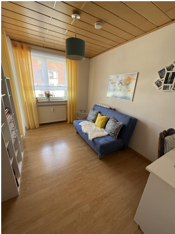
Kinder- / Gästezimmer