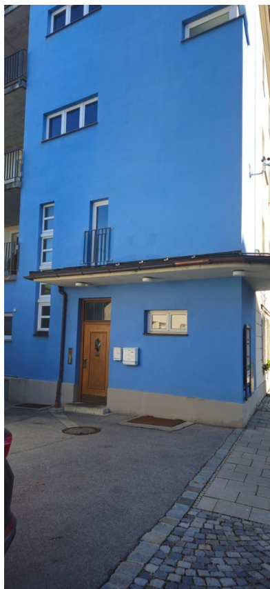
Eingang auf der Rückseite