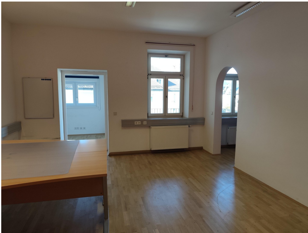
Blick in den Bürobereich