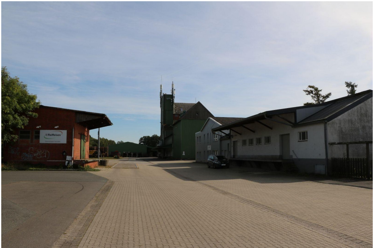
Blick über die Freifläche