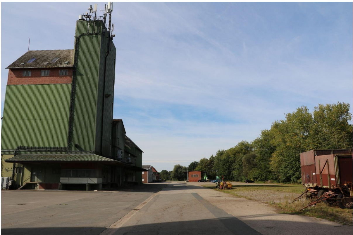
Blick über die Freifläche