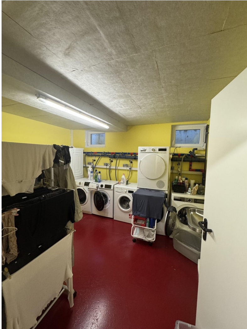
Waschküche im Keller