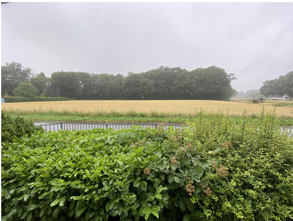
Aussicht aus Büro