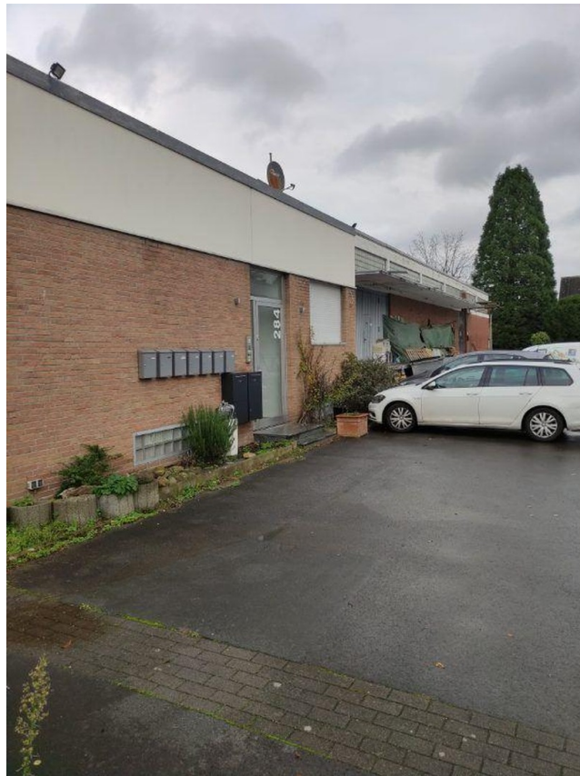
Parkplätze u. Eingang