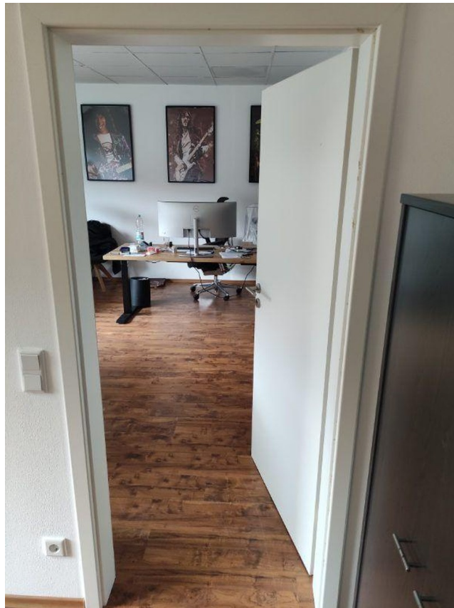
Übergang Büro № 3 zu № 4