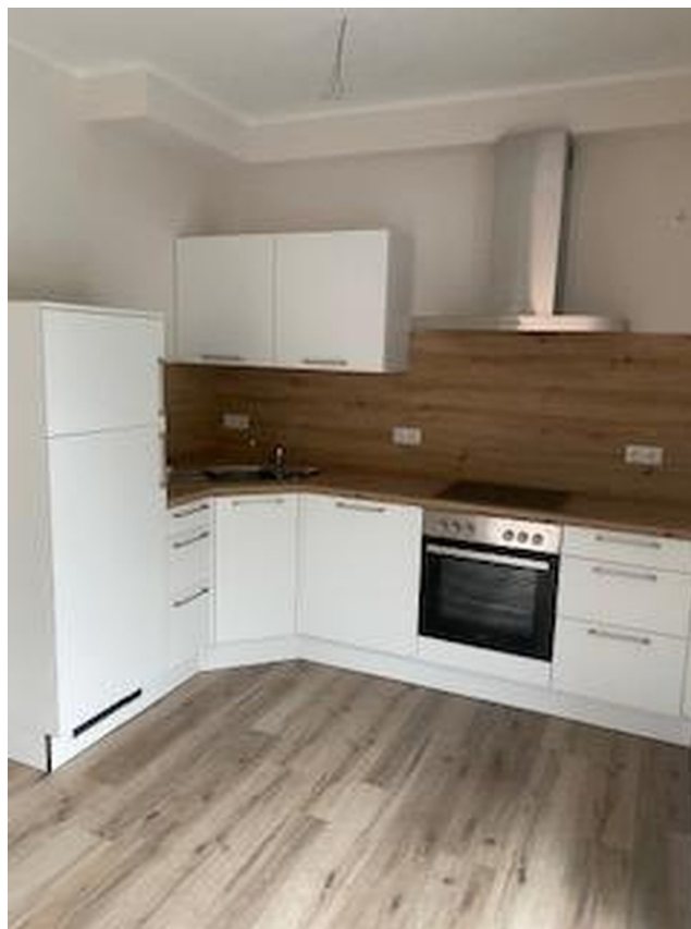
Einbauküche mit Spülmaschine