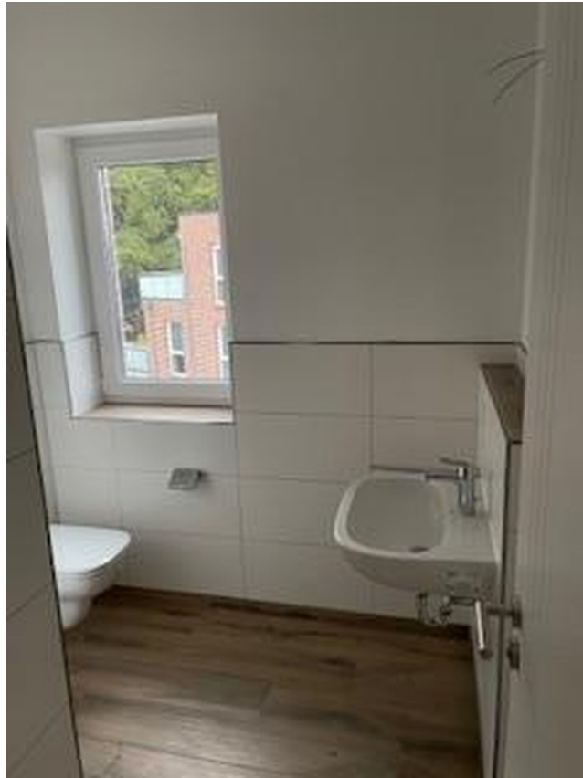
Bad mit Tageslicht