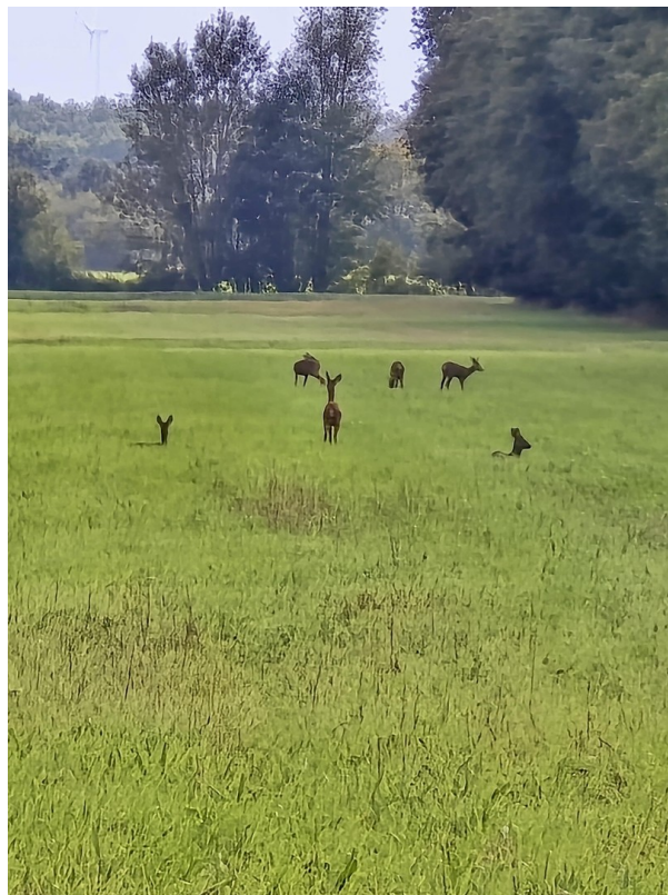
Wildleben auf dem Grundstück