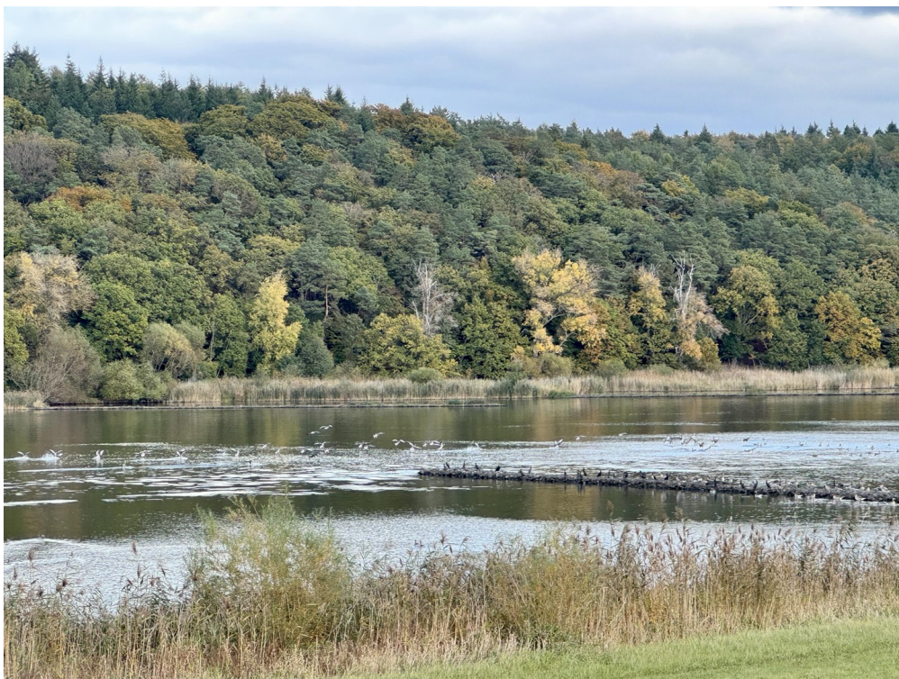
Elbe 5 Gehminuten entfernt