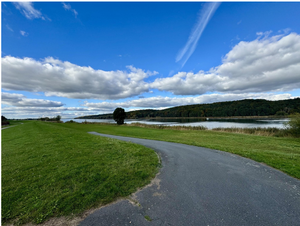
Radweg an der Elbe entlang