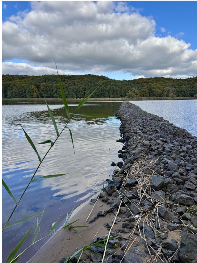
Elbe 5 Gehminuten entfernt