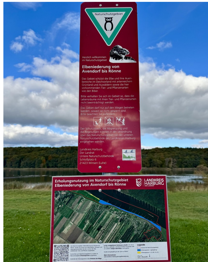
5 Min. zum Naturschutzgebiet