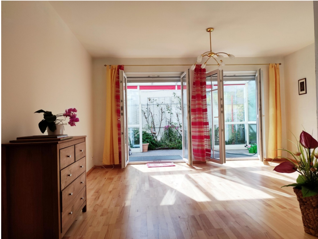
Wohnzimmer nach aussen