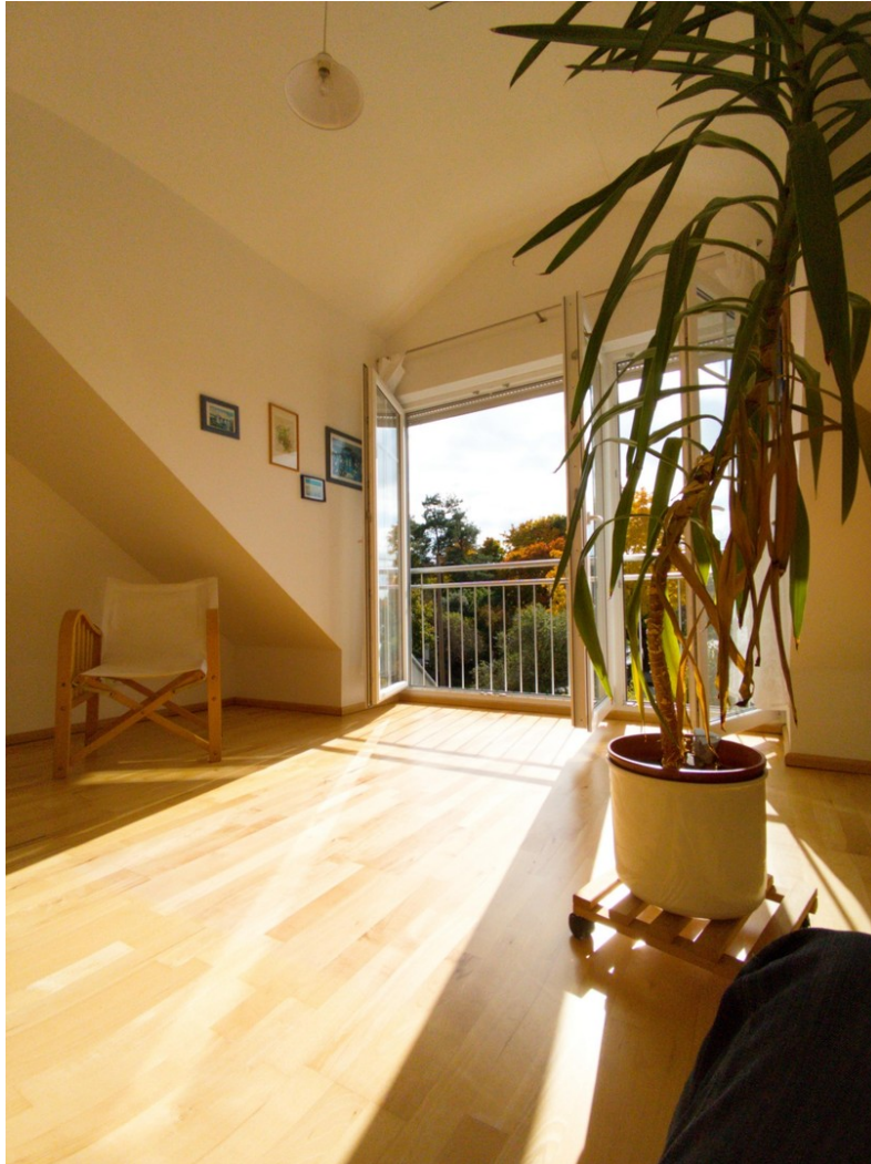
Zimmer 2 DG