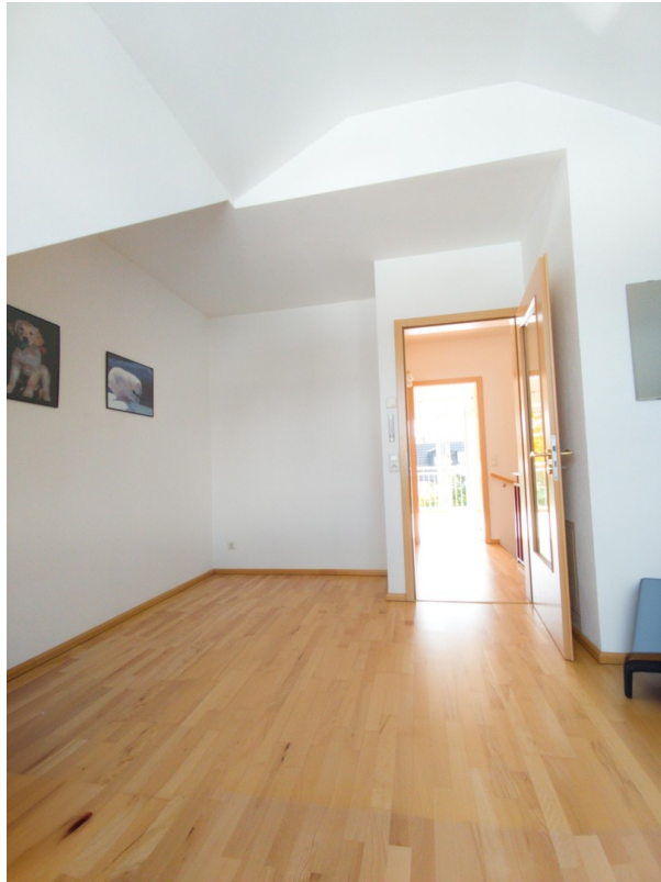
Zimmer 1 DG