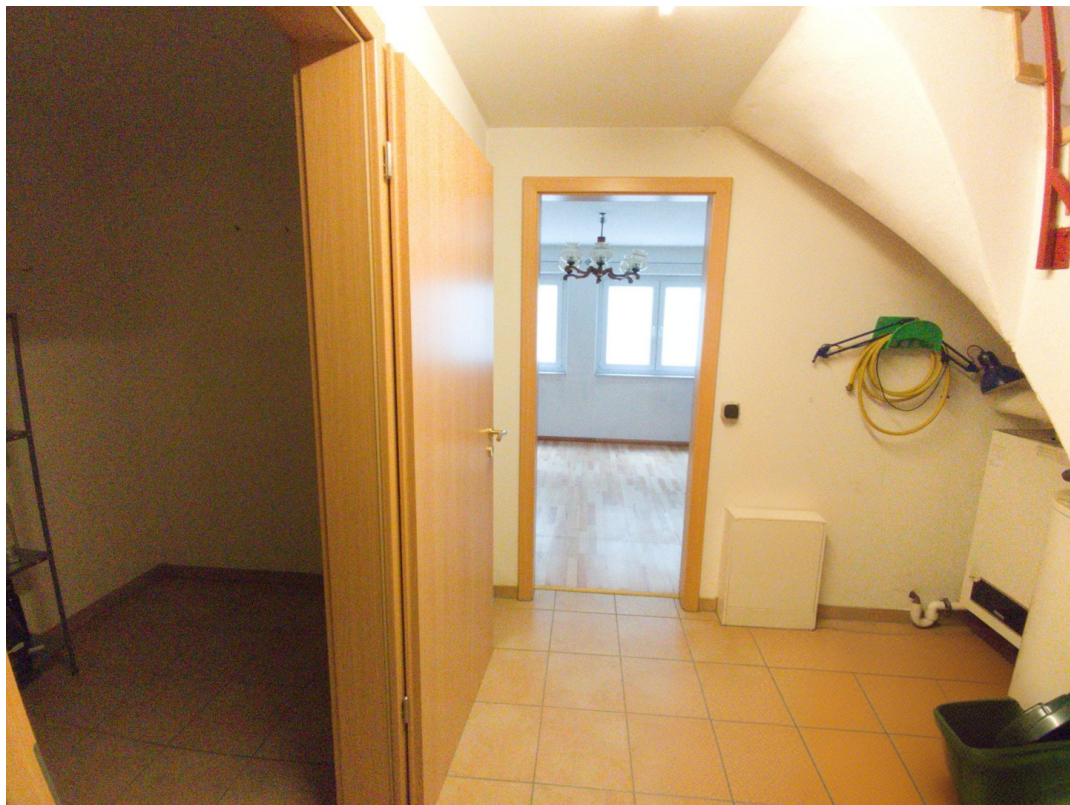
Keller, Heizung, Hobbyraum