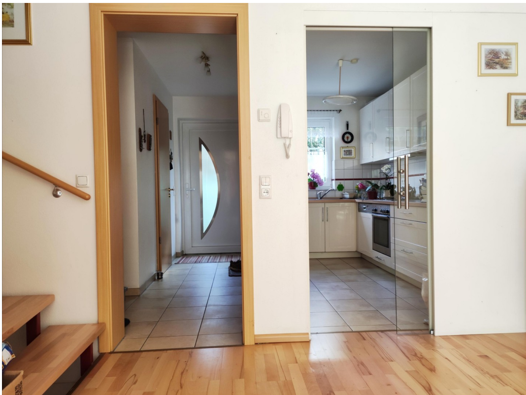
Küche, Flur, Gäste-WC