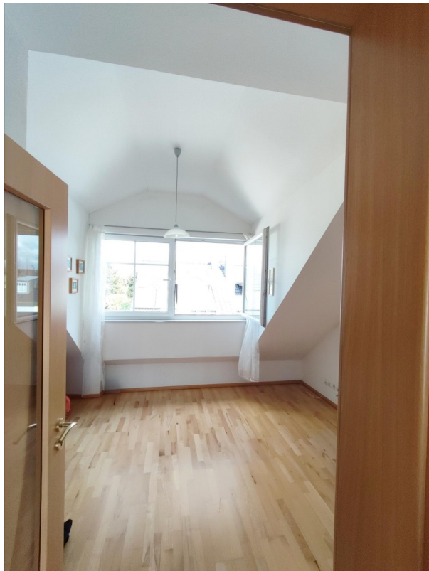
Zimmer 1 DG