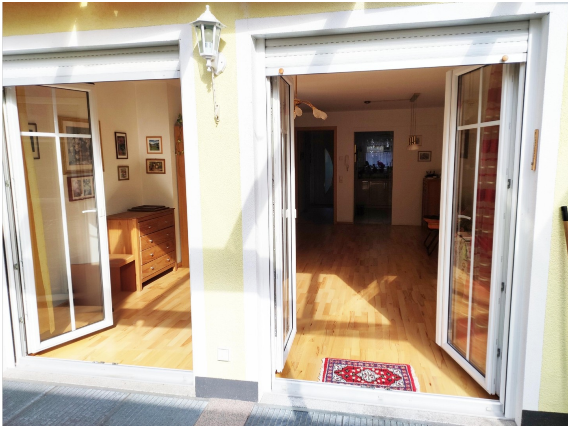
Wohnzimmer nach innen