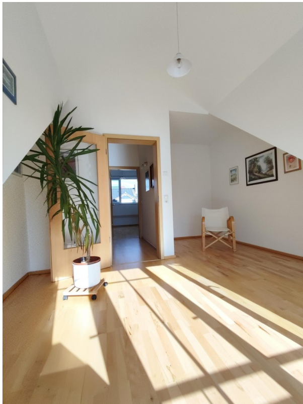
Zimmer 2 DG