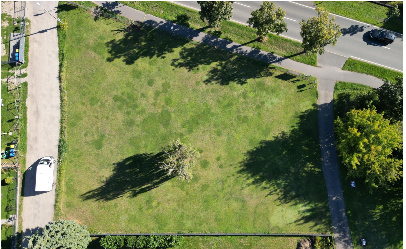
Grundstk. 1, ca. 1600qm teilbar