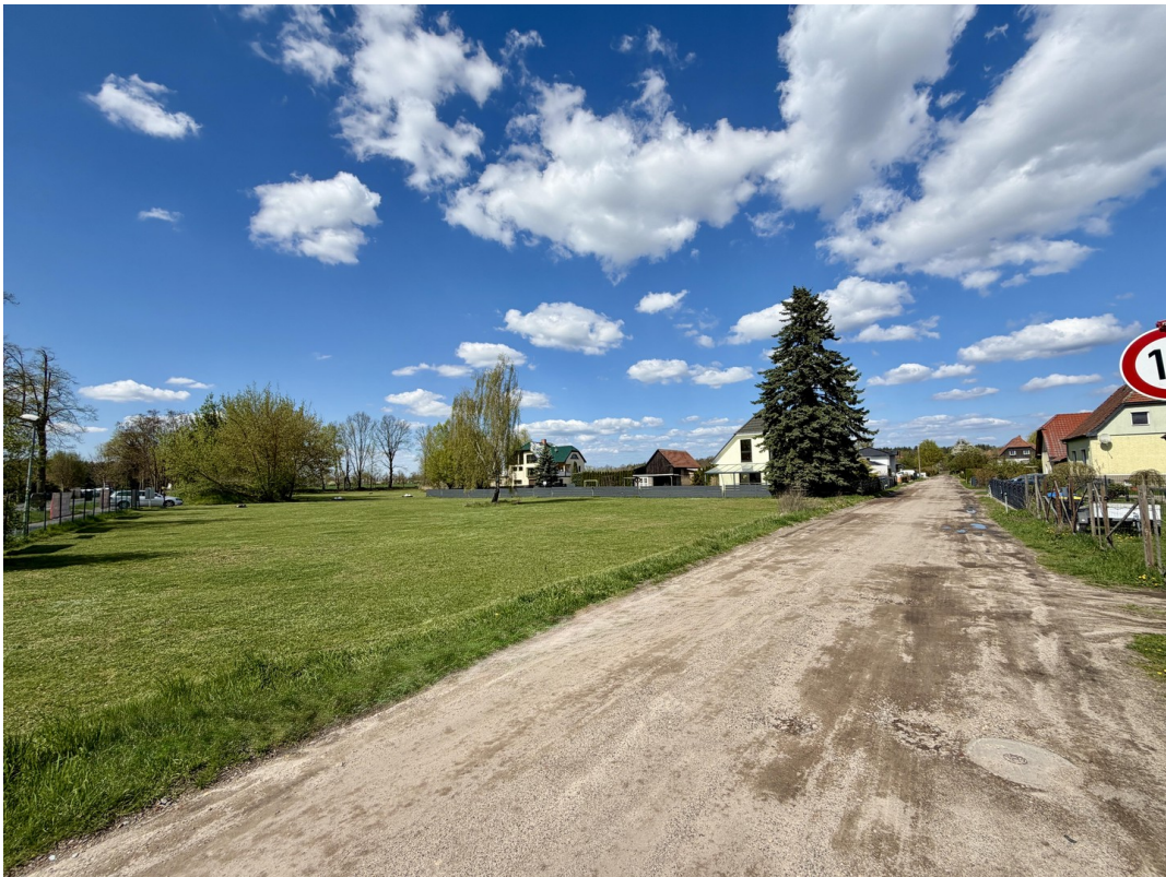
Teilans. Grundstk. 1, Nordweg