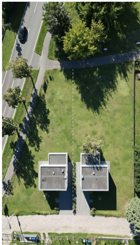
Grundstk. 1 - erste Idee...