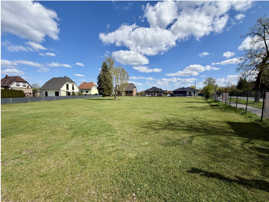
Grundstk 1, Ri Nordweg, Ri Ost