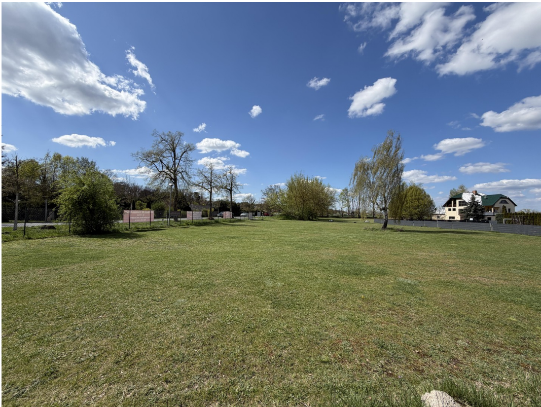
Grundstk 1, Blick vom Nordweg