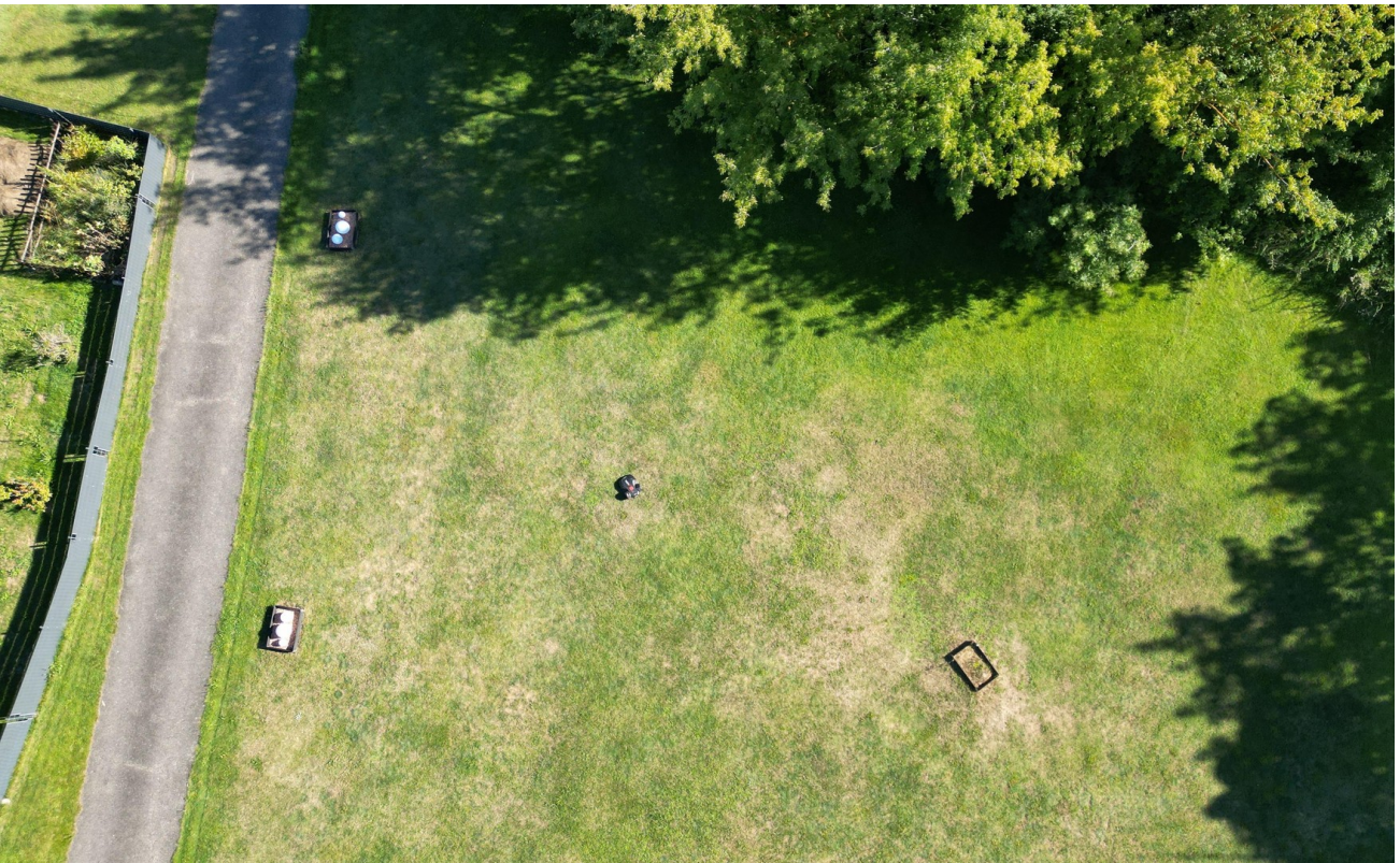
Grdstk 2 - ca. 2.400 qm