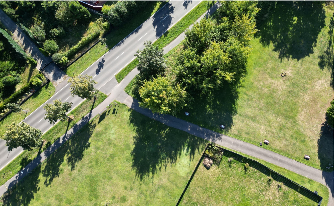
Grundstk. 1=vorne / 2=hinten