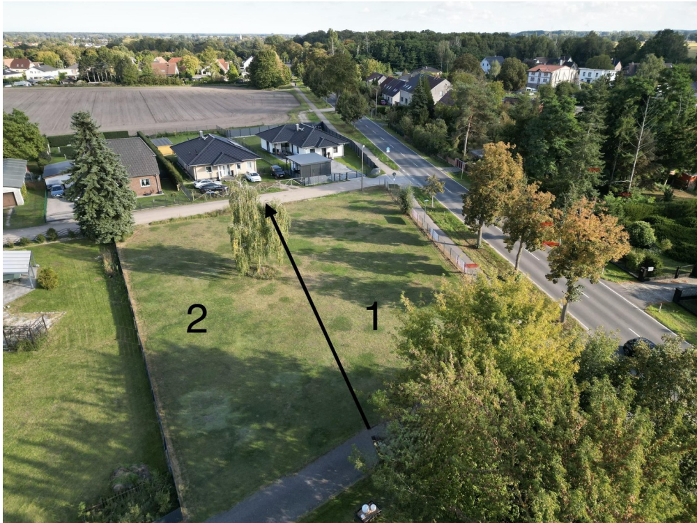
Grundstk.1 - hälftige Teilung