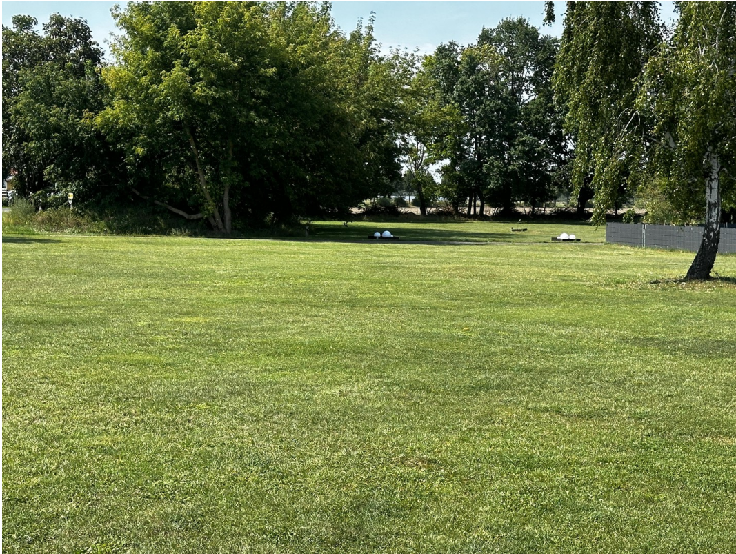
Ansicht vom Nordweg Ri. Westen