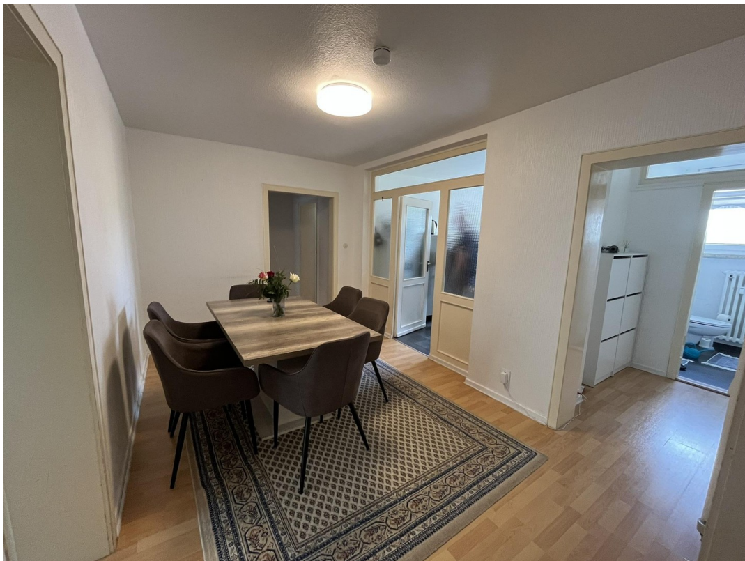
Blick zur Garderobe + Gäste-WC