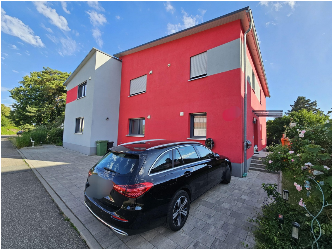
Front View 3