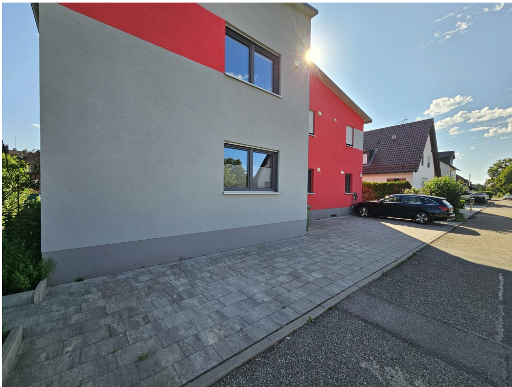
Front View 2