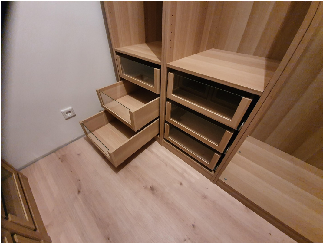
Begehbarer Schrank Schlafzimmer