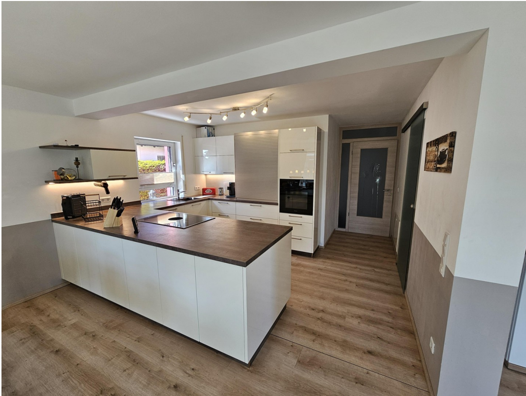
Offene Küche mit Insel