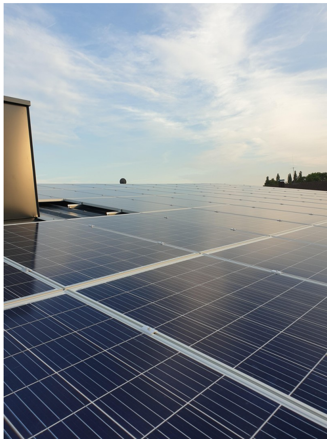
PV Anlage Dach 25KWp