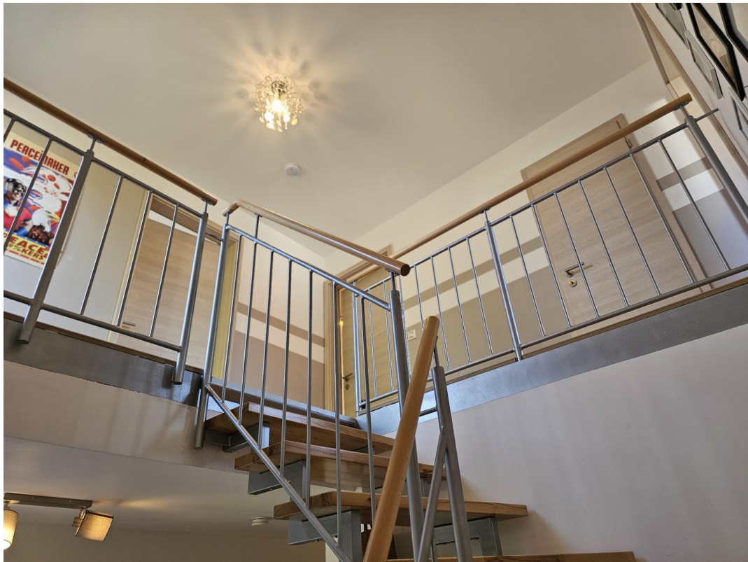
Zugang zu Wohnbereich im OG