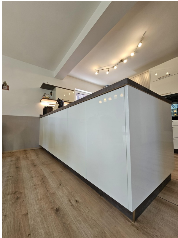
Offene Küche mit Insel