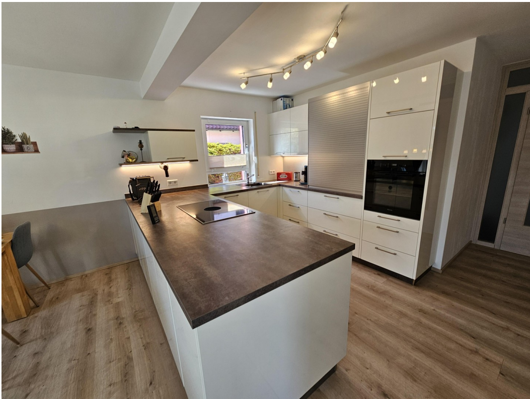
Offene Küche mit Insel