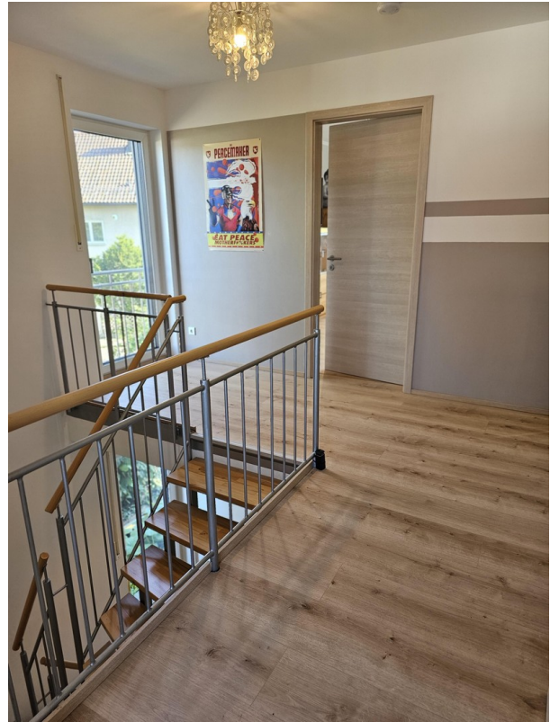
Zugang zu Wohnbereich im OG