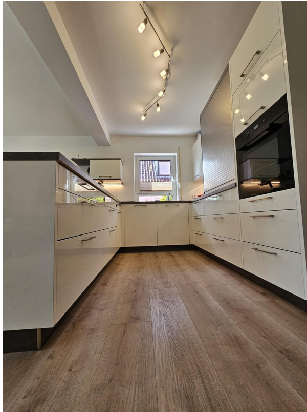
Offene Küche mit Insel