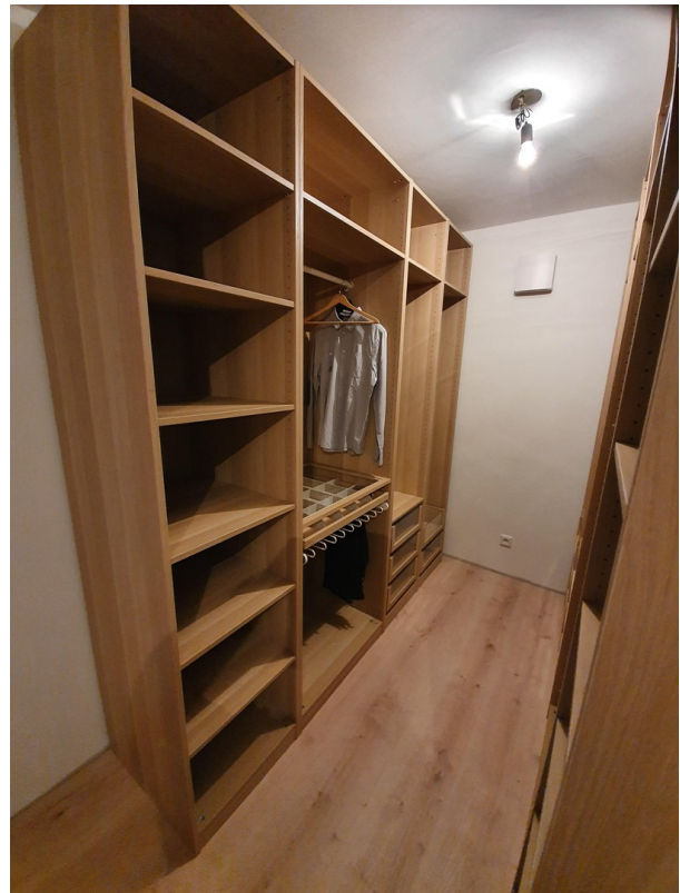
Begehbarer Schrank Schlafzimmer