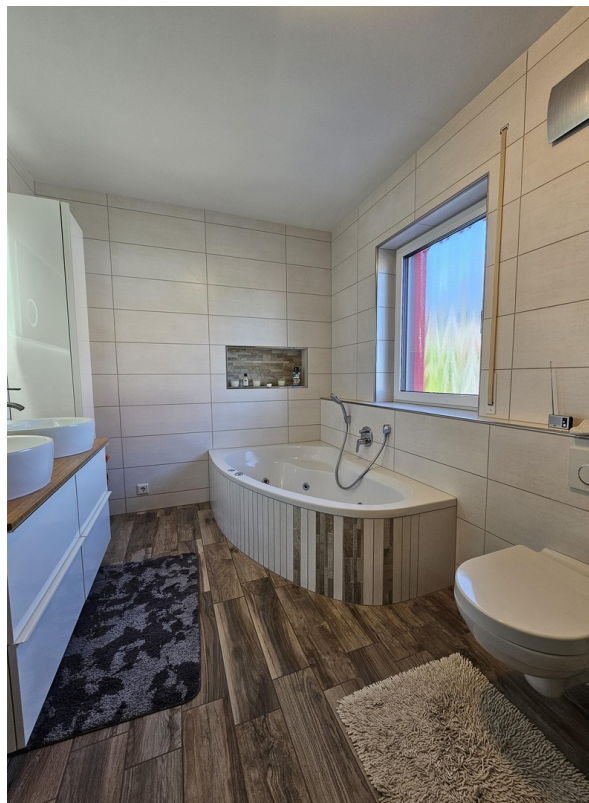
BAD 1 mit Whirlpool