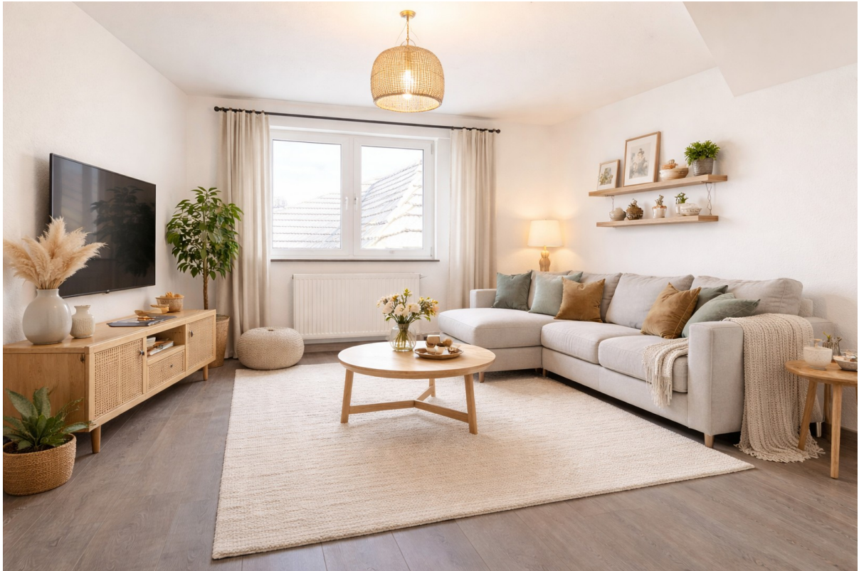
Wohnzimmer - Staging