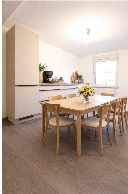
Esszimmer - Staging