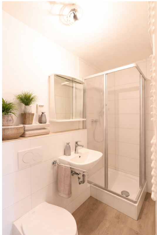
Badezimmer - Staging