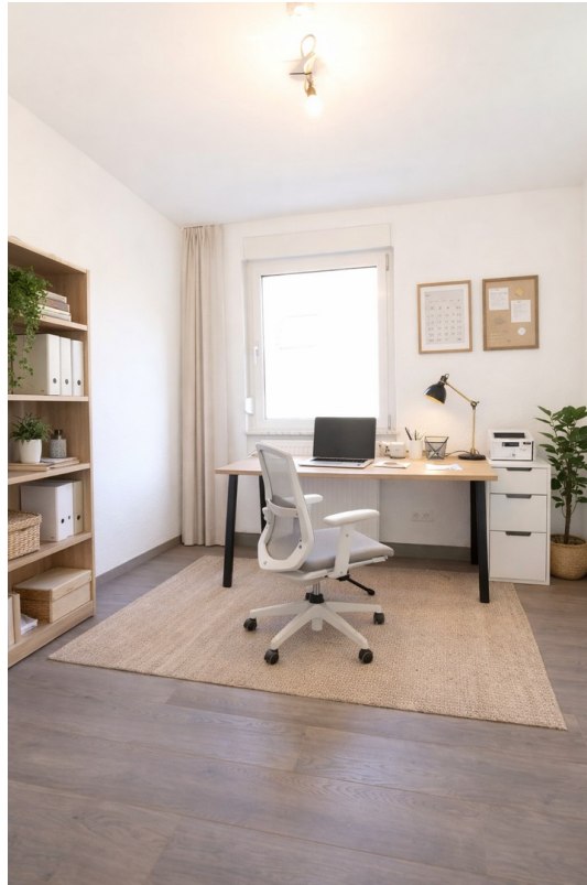
Arbeitszimmer - Staging