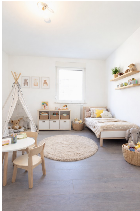
Kinderzimmer - Staging