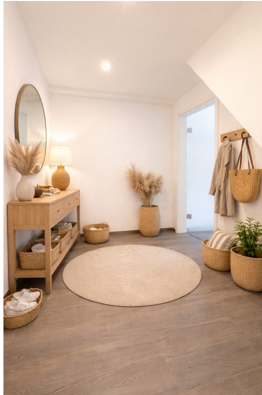
Flur - Staging