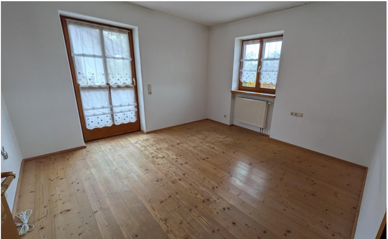
Schlafzimmer 1. OG