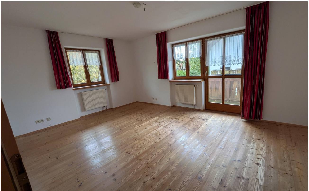
Schlafzimmer 1. OG