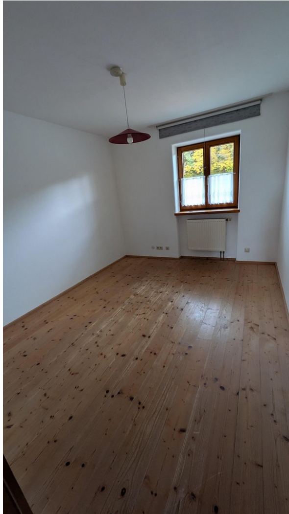
Schlafzimmer 1. OG