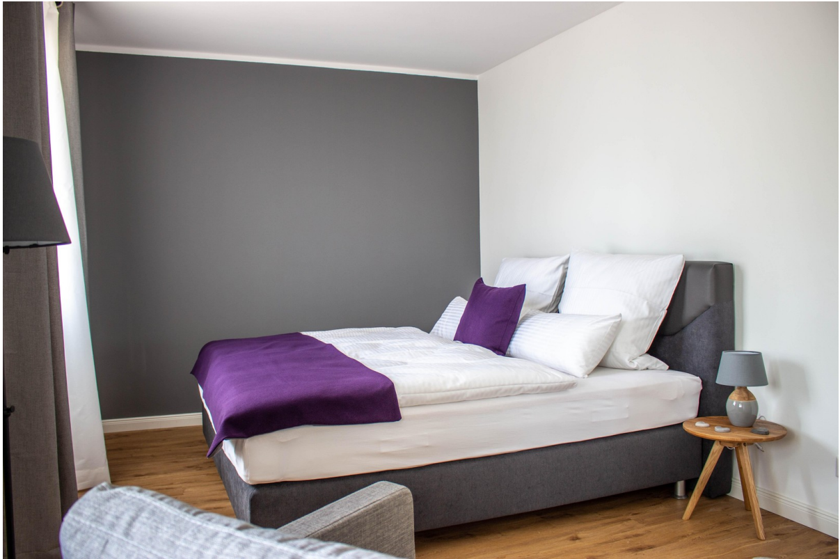
Whg EG Haus links Schlafzimmer