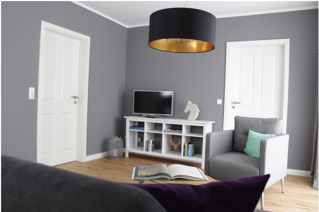
Whg EG Haus links Wohnbereich