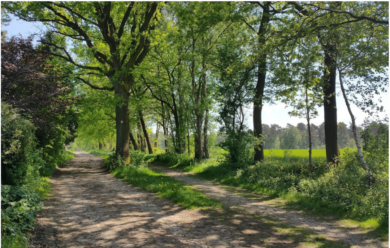
Wanderweg vor der Haustür