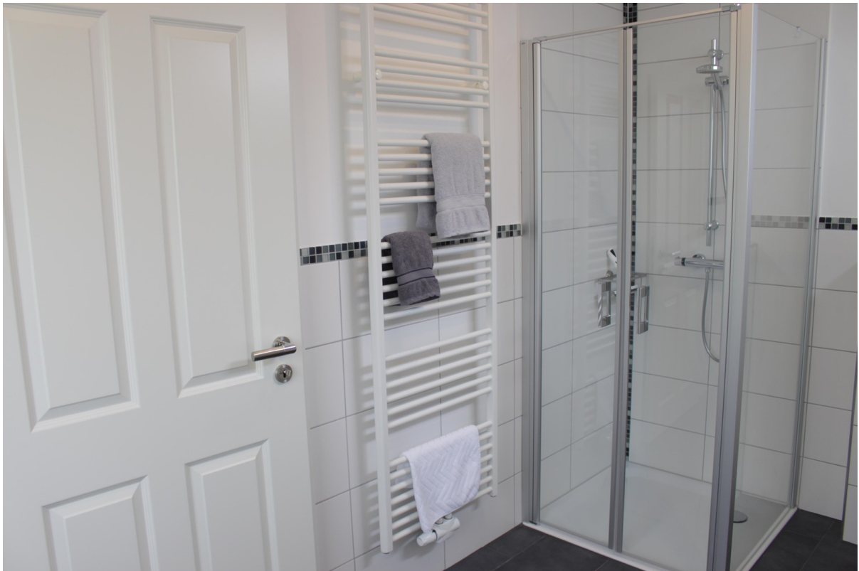
Whg EG Haus links Bad