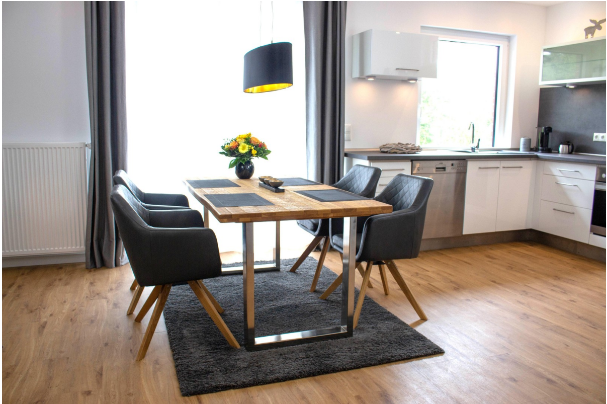
Whg EG Haus links Essbereich