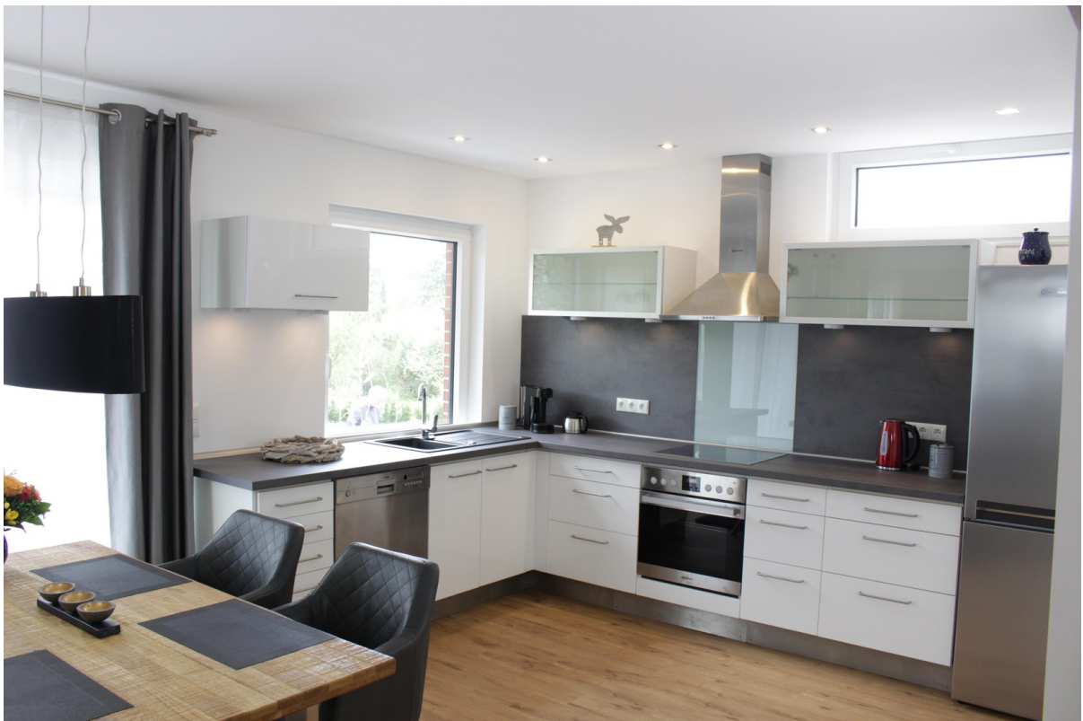
Whg EG Haus links Küche