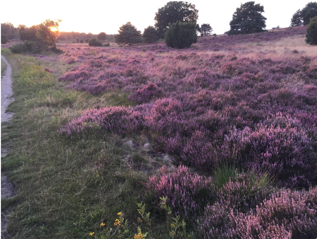
Heidefläche in 5 Min Fußweg