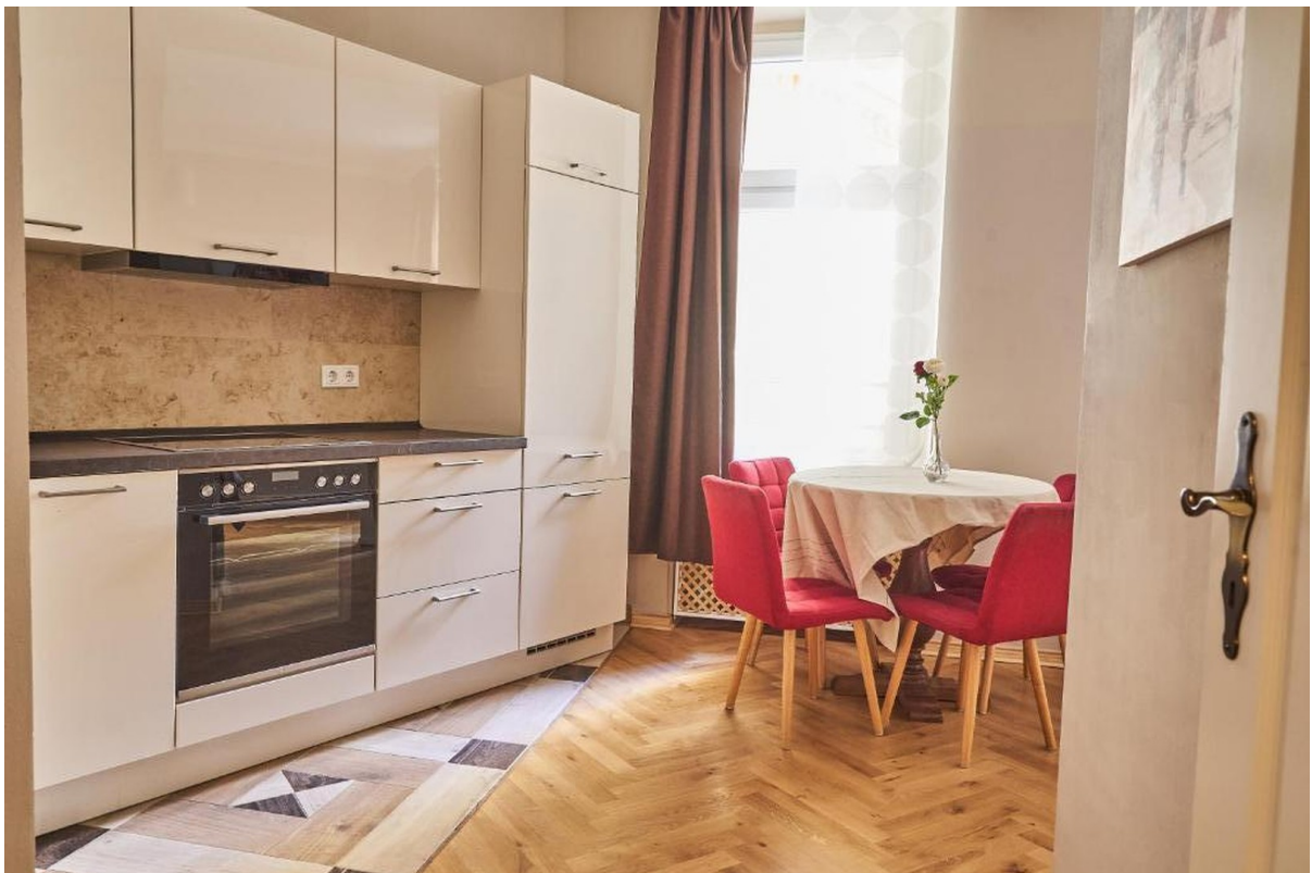
Küche mit Essbereich