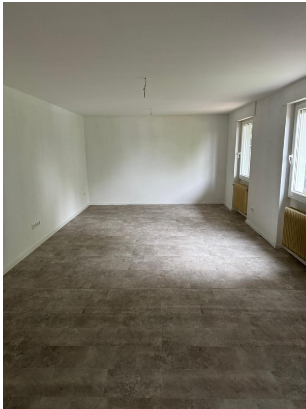
Wohnung 76QM - Wohn-Esszimmer