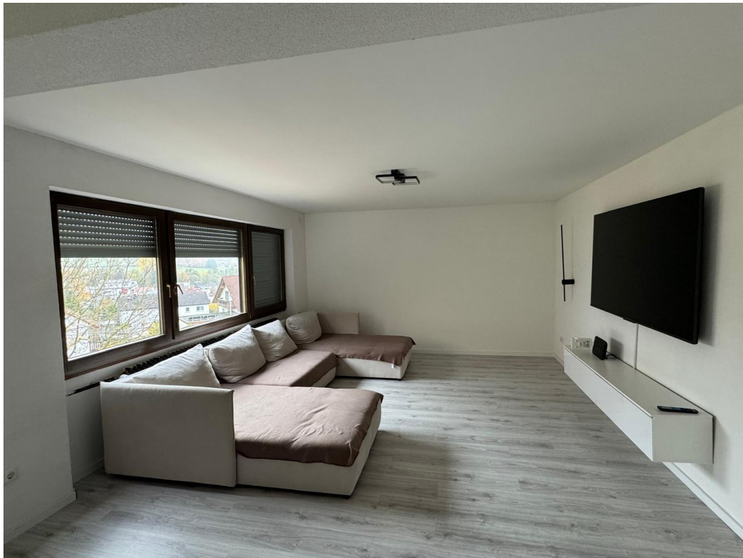
Wohnung 104QM - Wohnzimmer