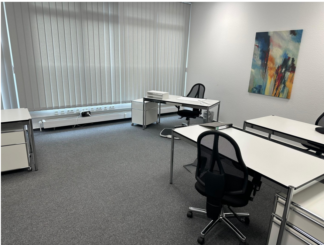
Shared Office Space