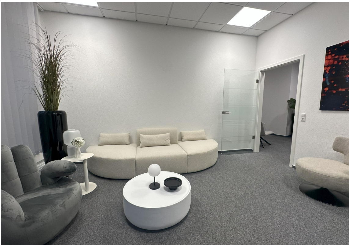
Lounge 2 / Empfang