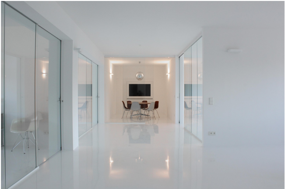
Flur / Meeting