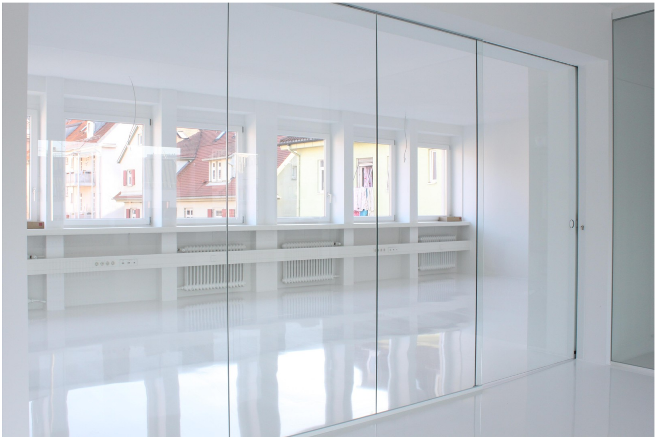
Exklusivfläche Raum 1