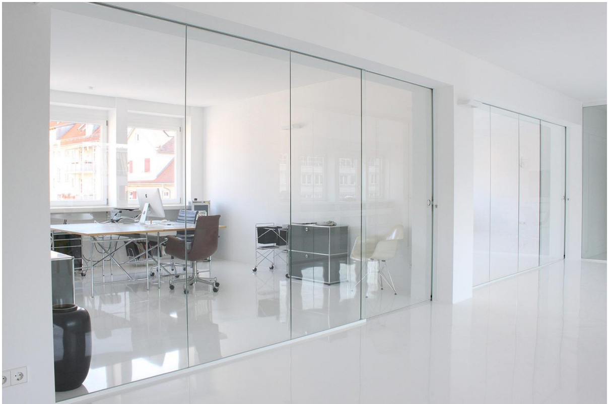
Exklusivfläche Raum 2