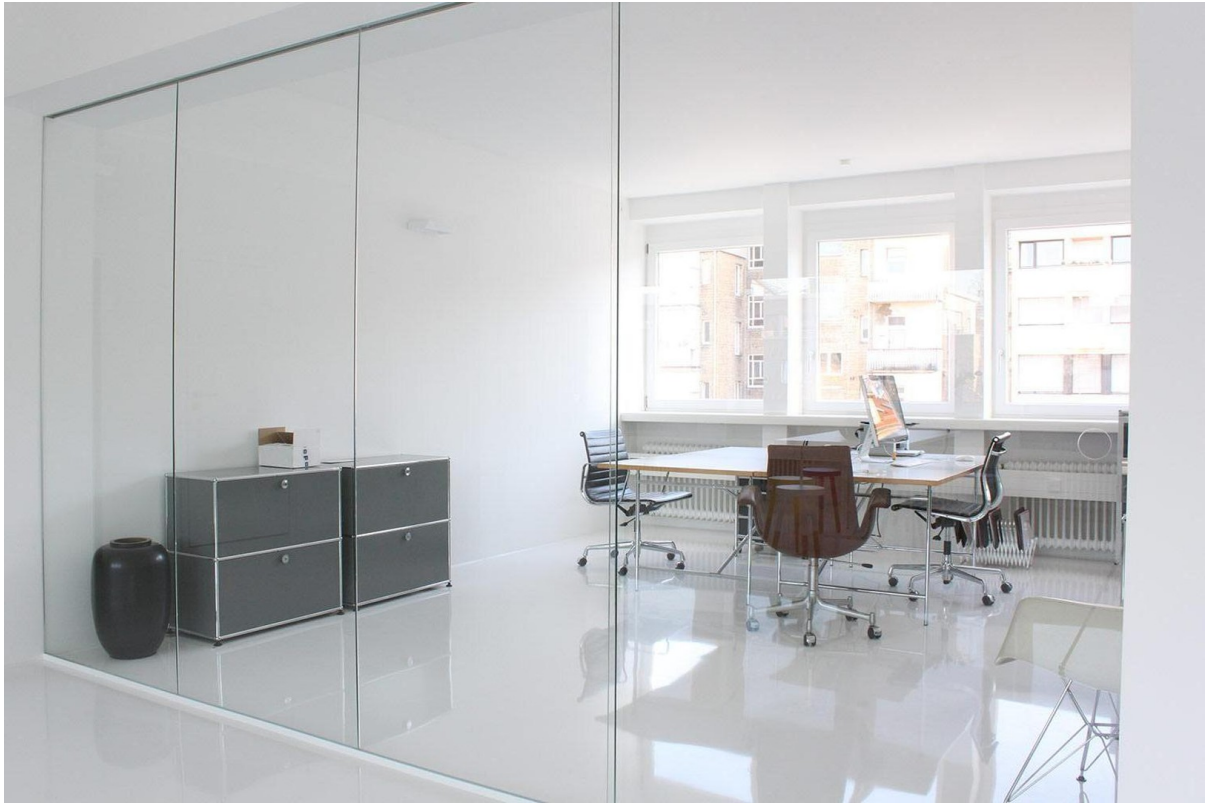
Exklusivfläche Raum 2