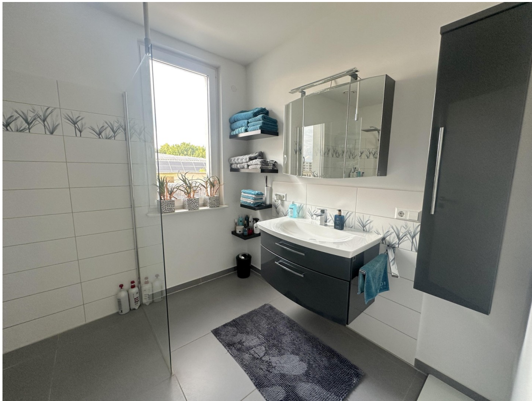
DG - Badezimmer