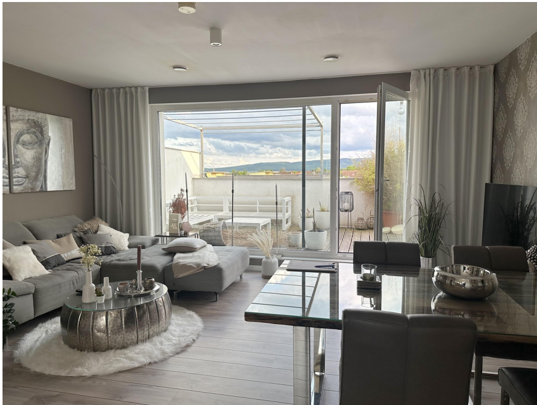
DG - Wohn-/Essbereich