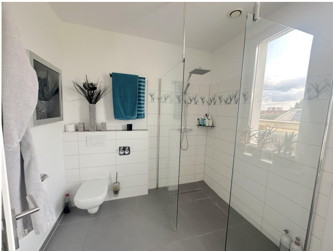
DG - Badezimmer