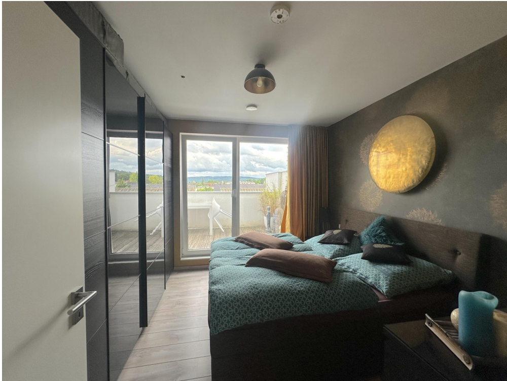
DG - Schlafzimmer