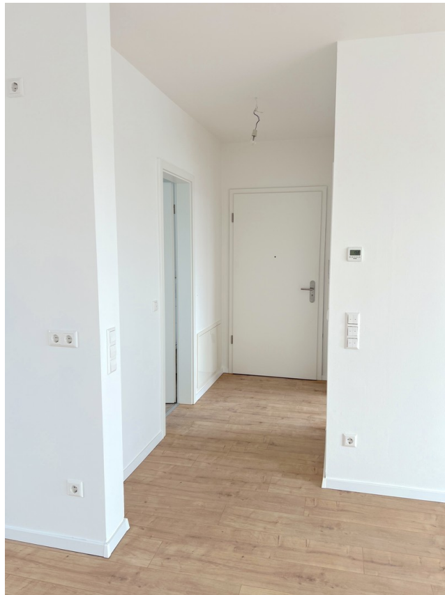
DG - Flur/Eingang