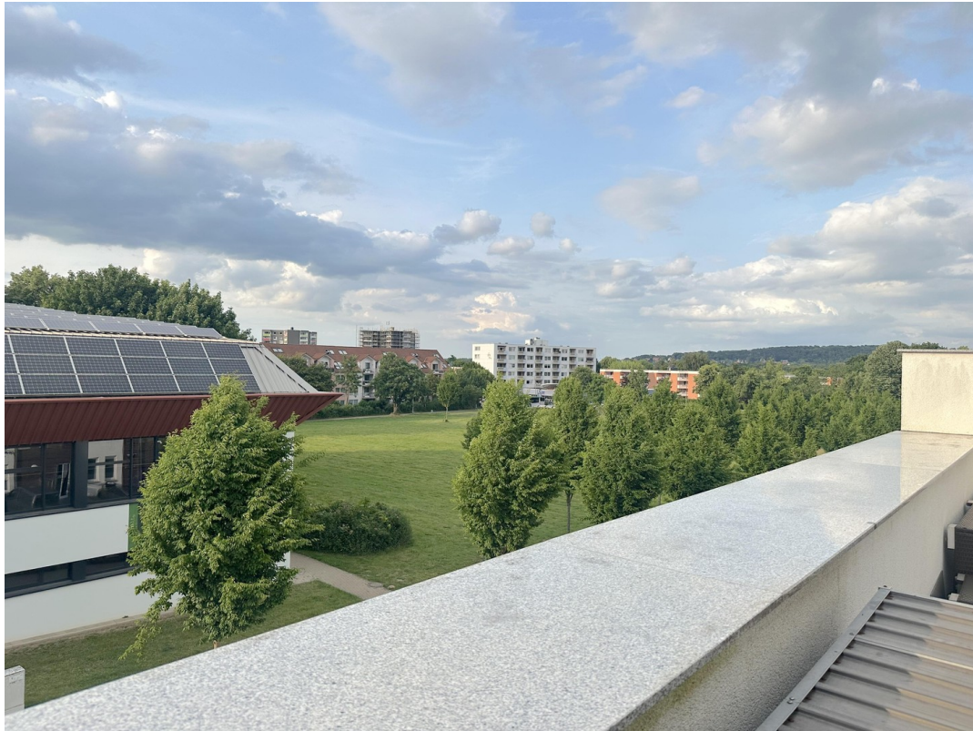
DG - Ausblick