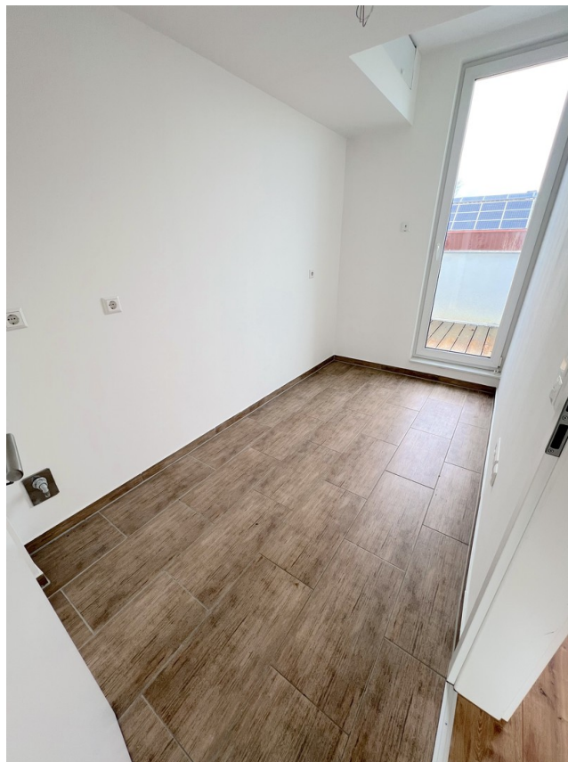
DG - Hauswirtschaftsraum