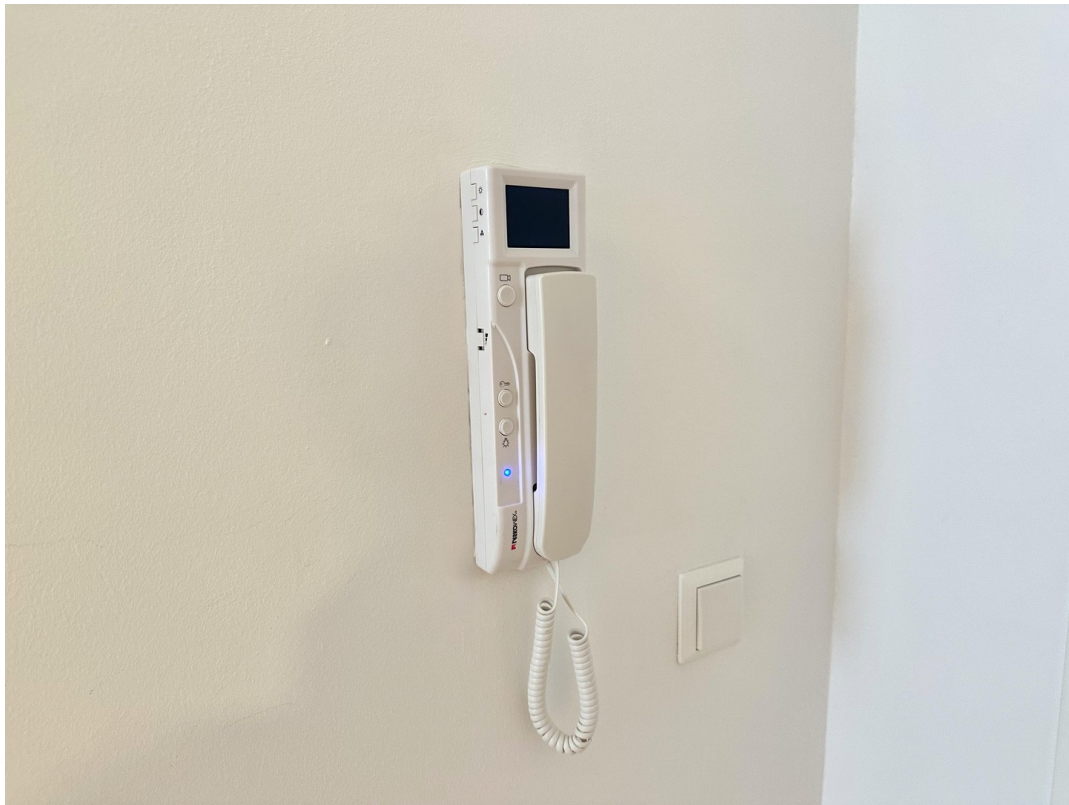
Klingelanlage mit Video