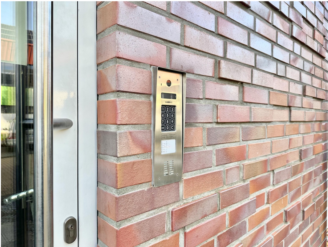
Klingelanlage mit Video