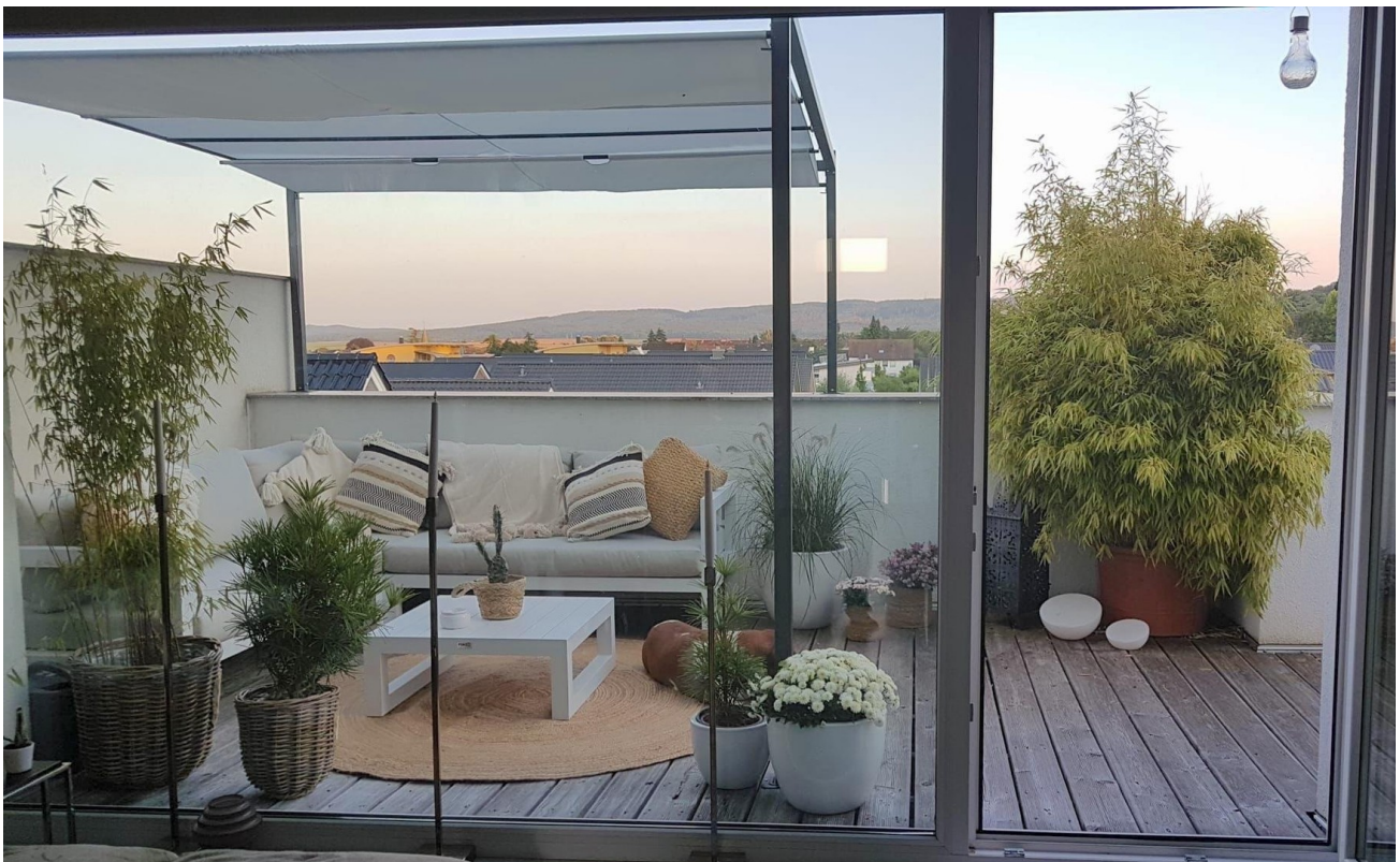
DG - Ausblick