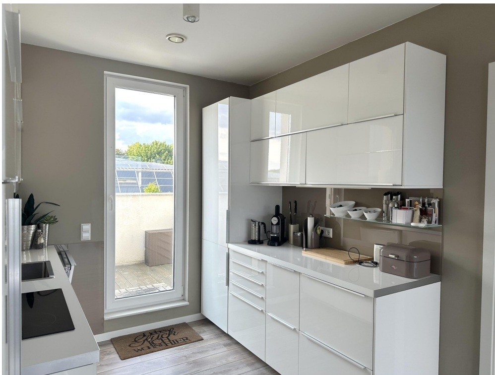
DG - Küchenbereich