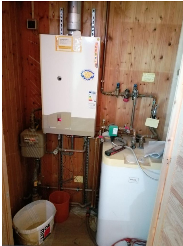
Heizung mit Warmwasserspeicher