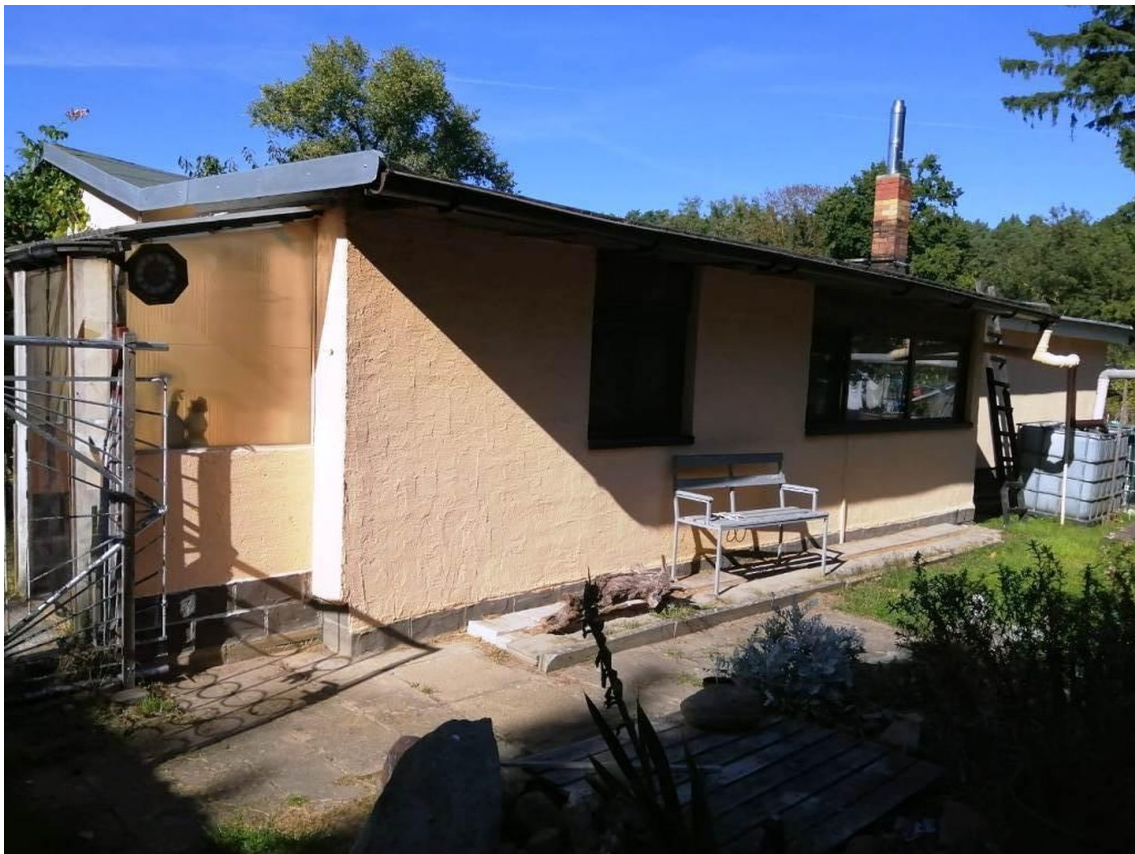
Seitenansicht Bungalow 1