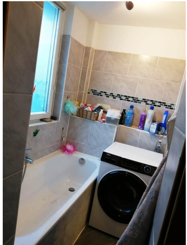
Wannen-Duschbad mit We