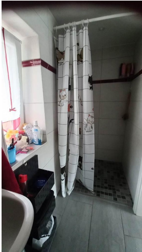
Duschbad Haus 1