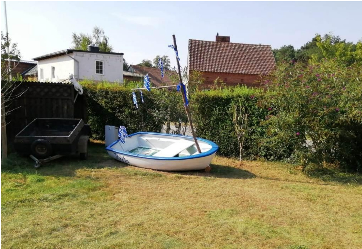
vordere Ansicht vom Grundstück