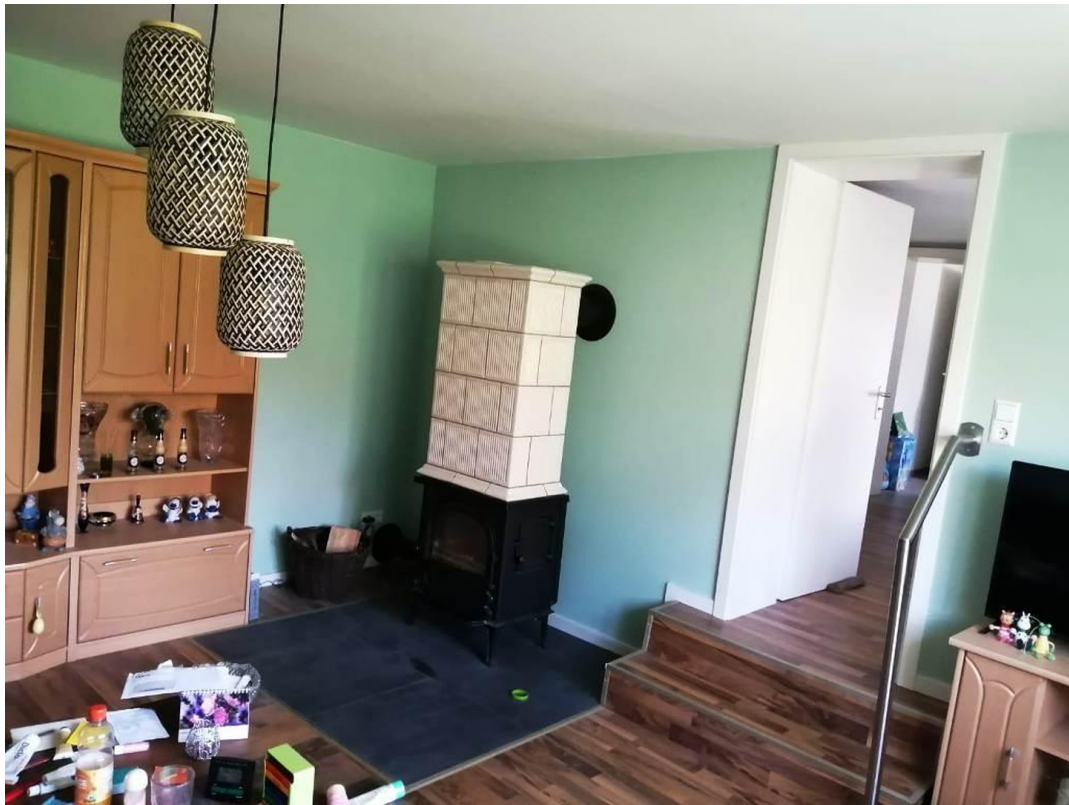
Wohnzimmer Bungalow1 mit Kamin