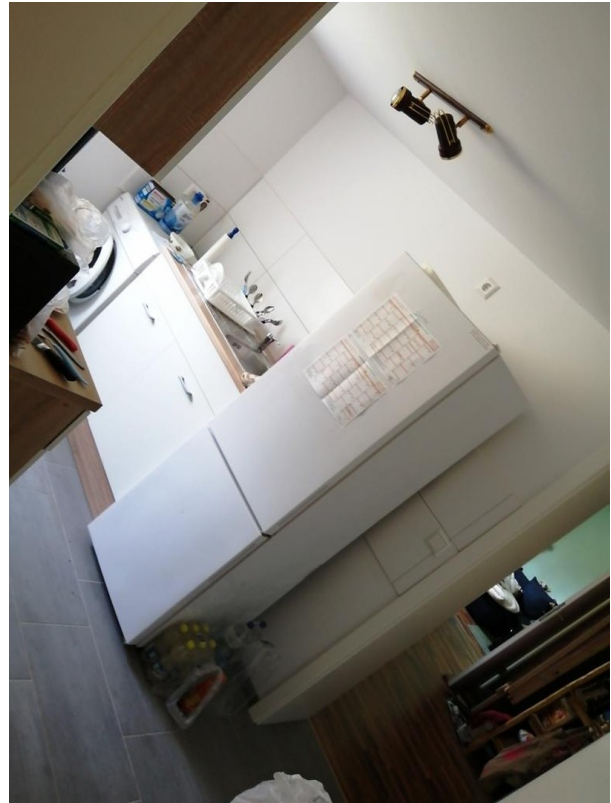
Küche Haus 1