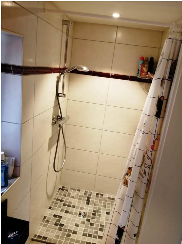
Duschbad Bungalow 1