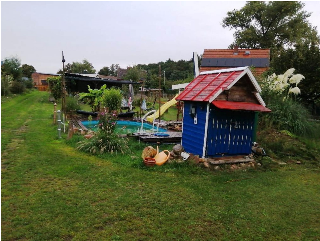
Blick auf Zufahrt Grundstück