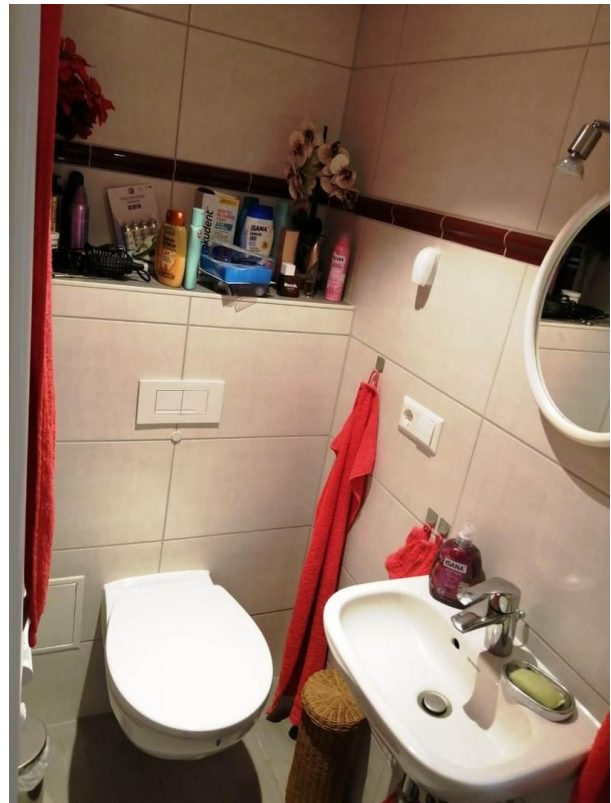
Duschbad Bungalow 1