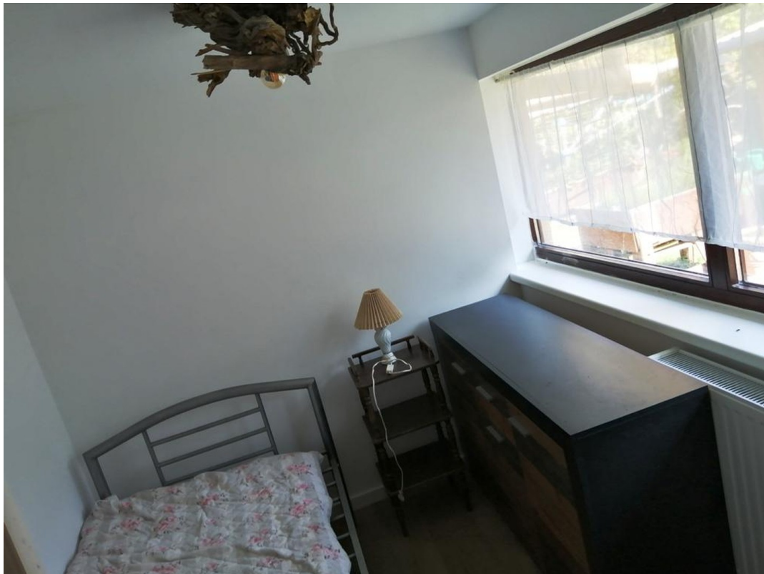
kleines Zimmer Haus 1