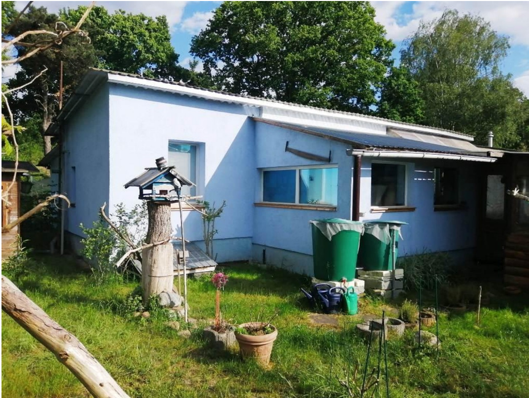
Blick auf Bungalow