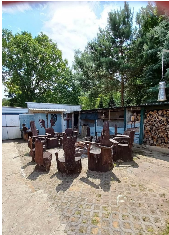
Sitzgruppe an feuertelle