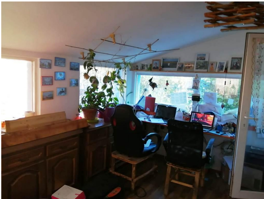
Anbau Büro Bungalow 2