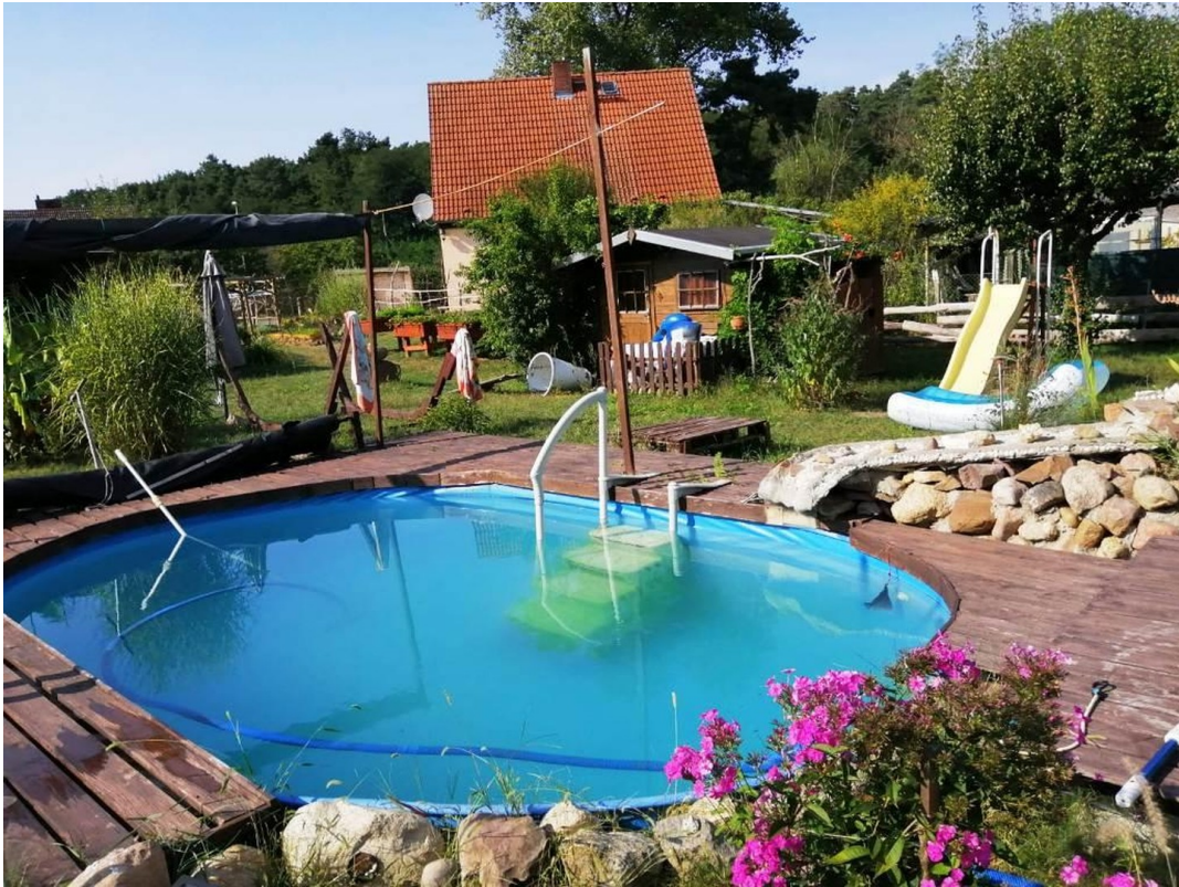
Blick auf Pool und Gartenhaus