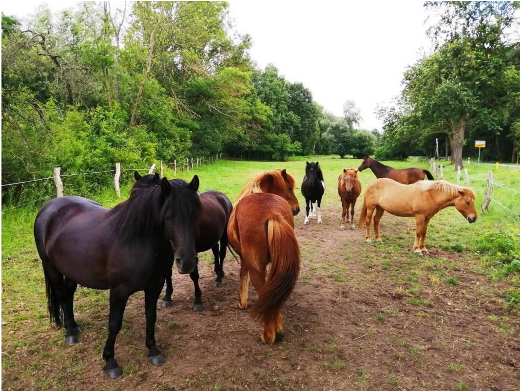
Pferdekoppel am Grundstück