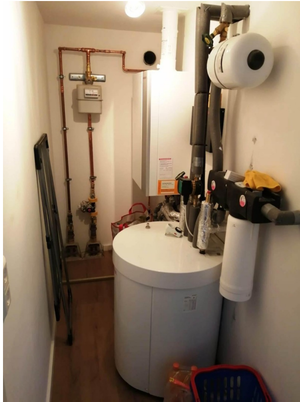
Heizanlage Bungalow 1