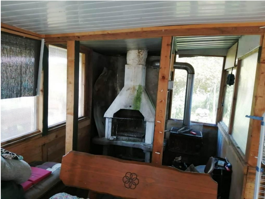
Anbau-Partyraum mit Grill