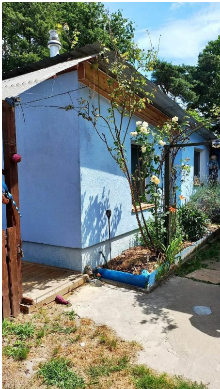
Eingangsbereich Bungalow 2