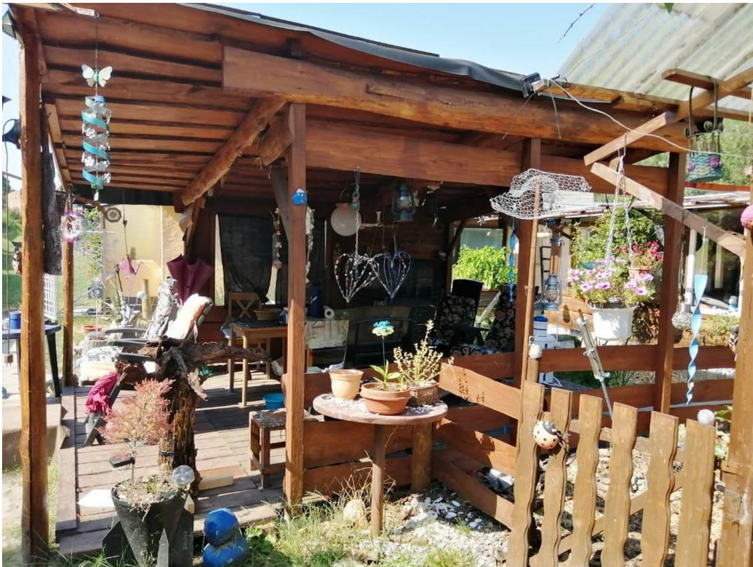
gemütlich überdachte Sitzecke