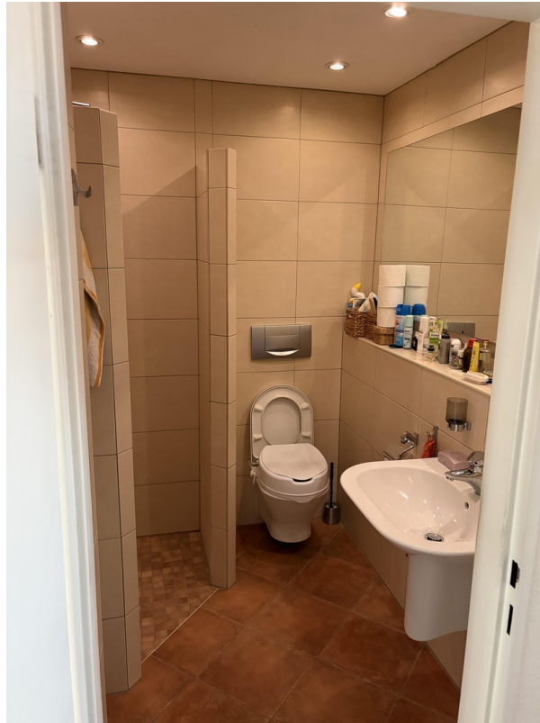
Gäste WC EG