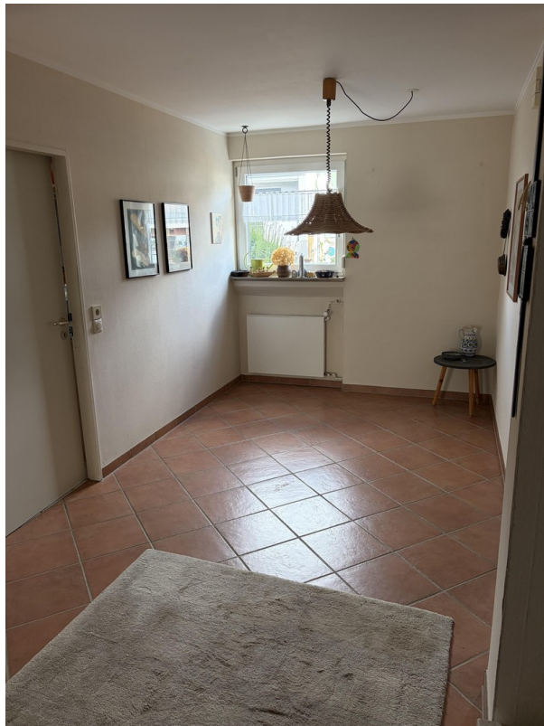
Diele mit Tür zur Küche