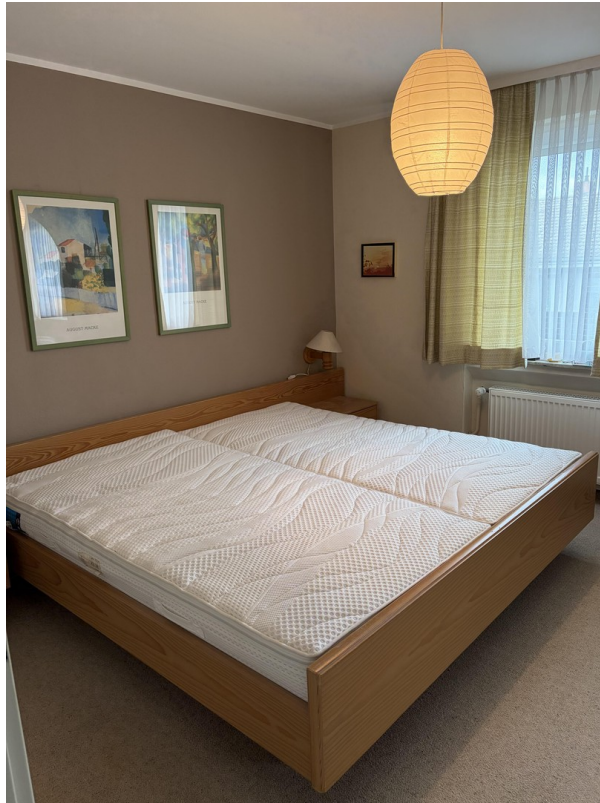
Schlafzimmer 1. Stock