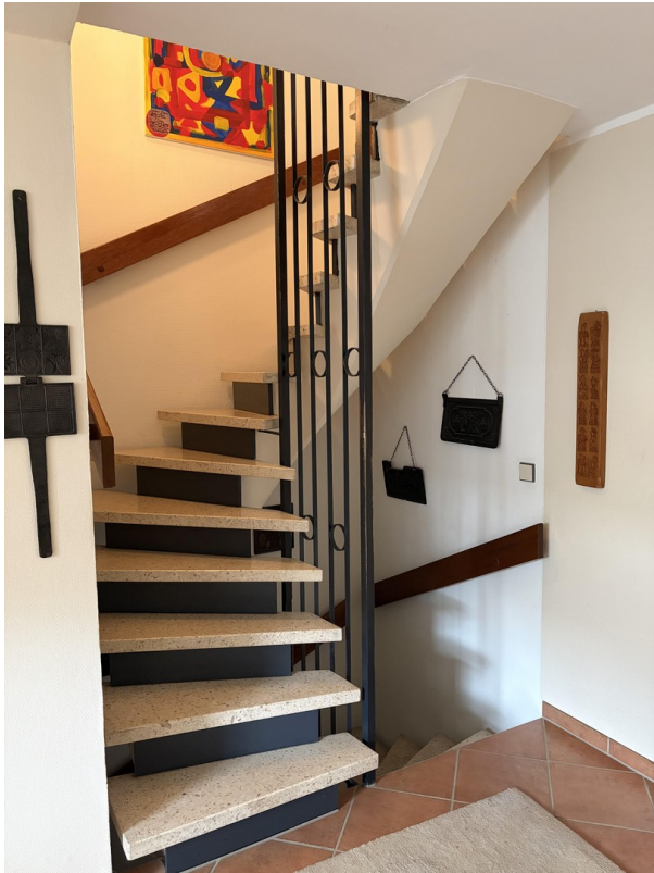
Treppe zum 1. Stock