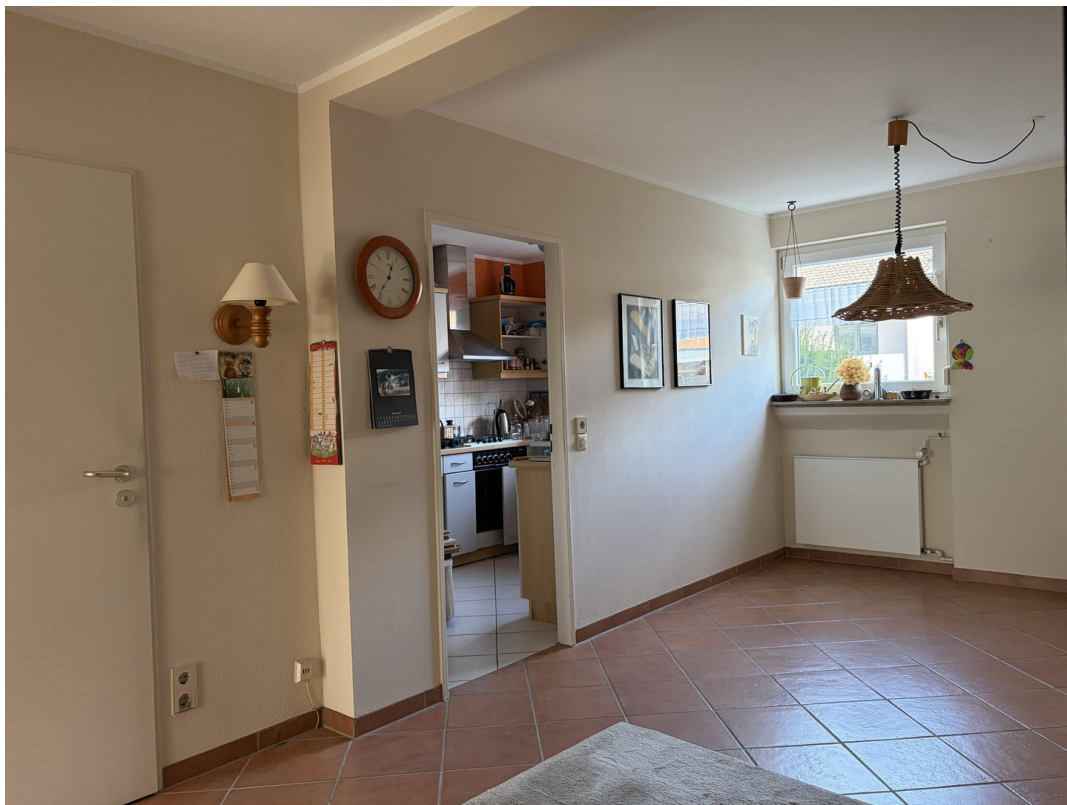
Diele mit Küchentür