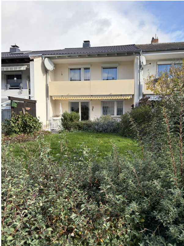
Rückseite mit Garten