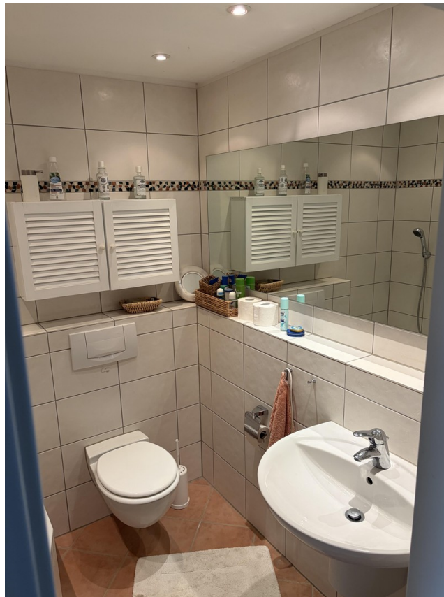
Bad im 1. Stock