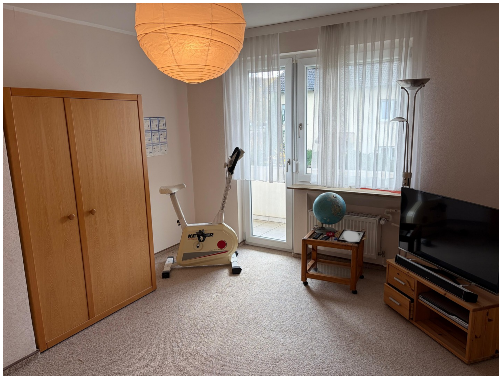
3. Zimmer 1. Stock