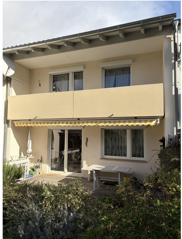
Rückseite-Terrasse und Balkon