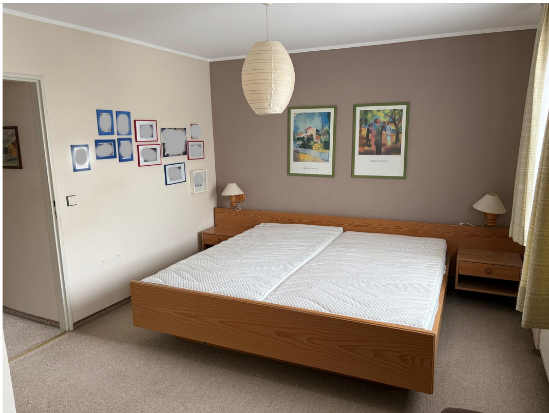
Schlafzimmer 1. Stock