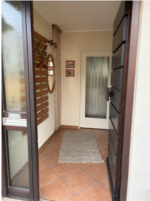
Eingang mit Flur