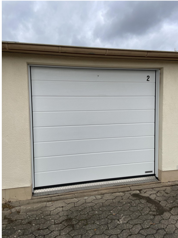
Garage - elektr. Rolltor