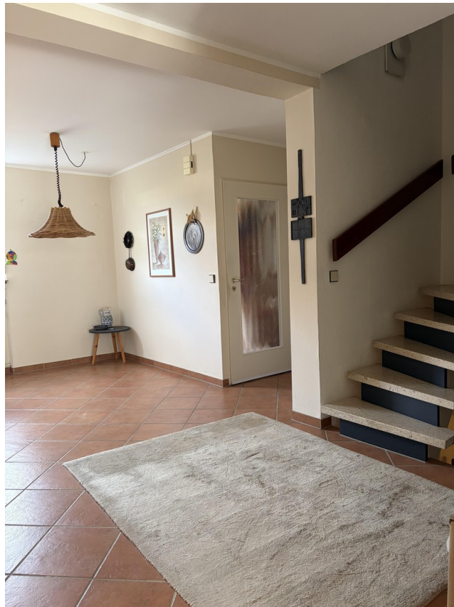
Diele mit Treppe zum 1.Stock