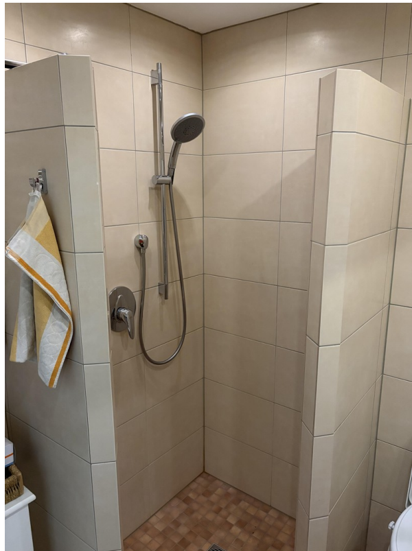
Dusche im Gäste WC