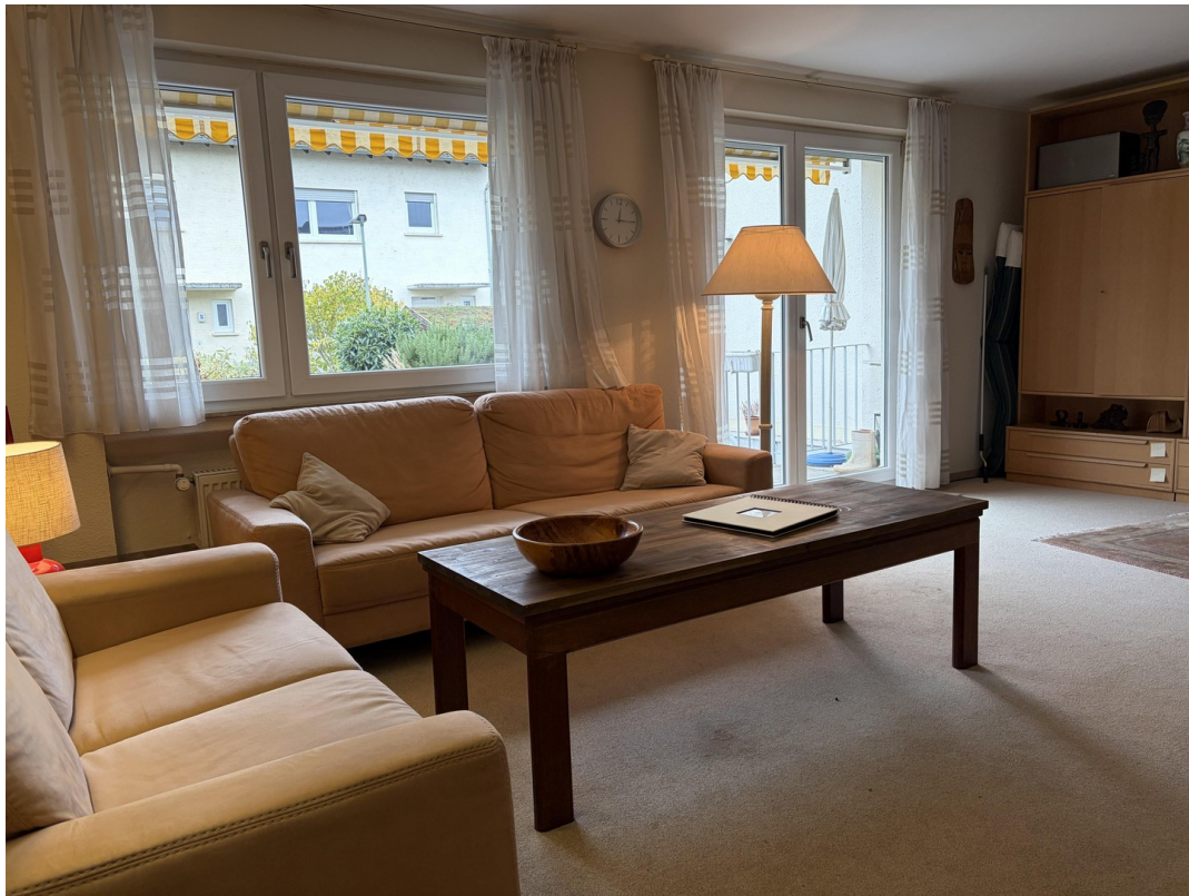
Wohnzimmer mit Terrassenzugang