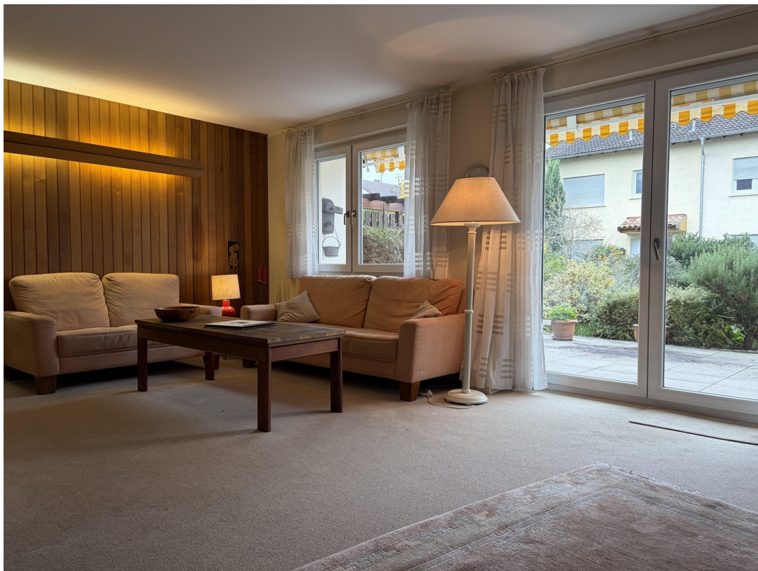
Wohnzimmer mit Terrassenzugang