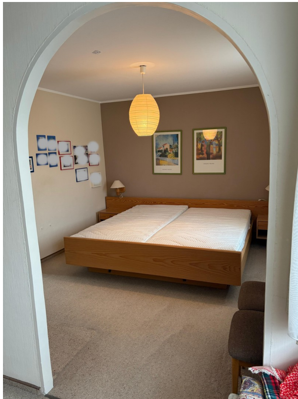
Ankleidezimmer - Schlafzimmer