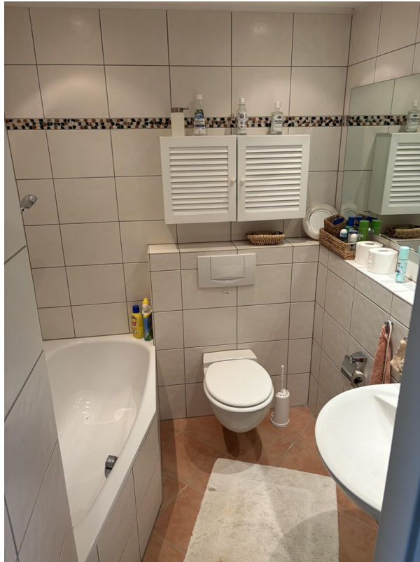
Bad im 1. Stock