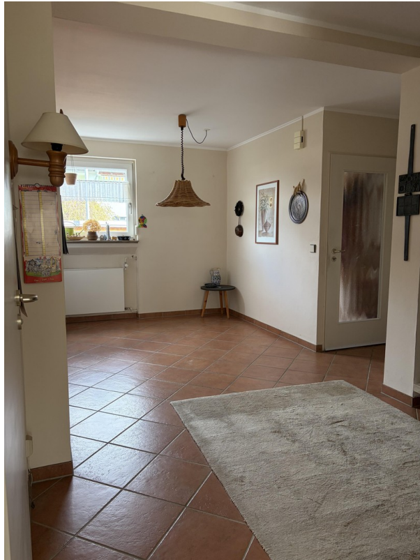
Diele - Essecke