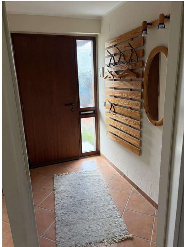
Flur - innen