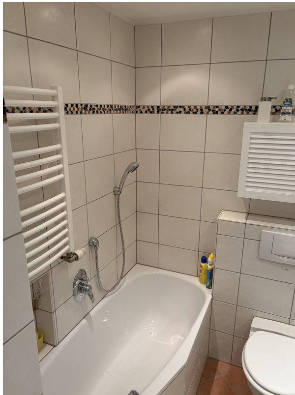
Bad im 1. Stock