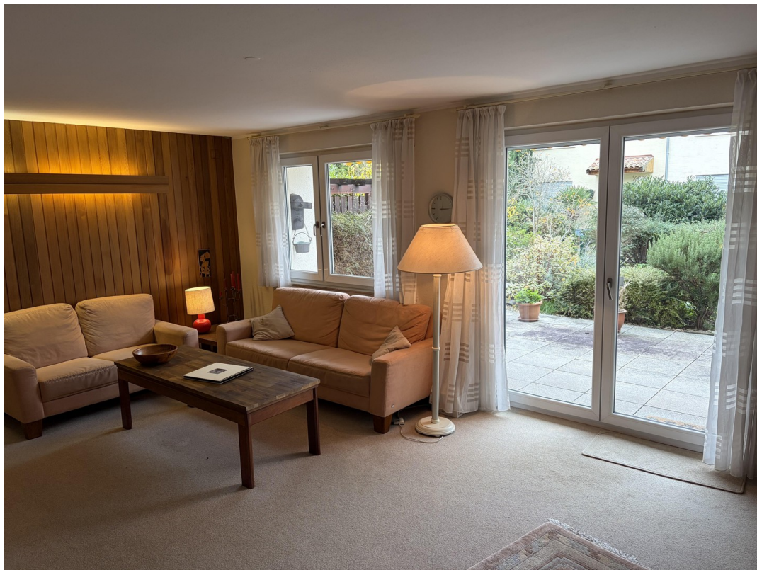
Wohnzimmer mit Terrassenzugang