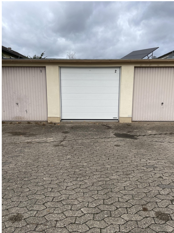
Garage mit Stellplatz