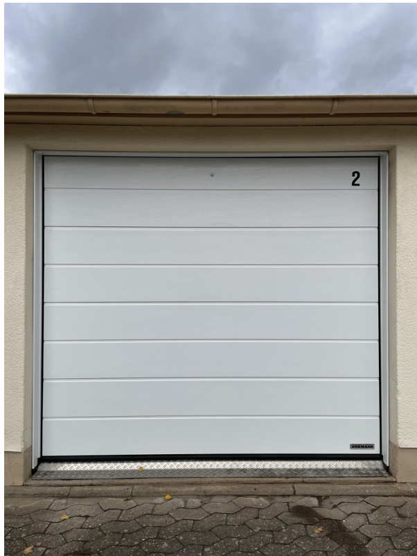
Garage - elektr. Rolltor