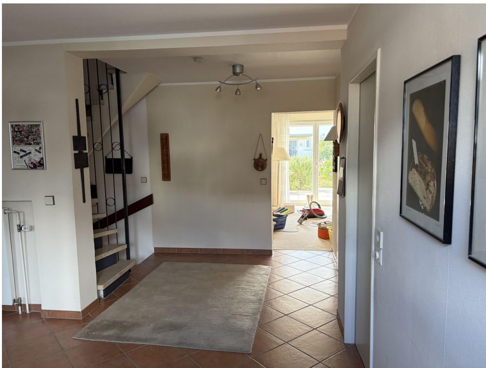
Blick Richtung Wohnzimmer