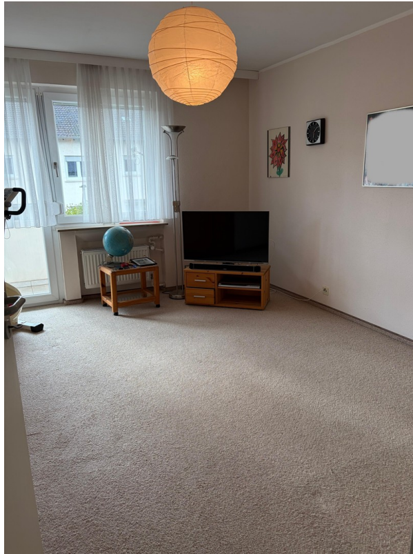
3. Zimmer 1. Stock