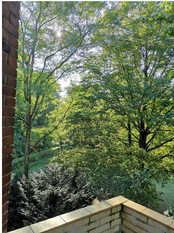
Blick aus dem Balkon