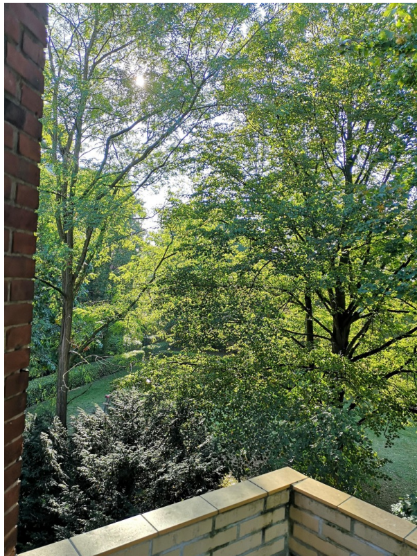
Blick aus dem Balkon