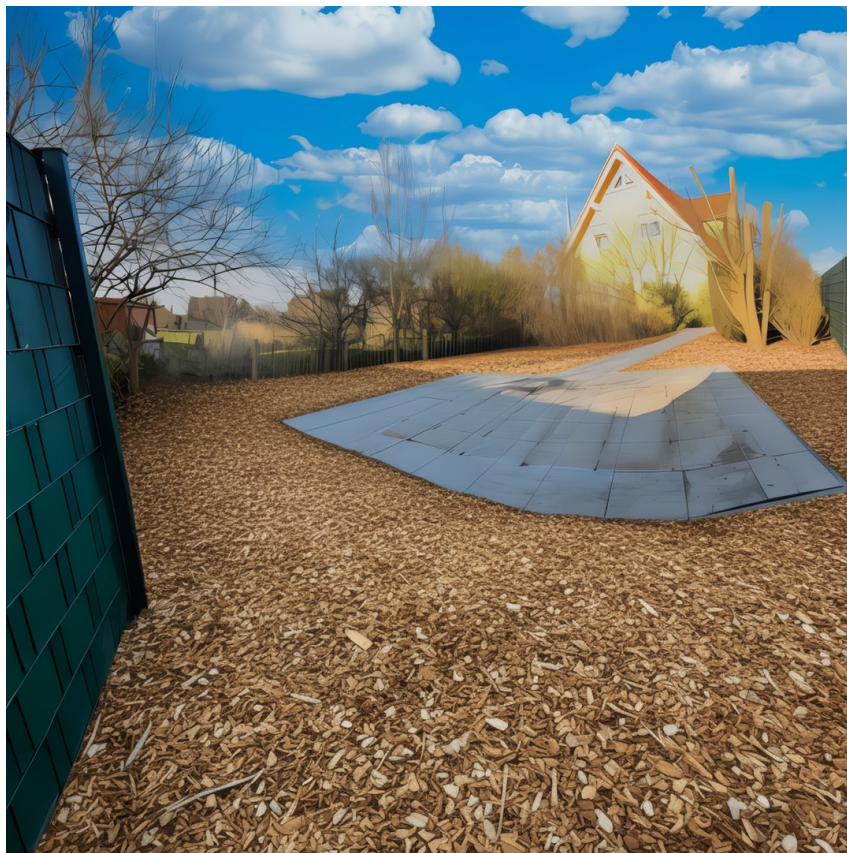
Hier ist alles möglich