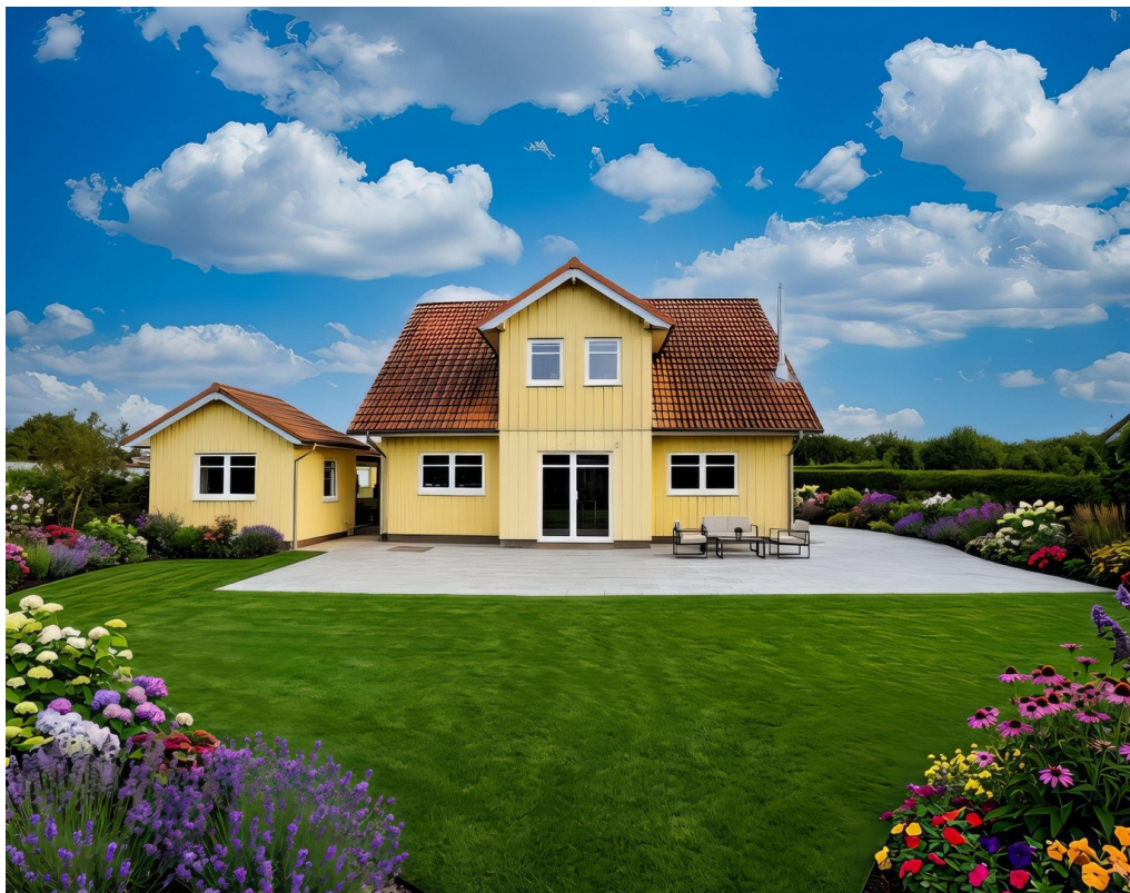
Alternativgestaltung Garten KI