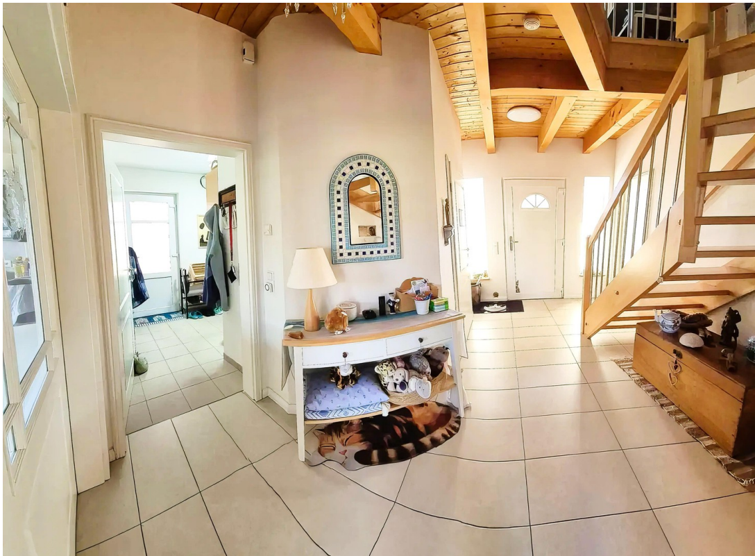
Haupt- und Nebeneingang