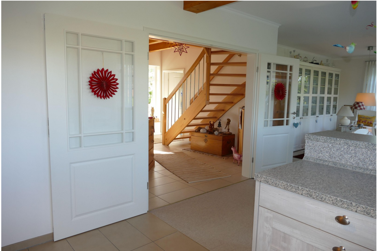
Durchgang zur Wohnküche