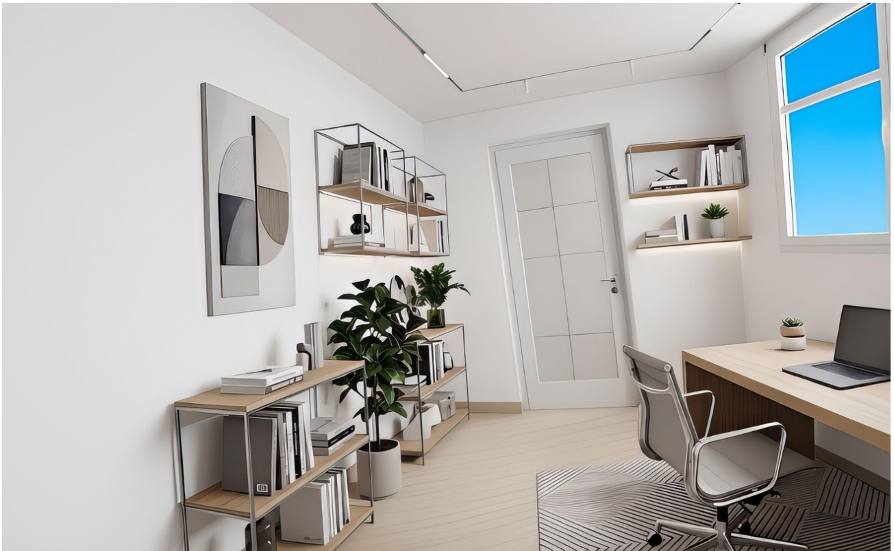
Nutzung als Büro möglich KI