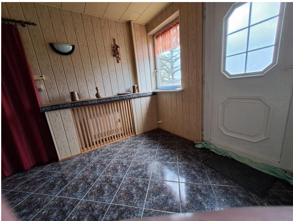
Flur 1 von 2