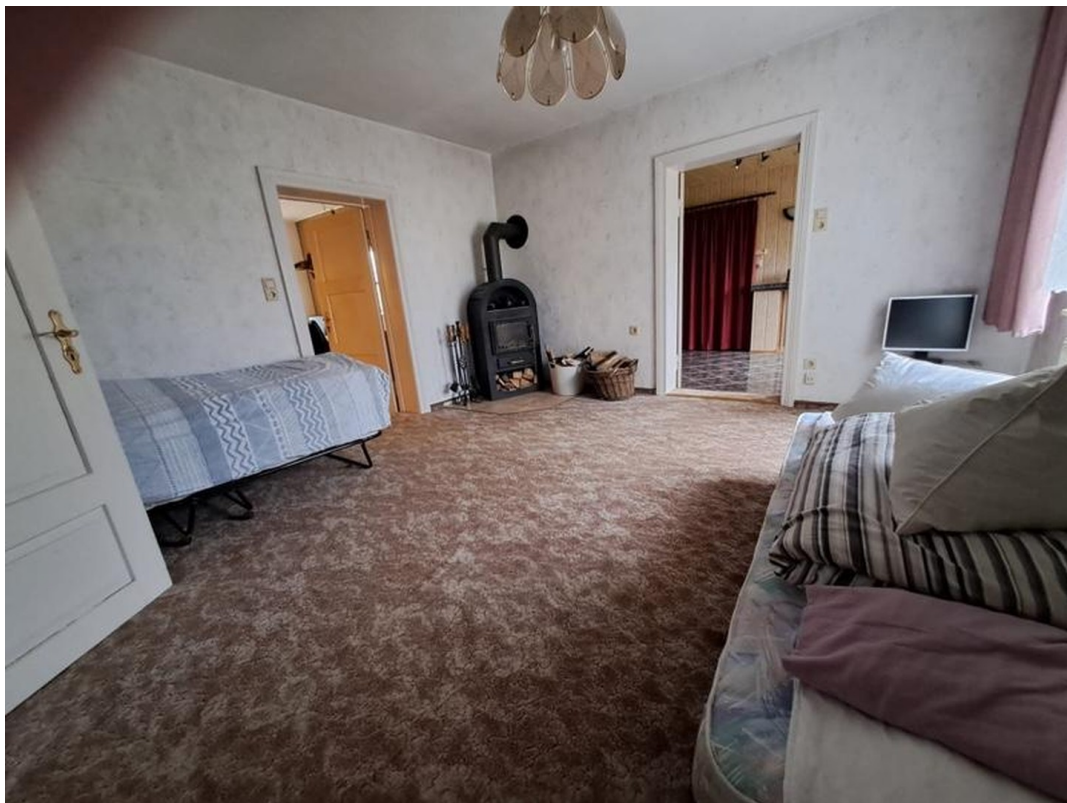
kleines Wohnzimmer mit Kamin