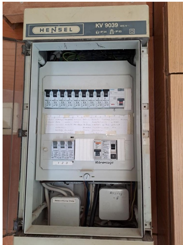
Teileinblick zur Elektrik