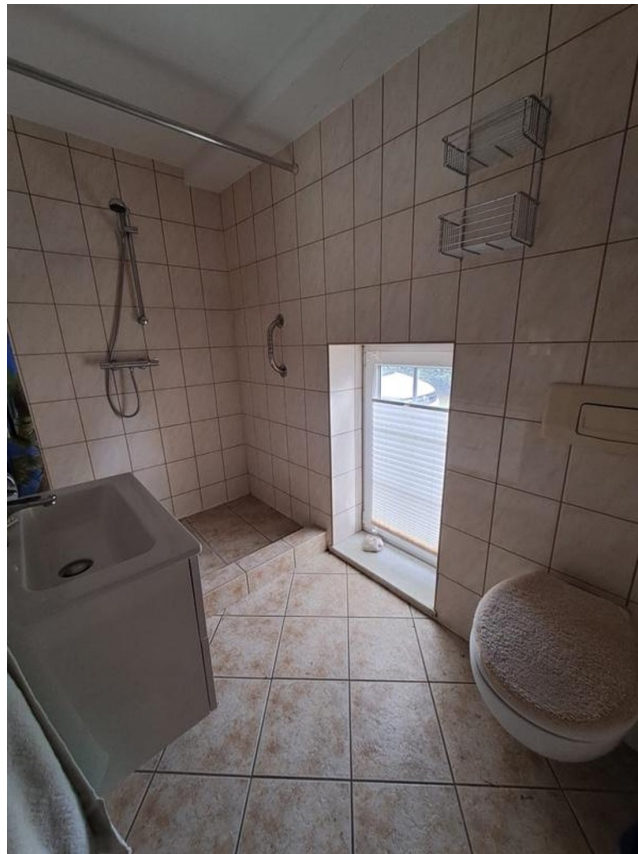
Bad 2 mit Sauna