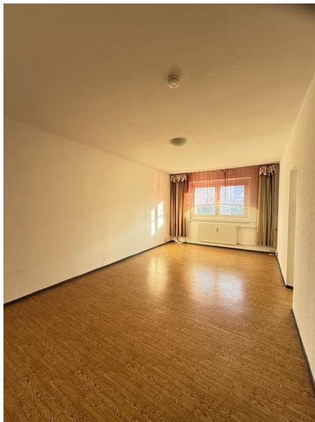
Wohnzimmer ohne Möbel