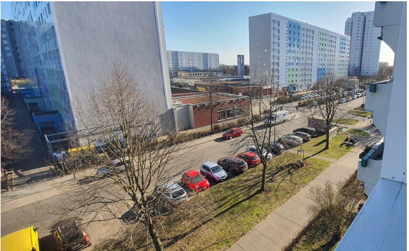
Ausblick zur Strasse