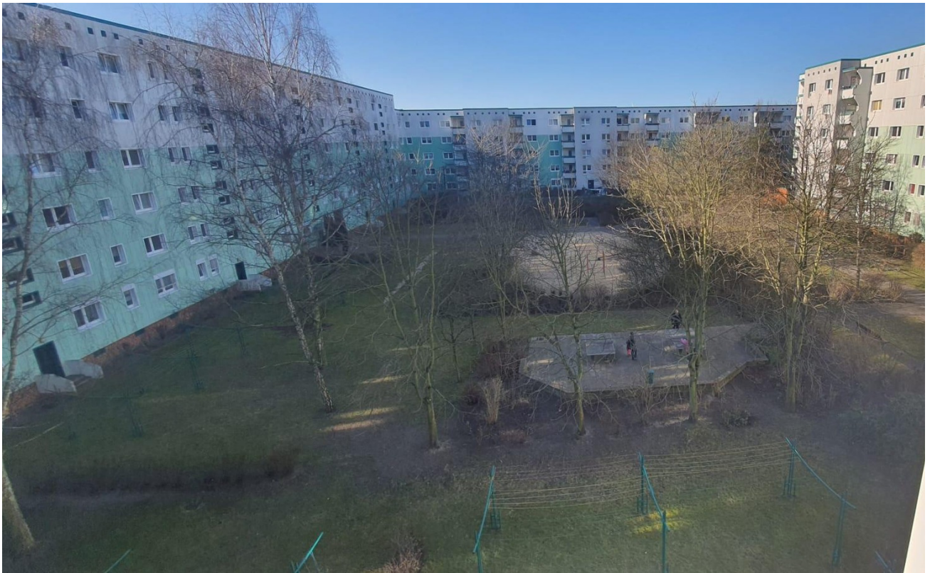
Ausblick zur Hofseite