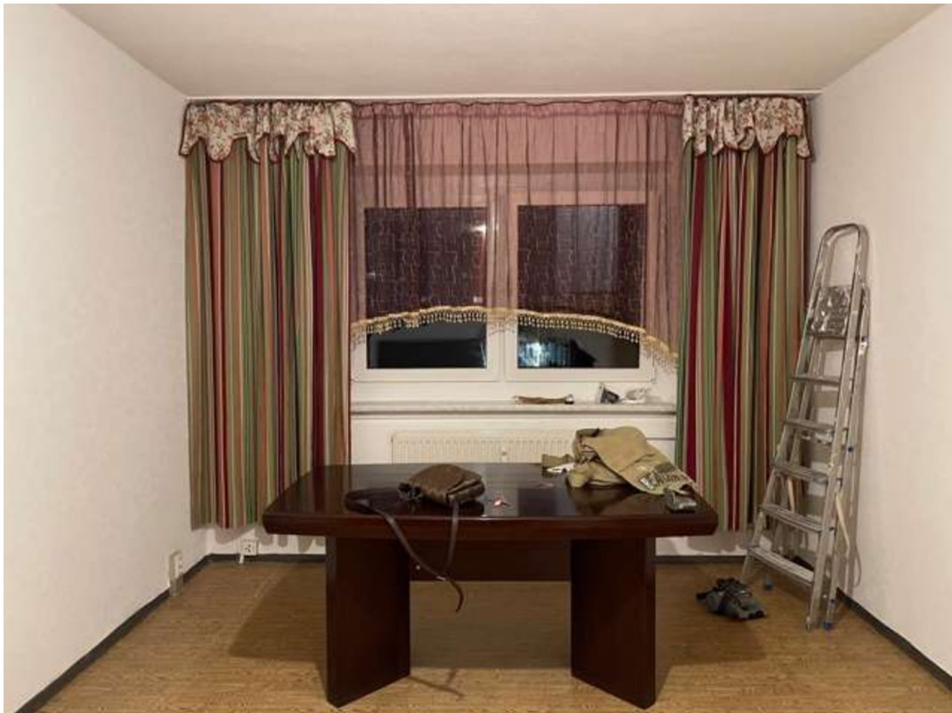
Wohnzimmer, aber ohne Möbel