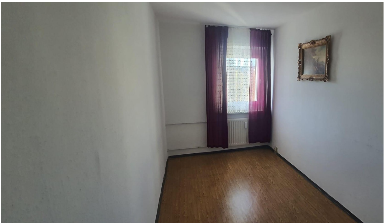
Kinderzimmer ohne Möbel