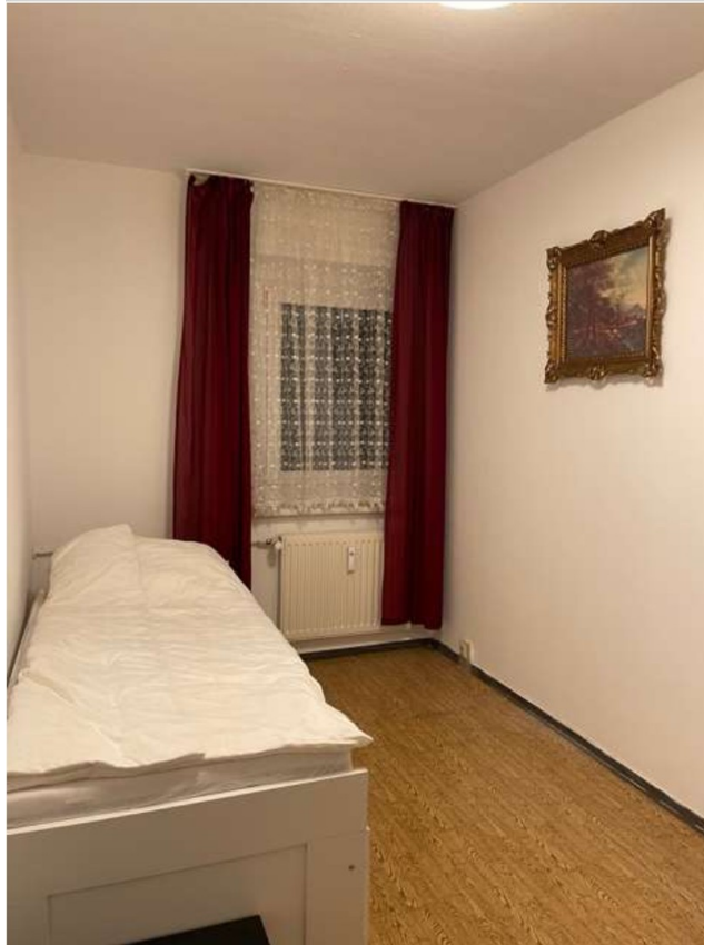
z.B. Kinderzimmer mit Möbel