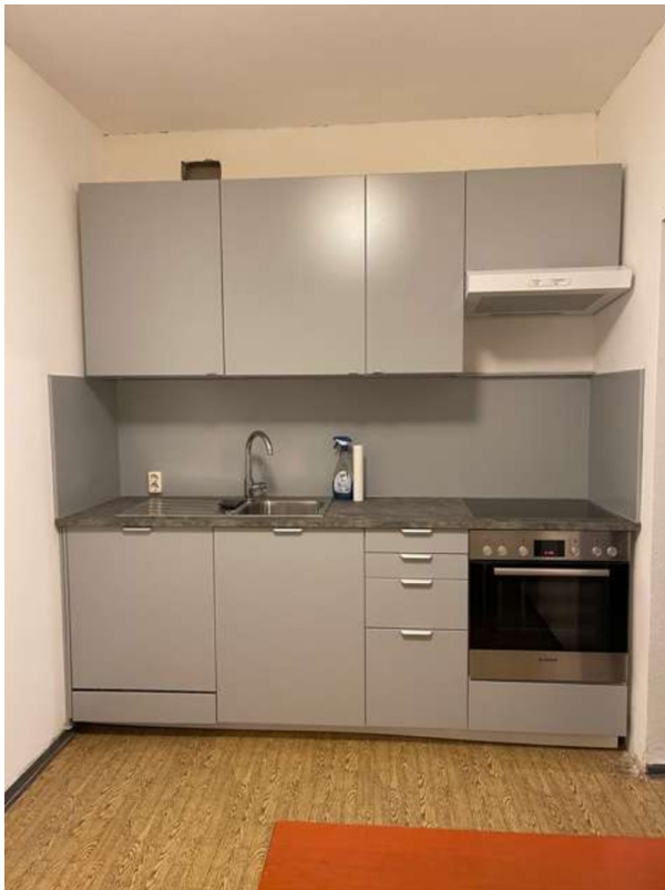
Küche, mit EBK als Beispiel