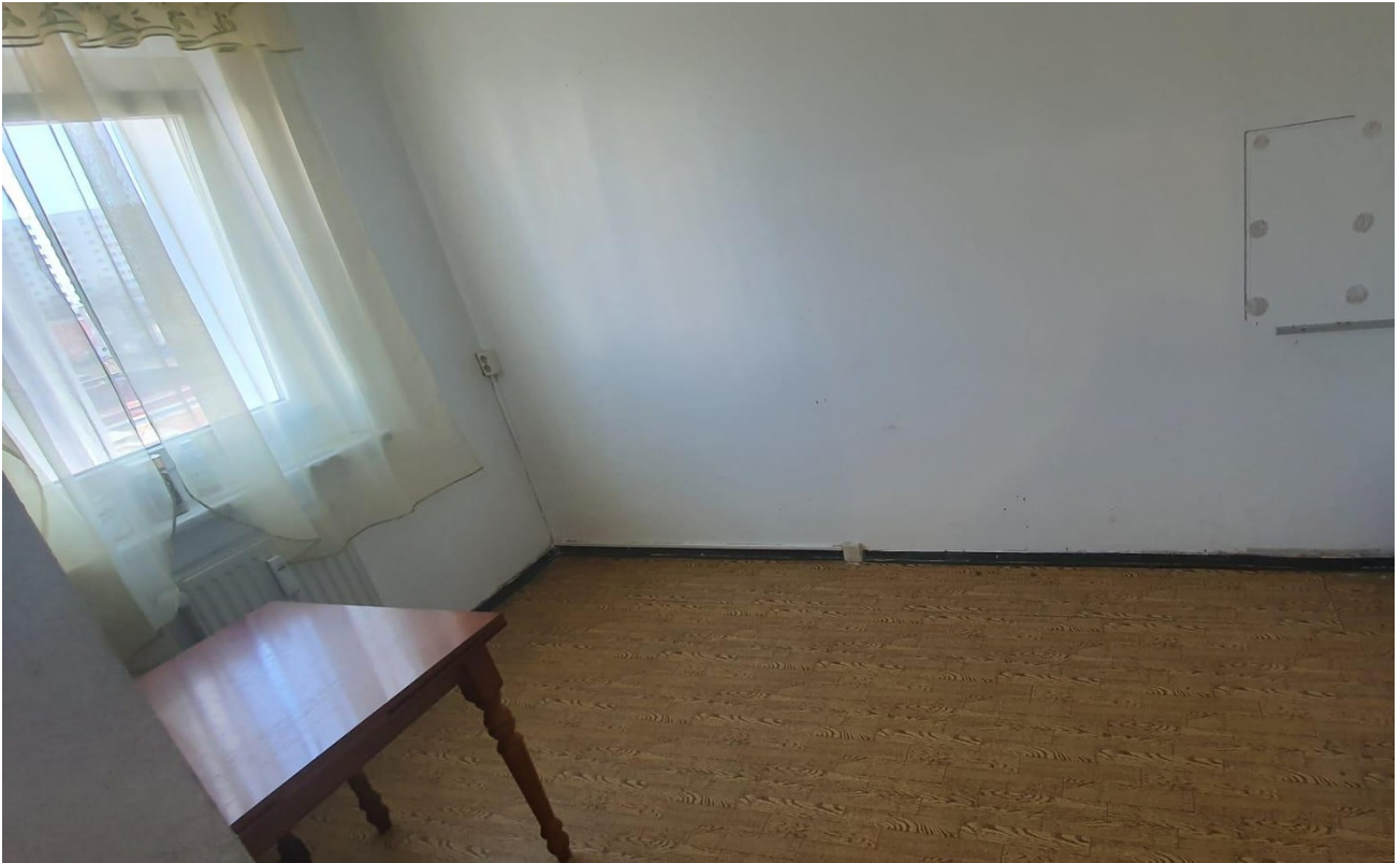
Küche ohne EBK