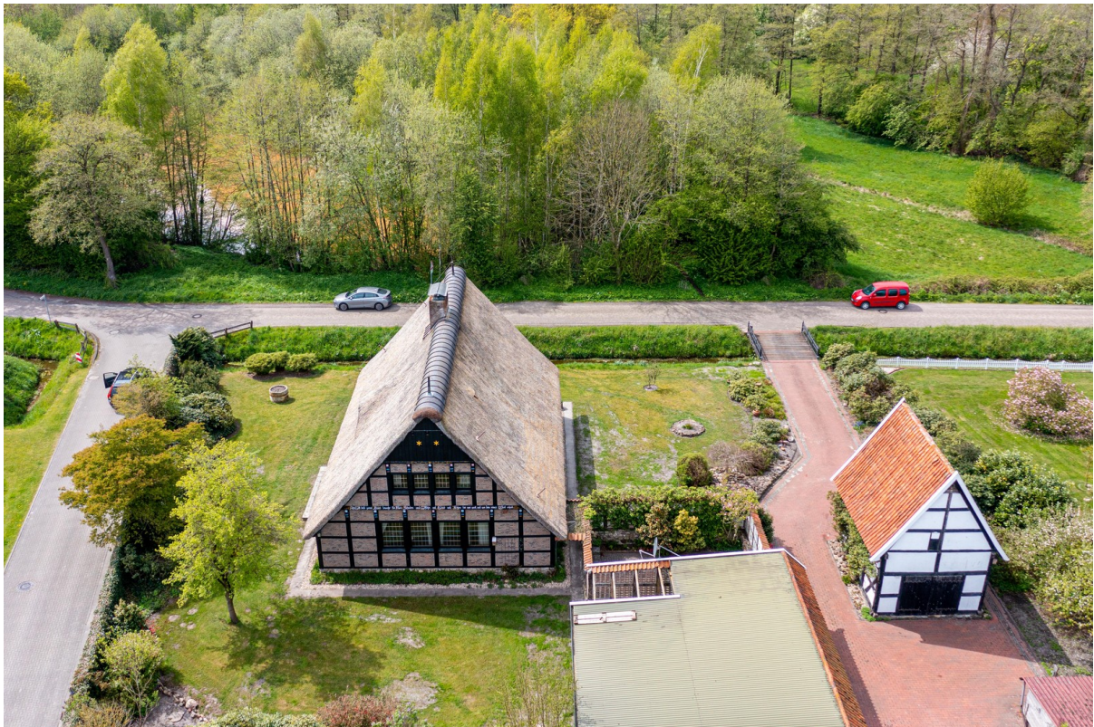
Grundstück am Fischteich