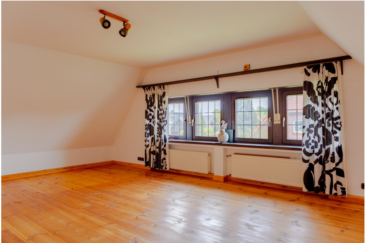
gr. Schlafzimmer Obergeschoss