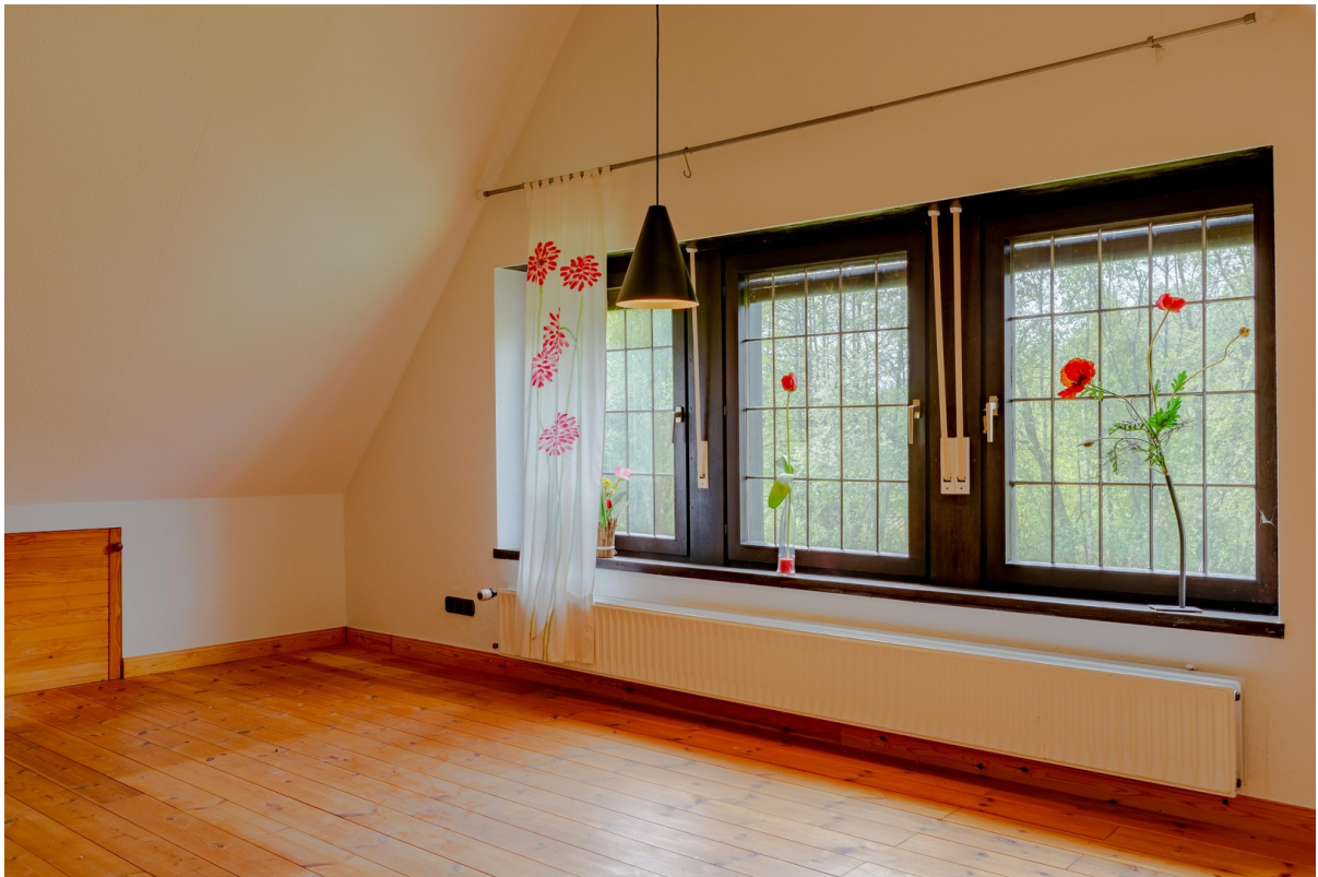
2. Schlafzimmer Obergeschoss