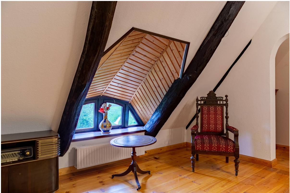
kl. Schlafzimmer Obergeschoss