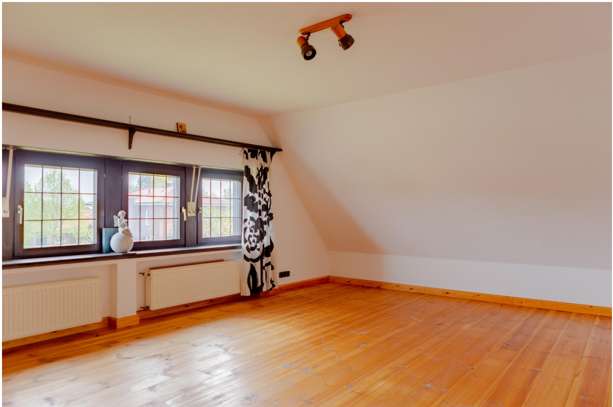
gr. Schlafzimmer Obergeschoss