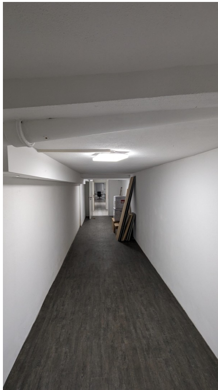
Lagerraum mit eigenem Zugang