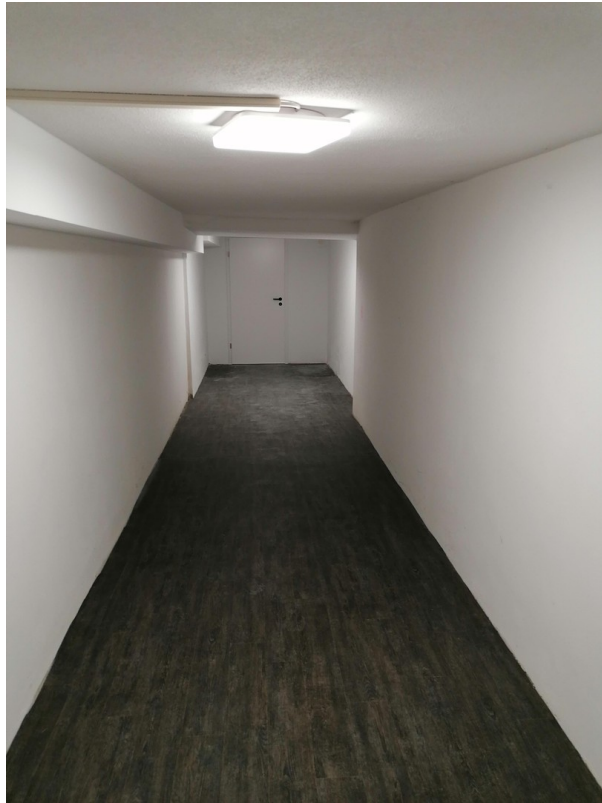
Lagerraum mit eigenem Zugang