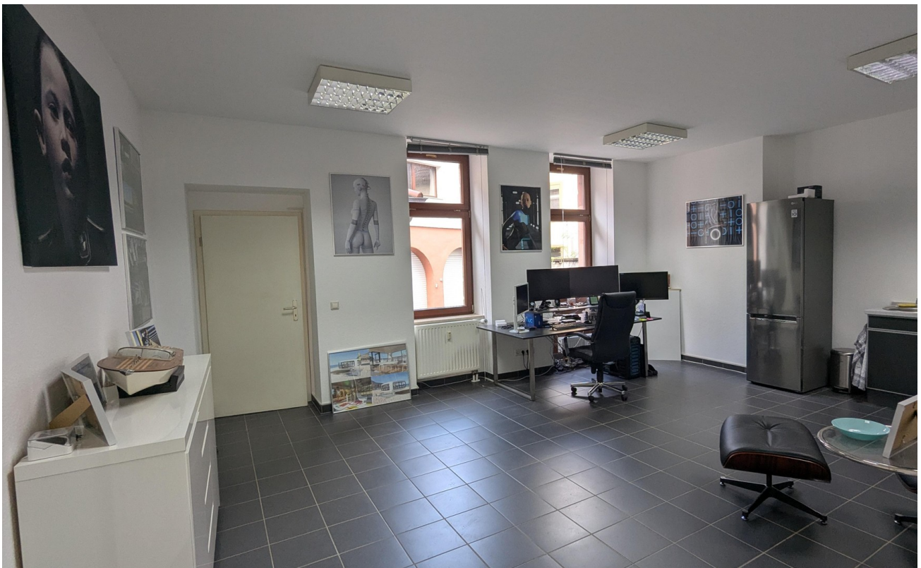
Büro oben/Erweiterung Laden