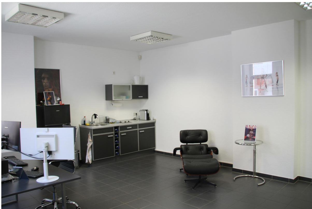
Büro oben/Erweiterung Laden