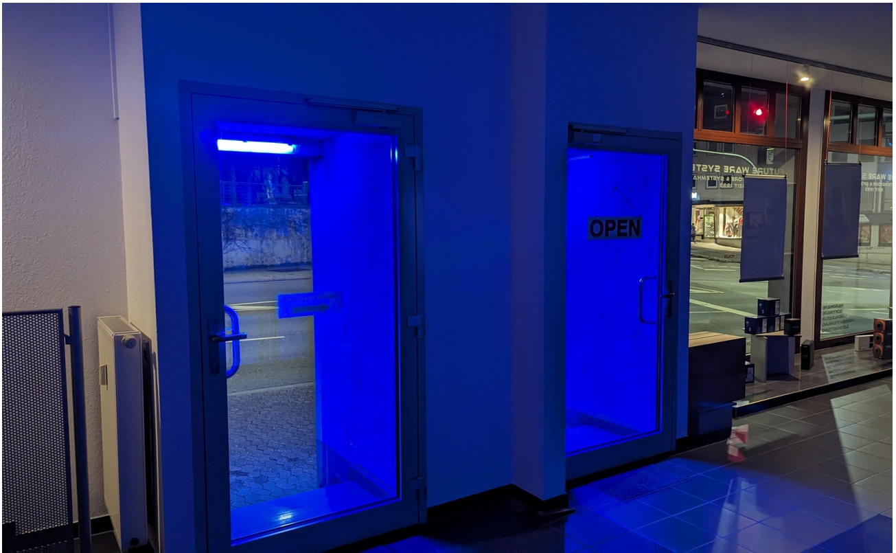
Eingang Vorne bei Nacht