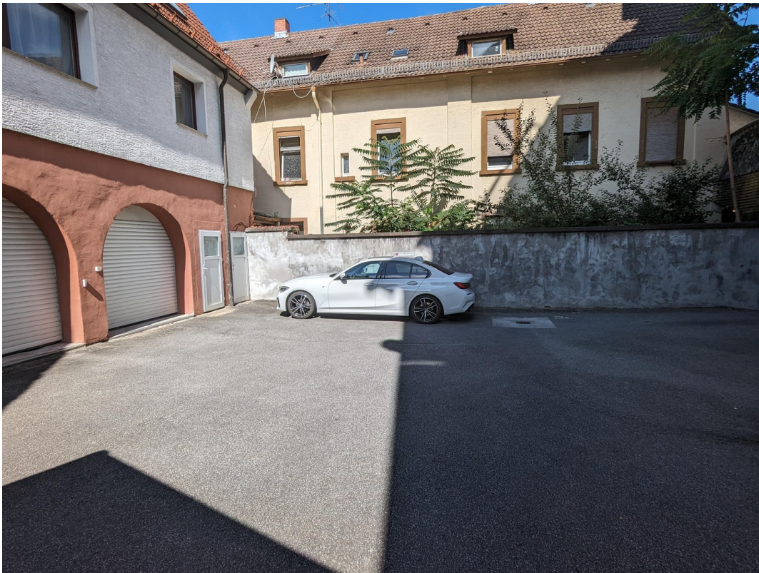
Stellplatz im Hof