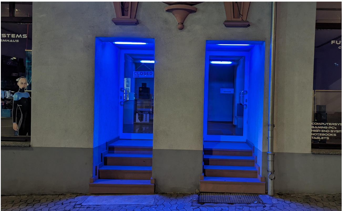
Eingang Vorne bei Nacht