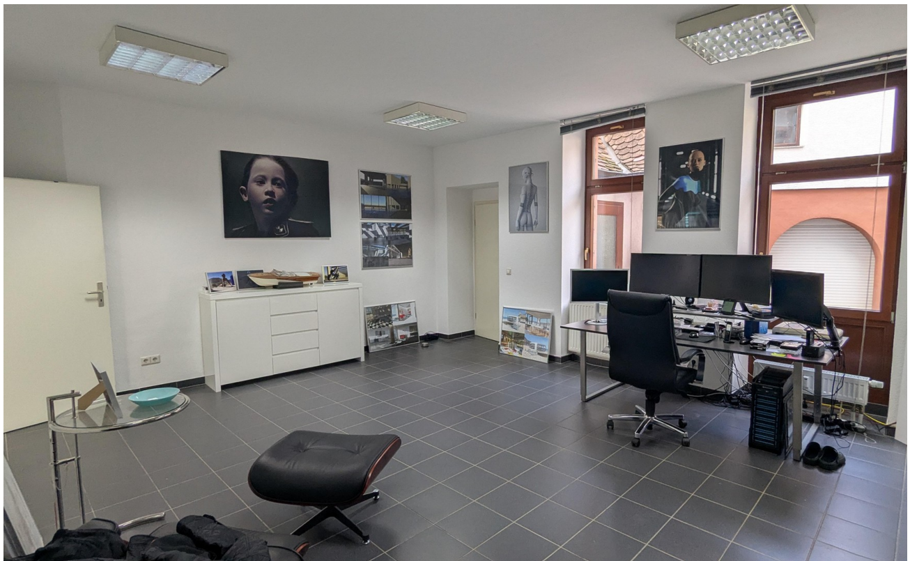
Büro oben/Erweiterung Laden