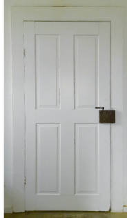
Exemplarfoto Zimmertür | Türgriffgarnitur | Fenstergriffolive