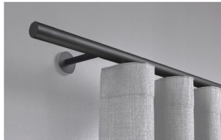
Vorhangstangen | einläufig