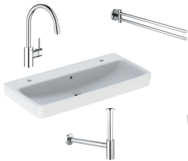
Armaturen und Accessoires | GROHE