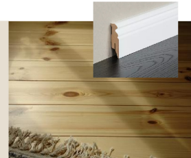
Dielenboden Kiefer | geölt/gewachst | fallende Breiten

Vorbehaltlich Abweichungen durch Planungsänderungen.