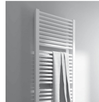
Handtuchheizkörper | Kermi Duett