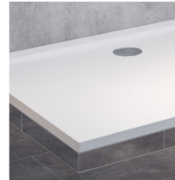
Duschwanne mit erhöhtem Einstieg