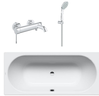
Badewanne | Kaldeweil