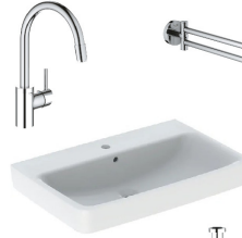
Armaturen und Accessoires | GROHE