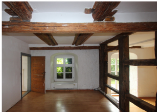
Sichtbares Fachwerk und holzsichtige Deckenbalken