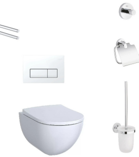
Waschbecken & WC | Geberit