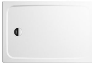
Duschwanne 90x120 | Kaldeweil