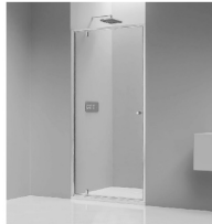
Duschtür mit Rahmen | Chrom