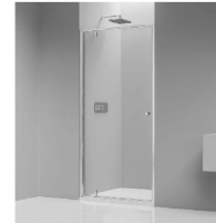
Duschtür mit Rahmen | Chrom