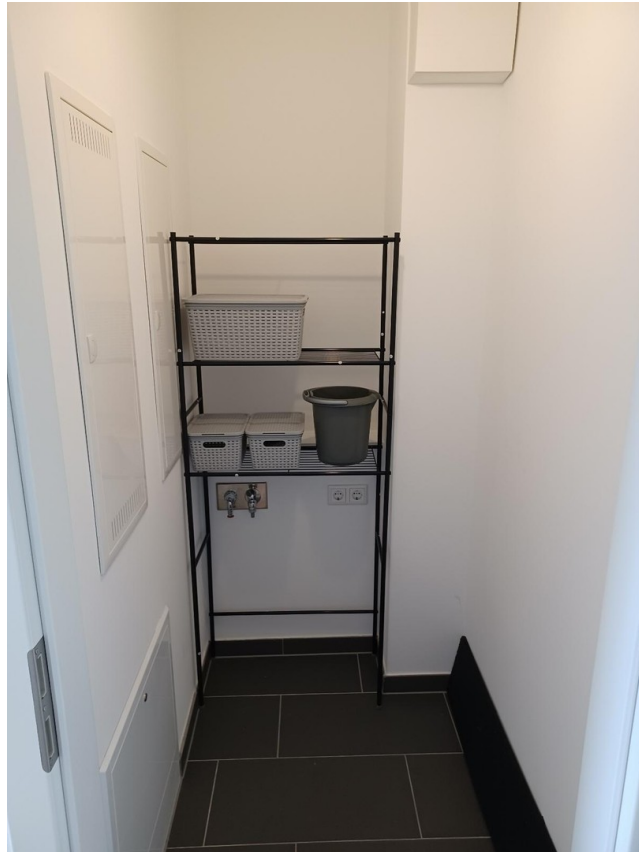
Storage (wash. machine incl.)