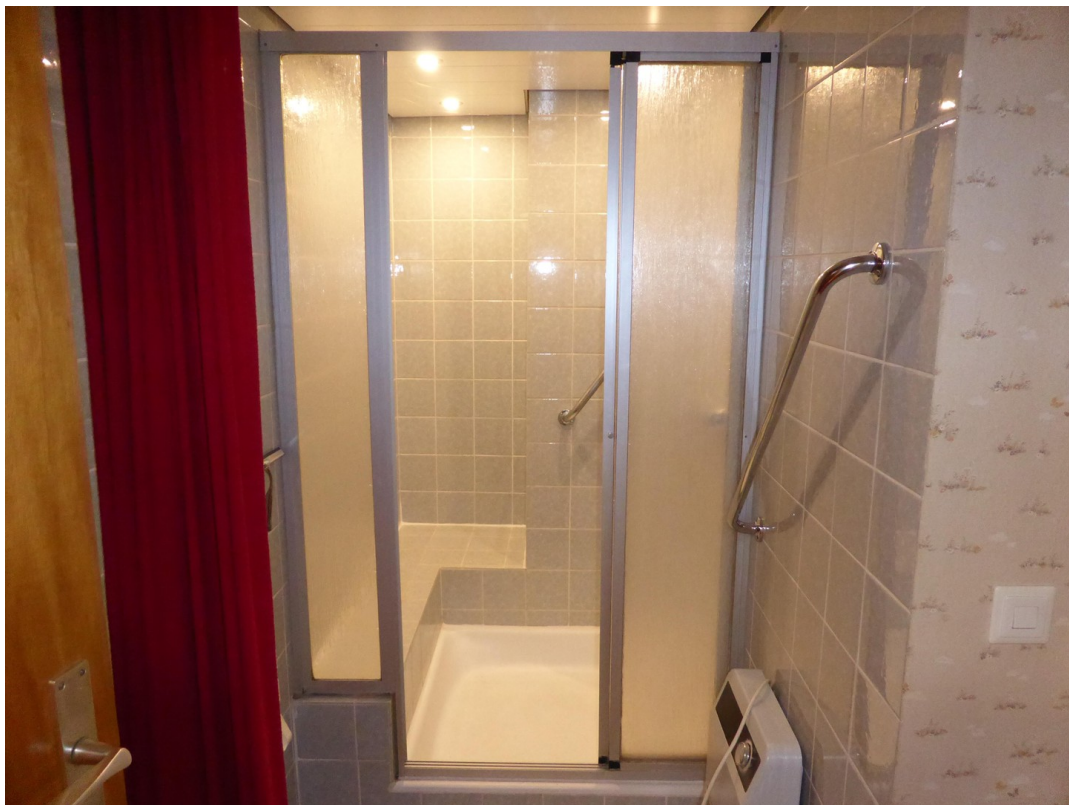
Dusche in der Waschküche