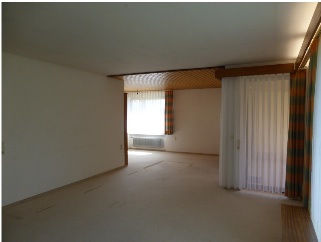
Wohn und Esszimmer