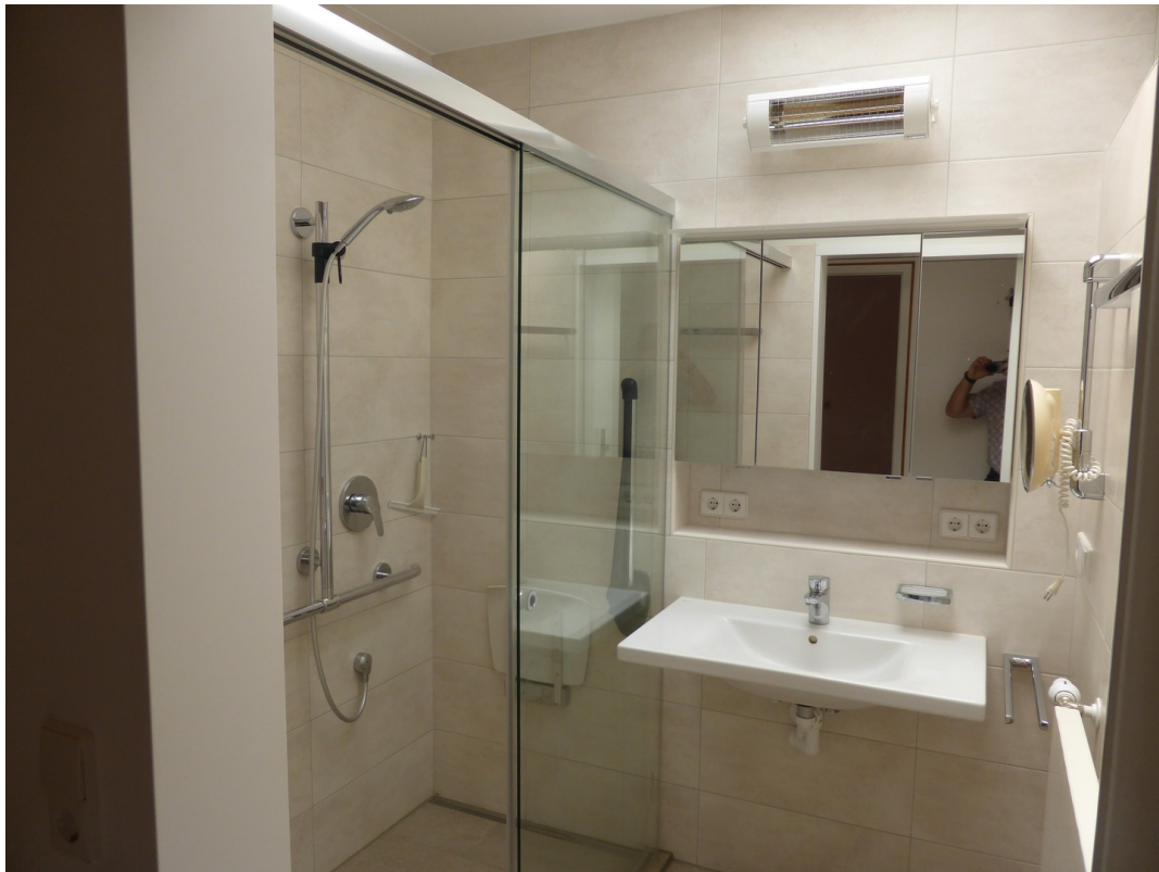
Bad mit Schiebetür