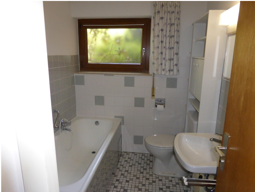
Bad u.Toilette Einliegerwohn.