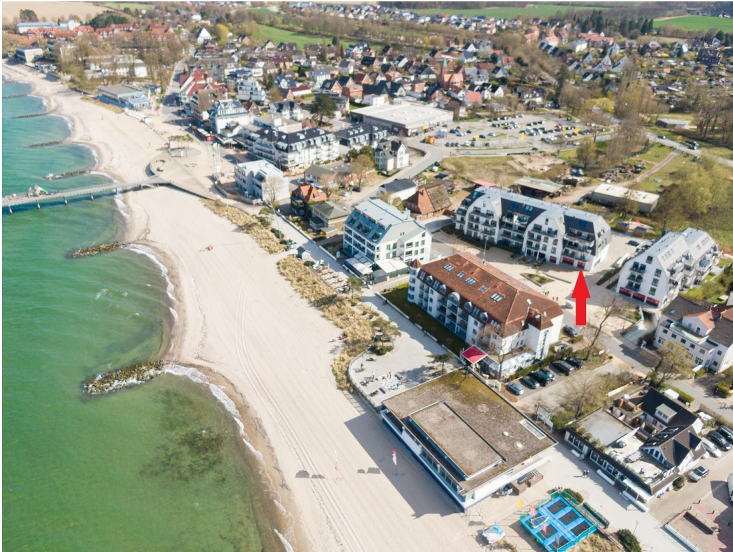
Luftbild mit Markierung