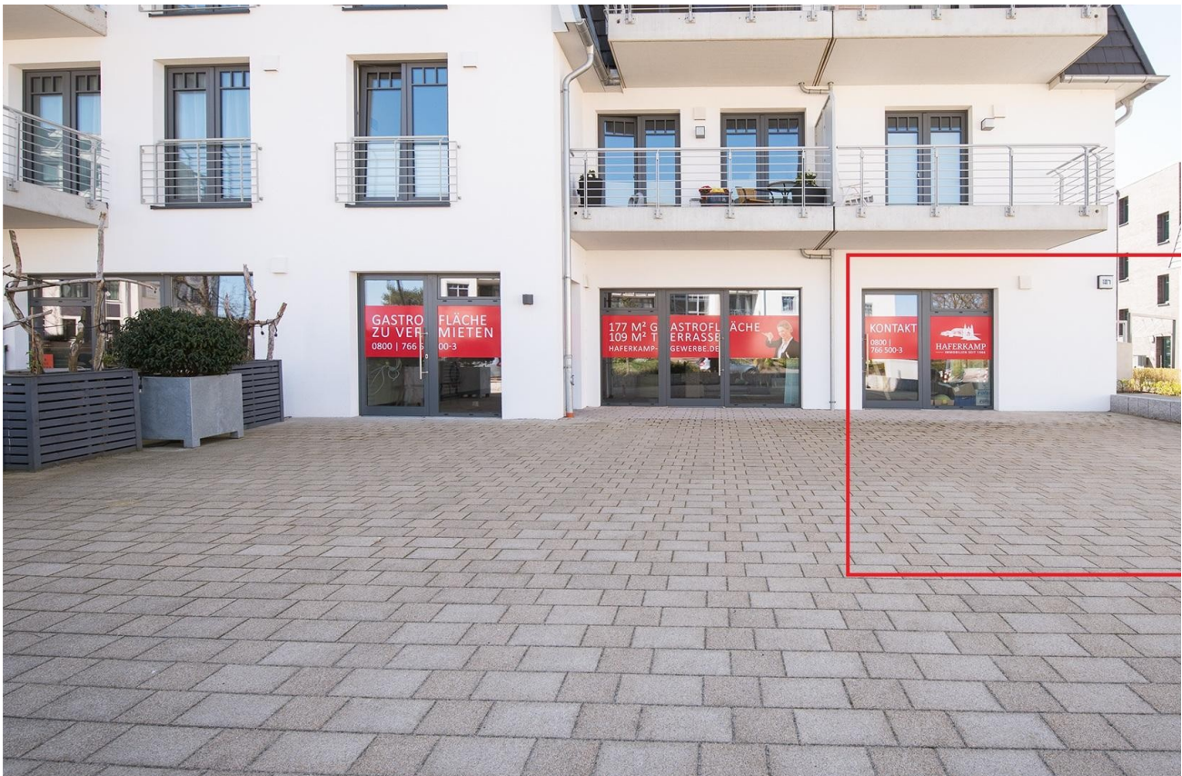
Schaufensterfront - Markierung