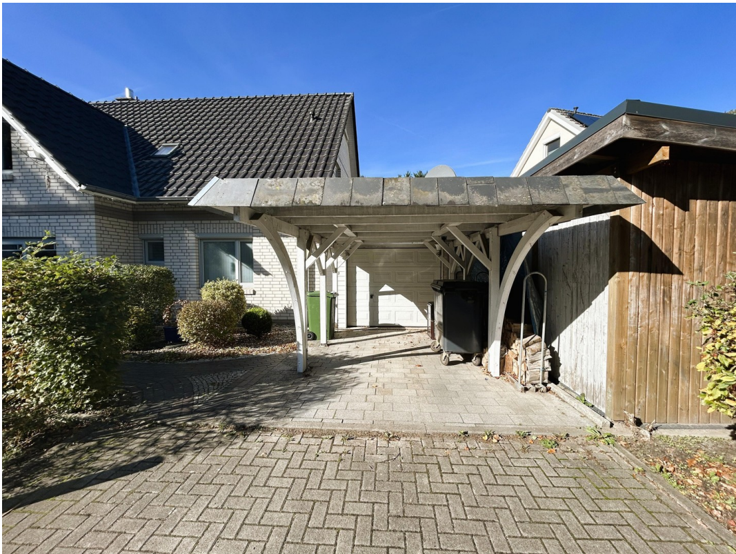
Carport + Garage