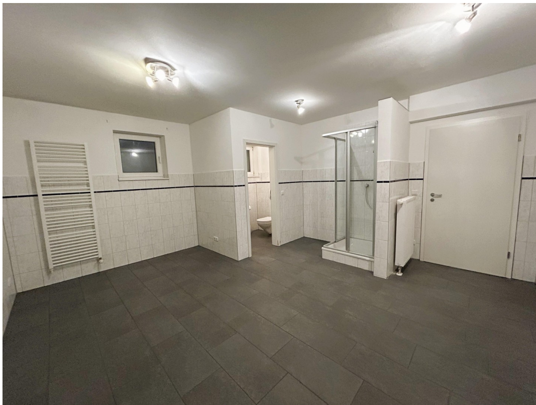
Zurückgebaute Sauna KG