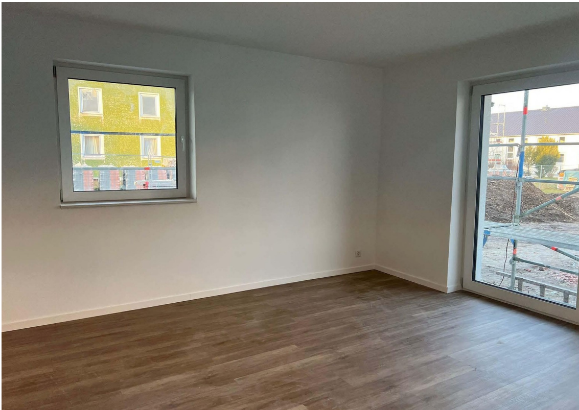
Beispielfoto - Wohnraum