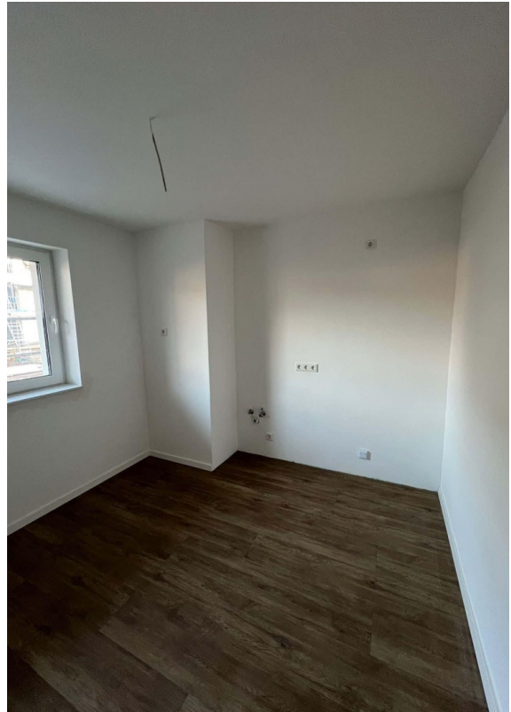
Beispielfoto - Wohnraum/Küche