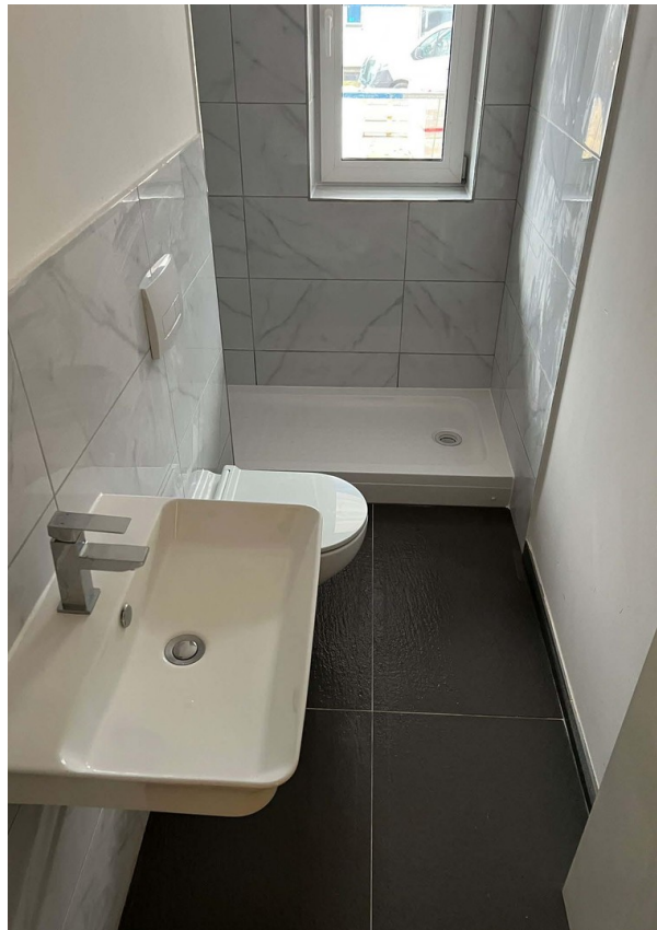
Beispielfoto - Bad mit Dusche