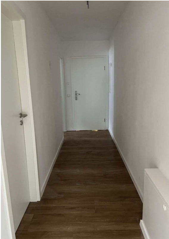
Beispielfoto - Flur