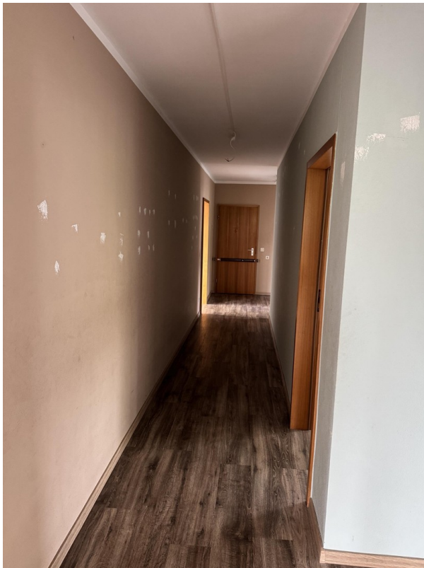
Flur Richtung Eingang