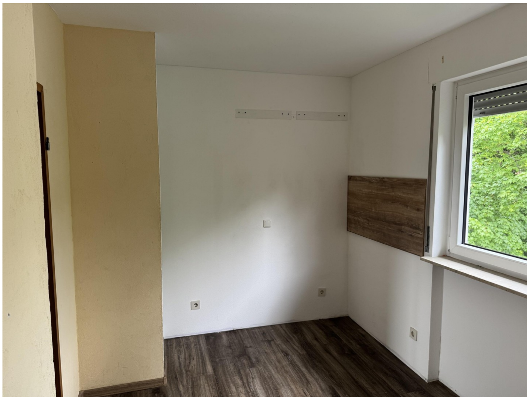
Küche linke Seite