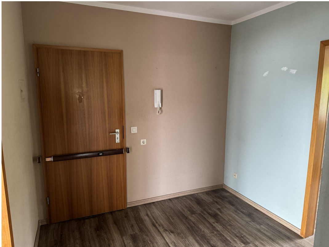
Eingangsbereich mit Diele