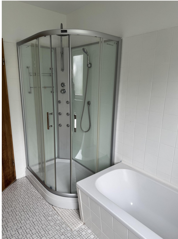
Badezimmer linke Seite