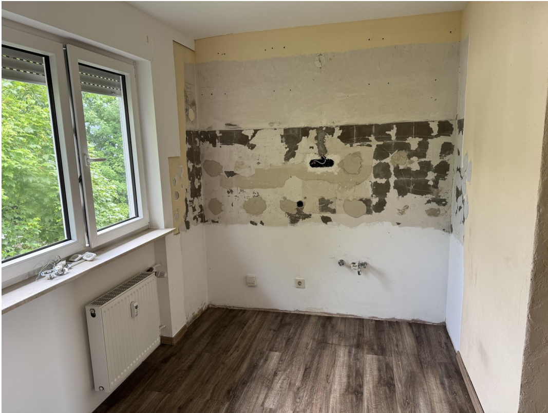
Küche rechte Seite