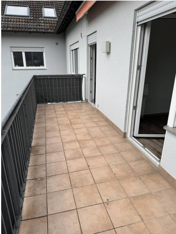
Balkon vom Schlafzimmer aus