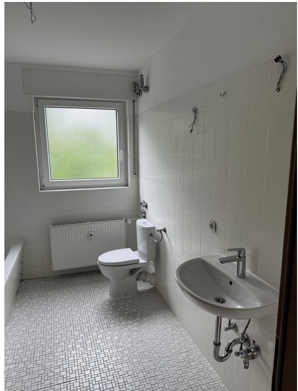
Badezimmer rechte Seite