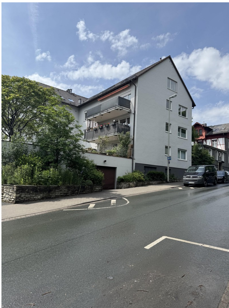
Ansicht von der Strassenseite