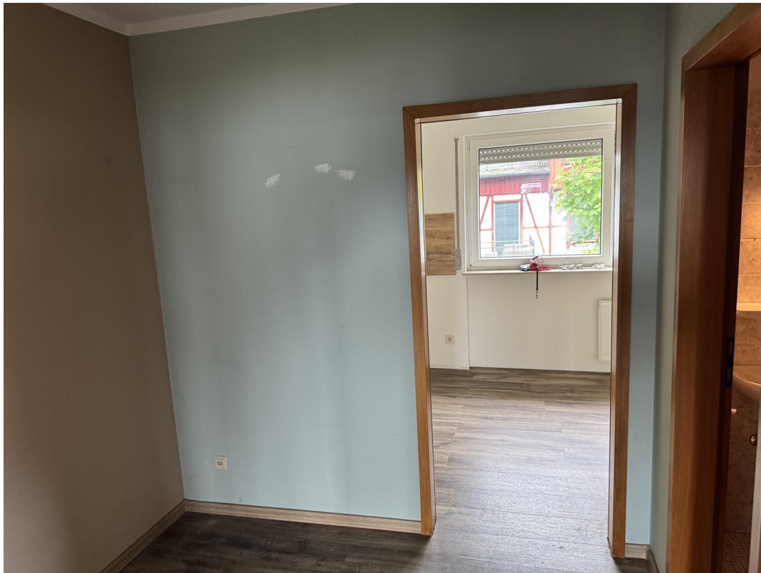
Blick von der Diele in Küche