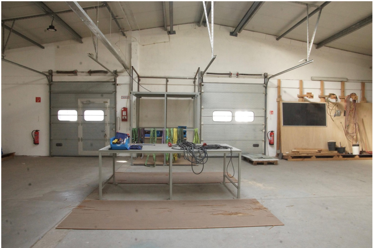
Tore zur Ennsstraße