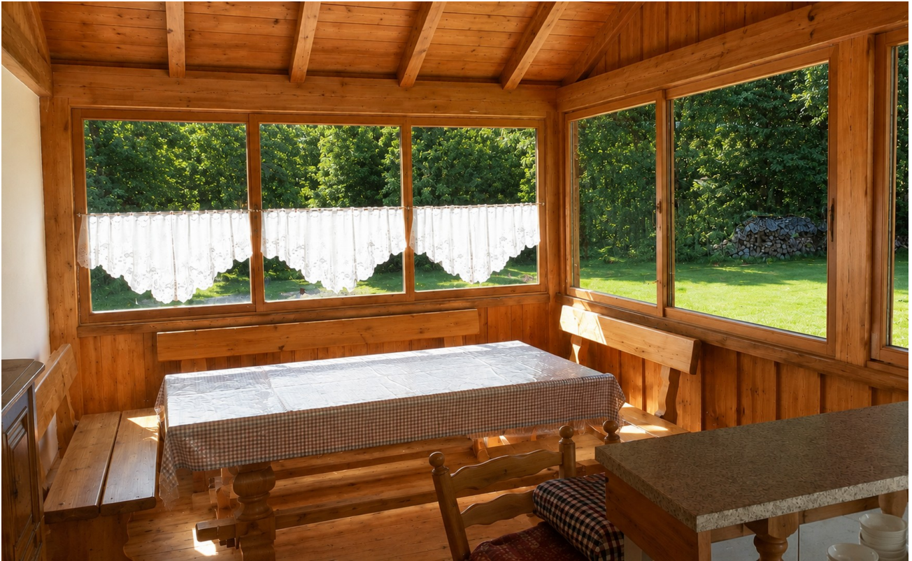
Freisitz - absolute Ruhe...