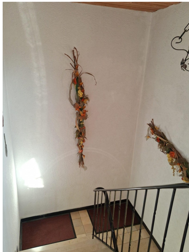
Hausgang zum OG