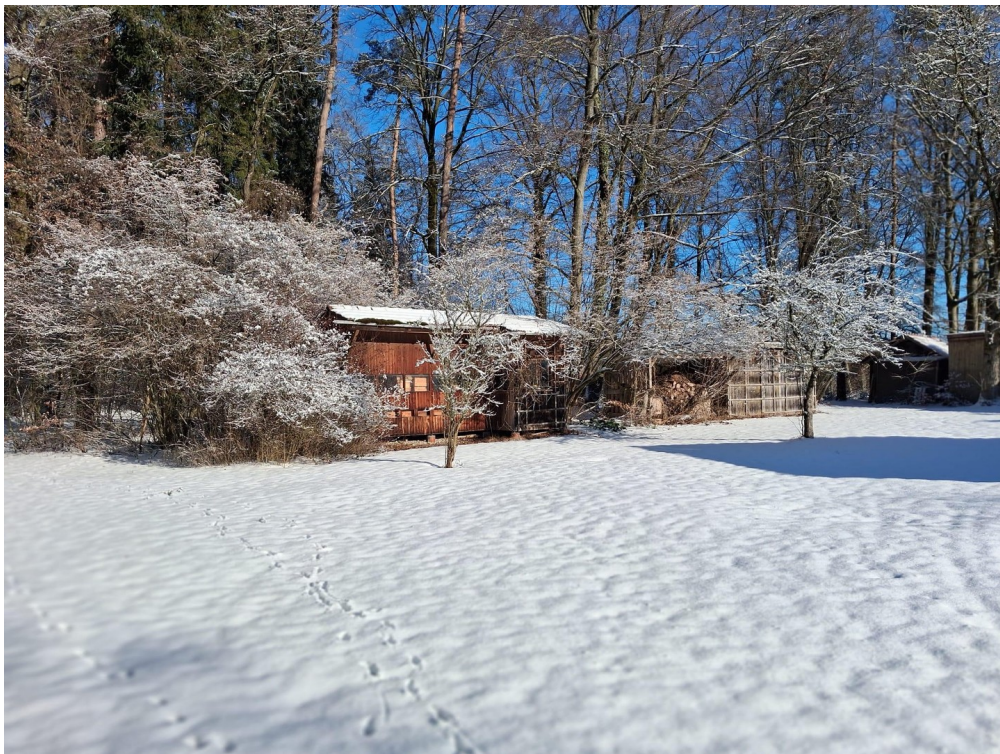
Auch im Winter ein Traum...