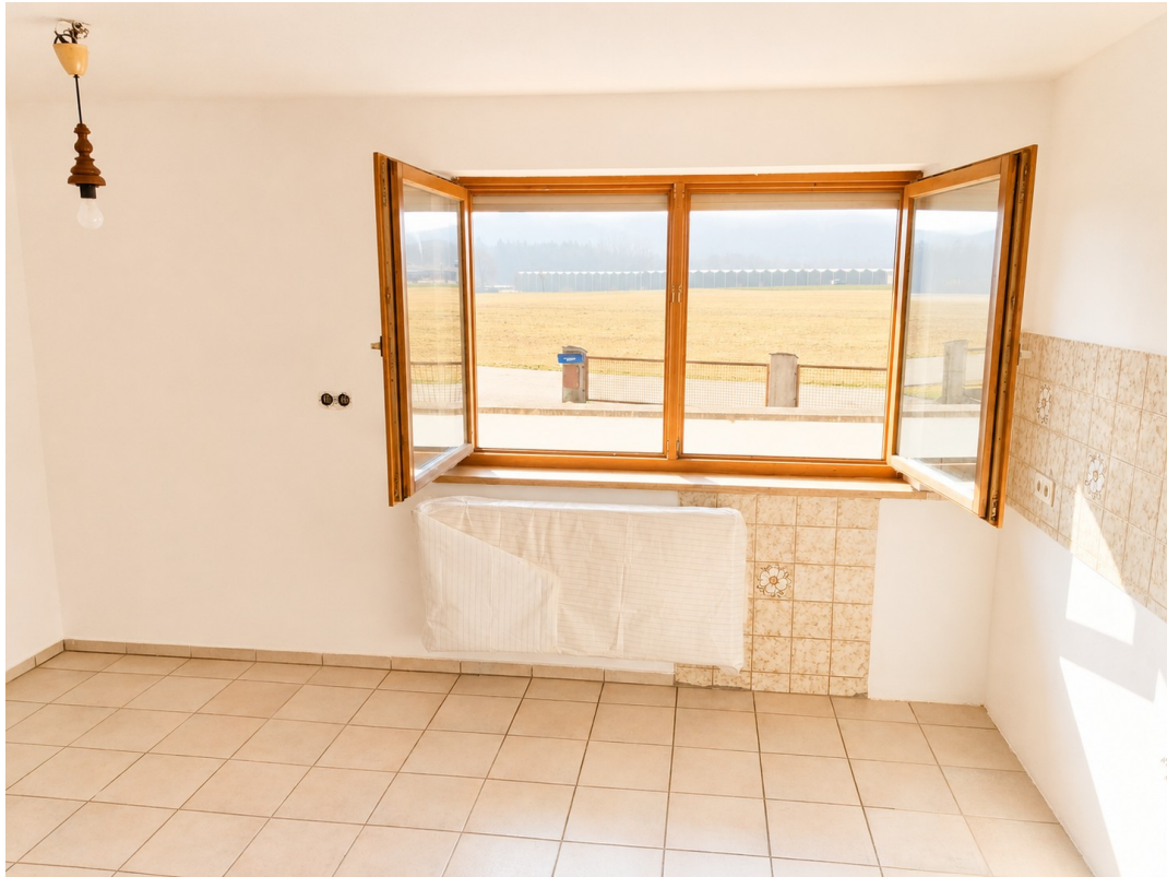
Küche EG - frisch gestrichen