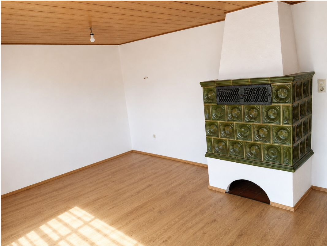
Wohn- oder Esszimmer EG