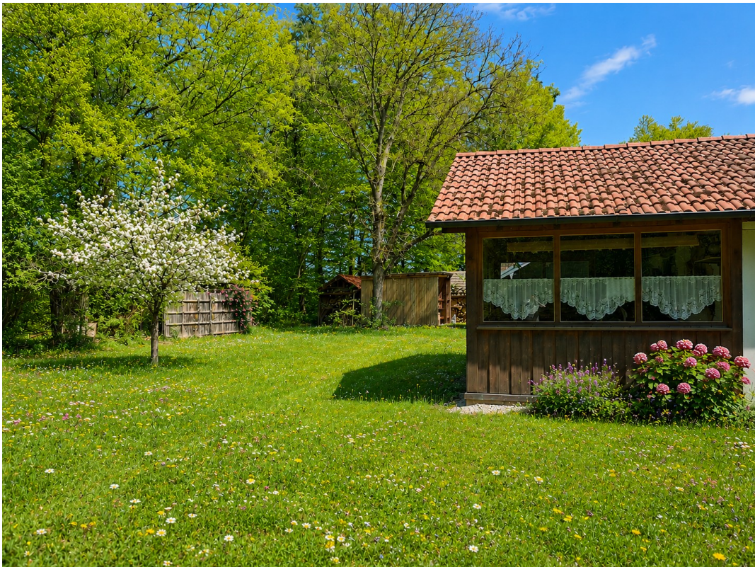
Blick R. Freisitz/Carport