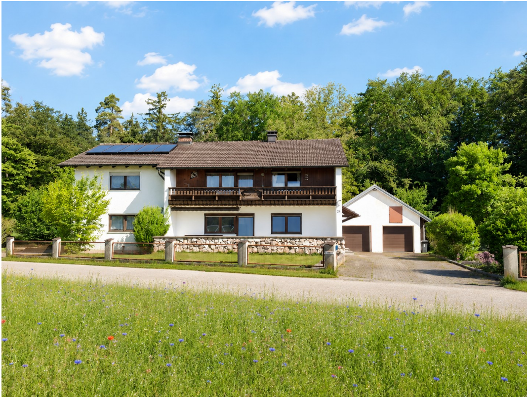
Doppelgarage links und rechts