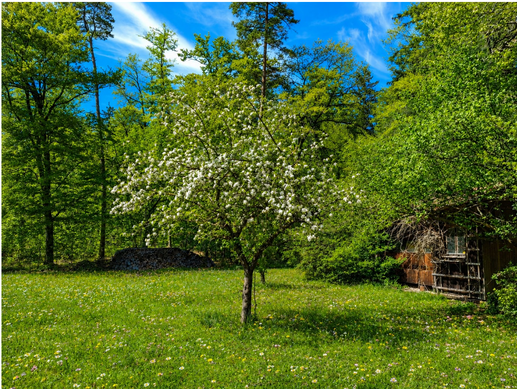
Blick Richtung Wald/Bienenhaus