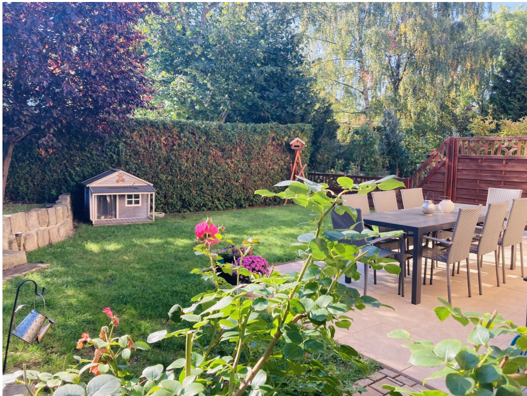
Garten mit Terrasse