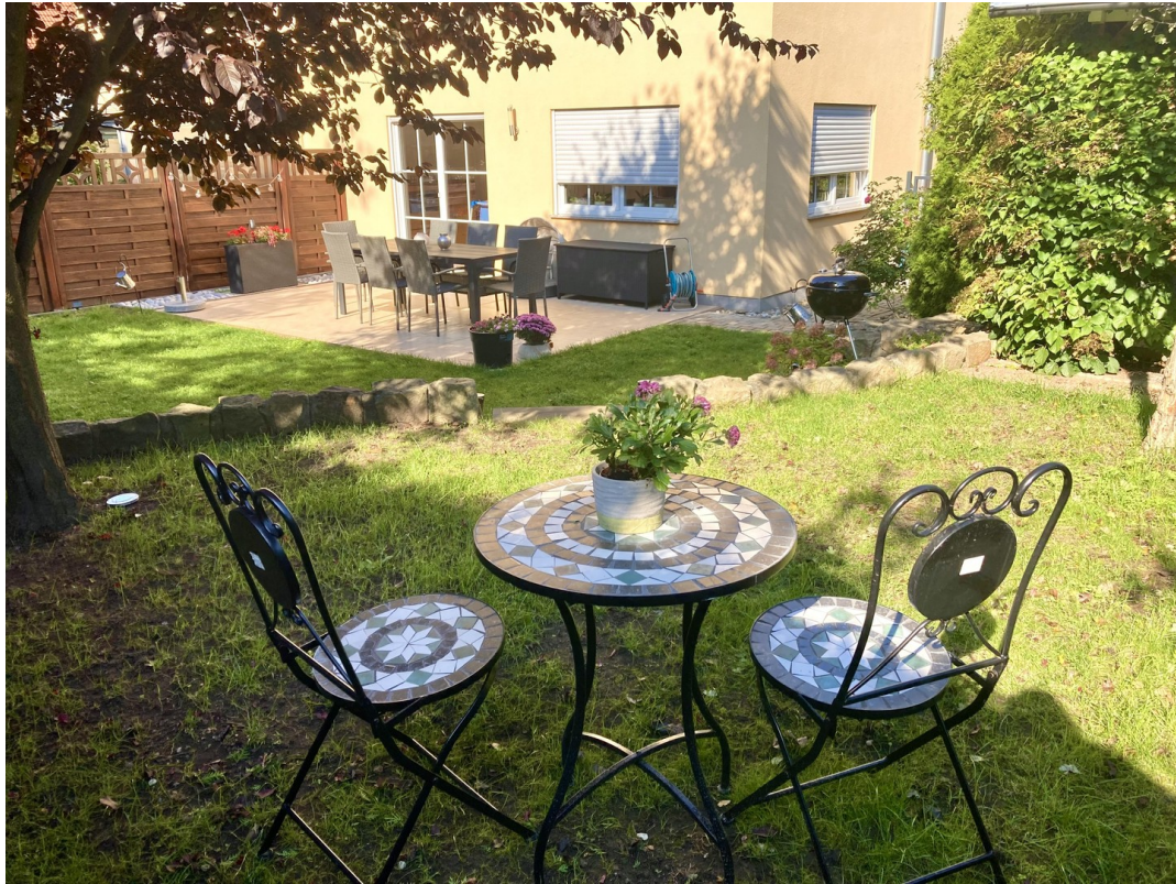
Garten mit Terrasse