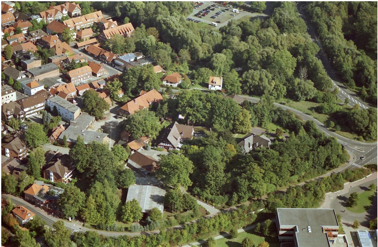
Luftbild vom Strampenhof