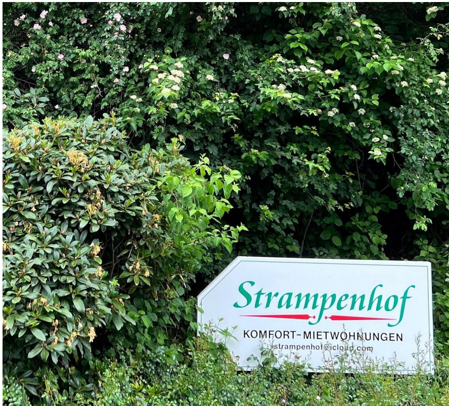
Einfahrt zum Strampenhof