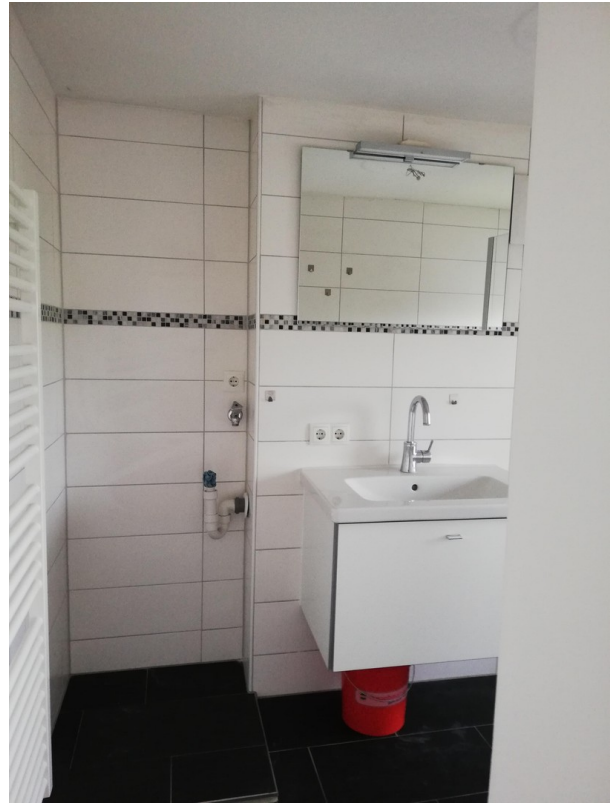
Dusche WT WM Anschluss