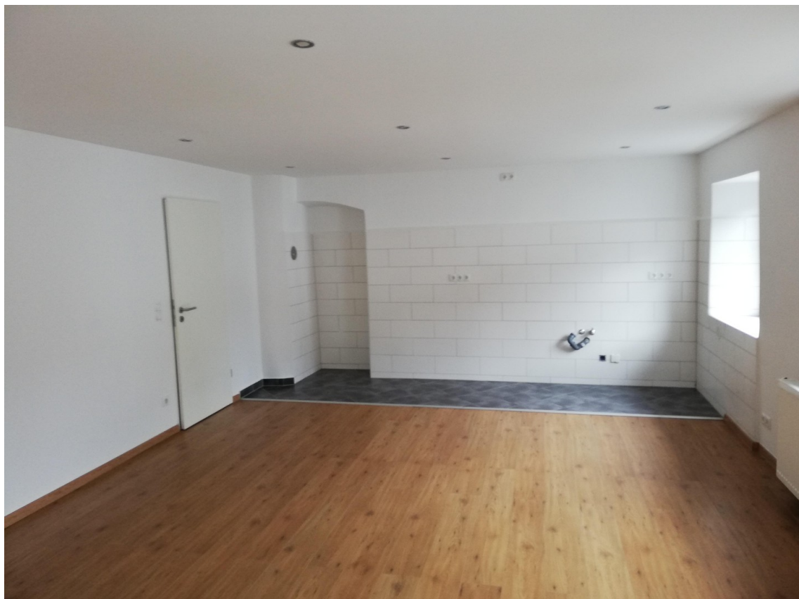
Wohn / Küche