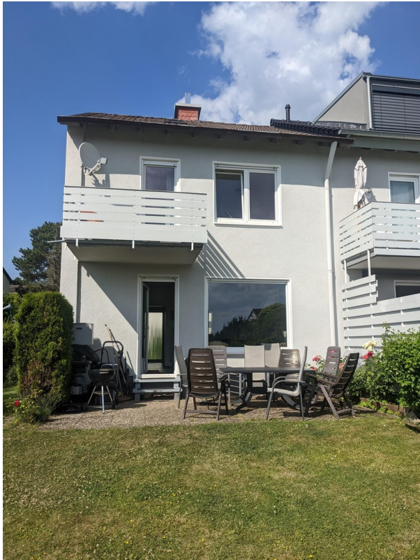
Gartenseite des Hauses, Terasse