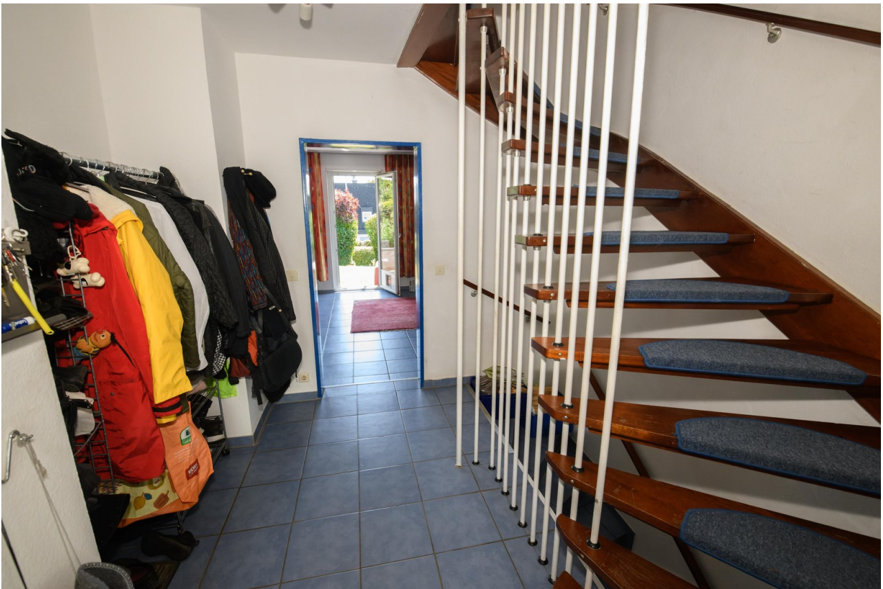
Flur und Treppe ins 1.OG