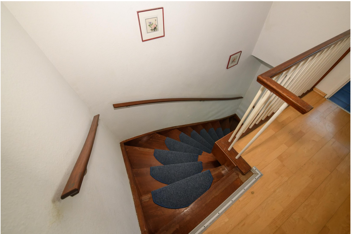
Treppe zum 1.OG