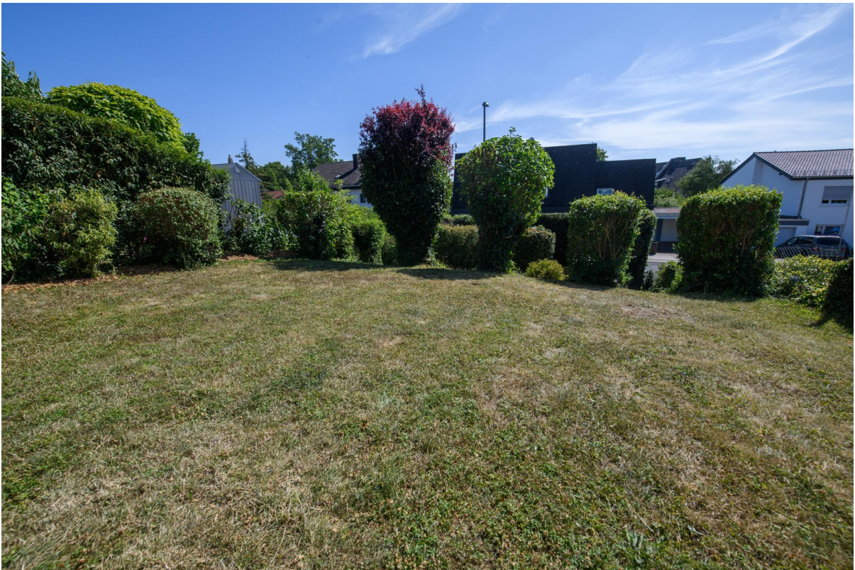
Blick vom Haus zum Garten