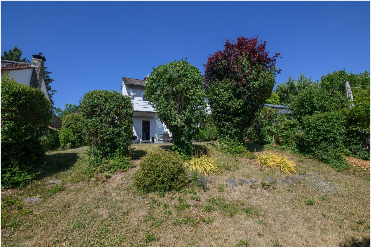
Blick vom Garten zum Haus