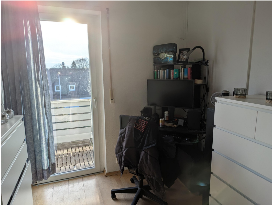
3.Schlafzimmer mit Balkon