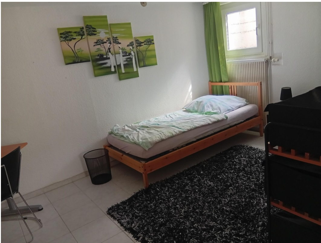
Raum im Untergeschoss