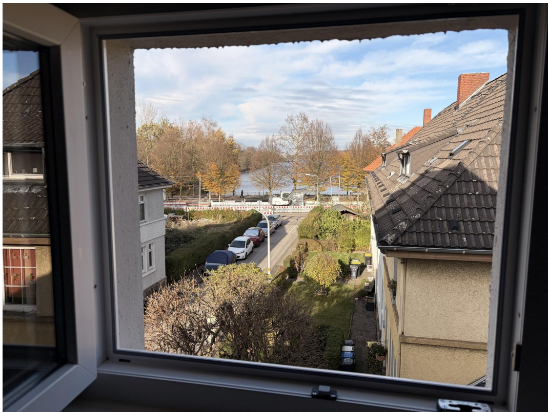
Ausblick Mansardenraum 2