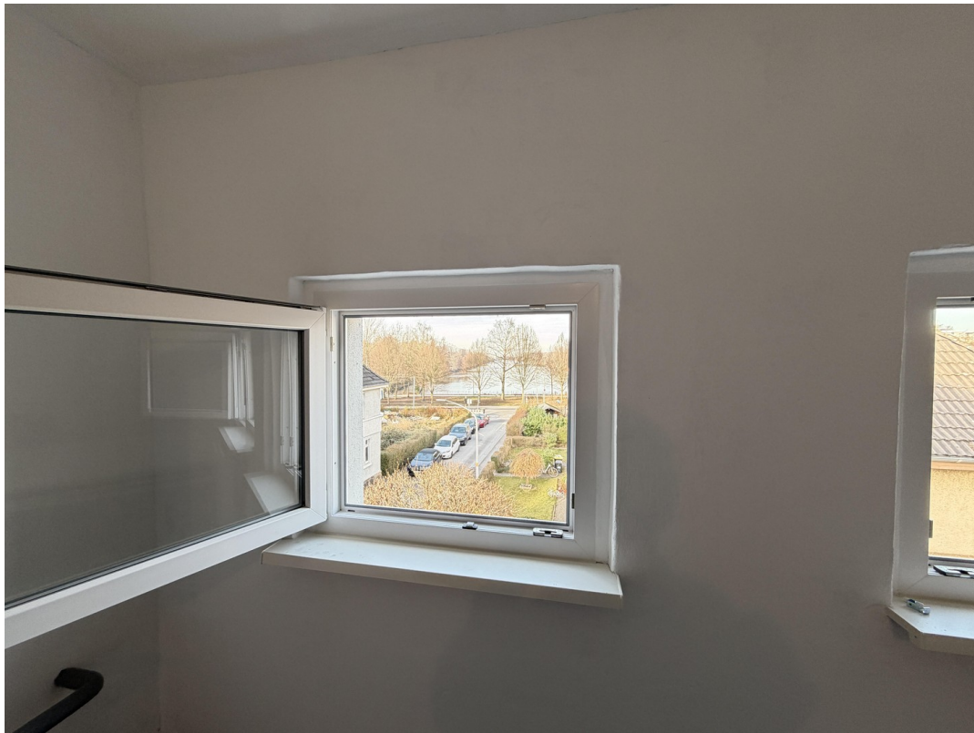
Ausblick Mansardenraum 2