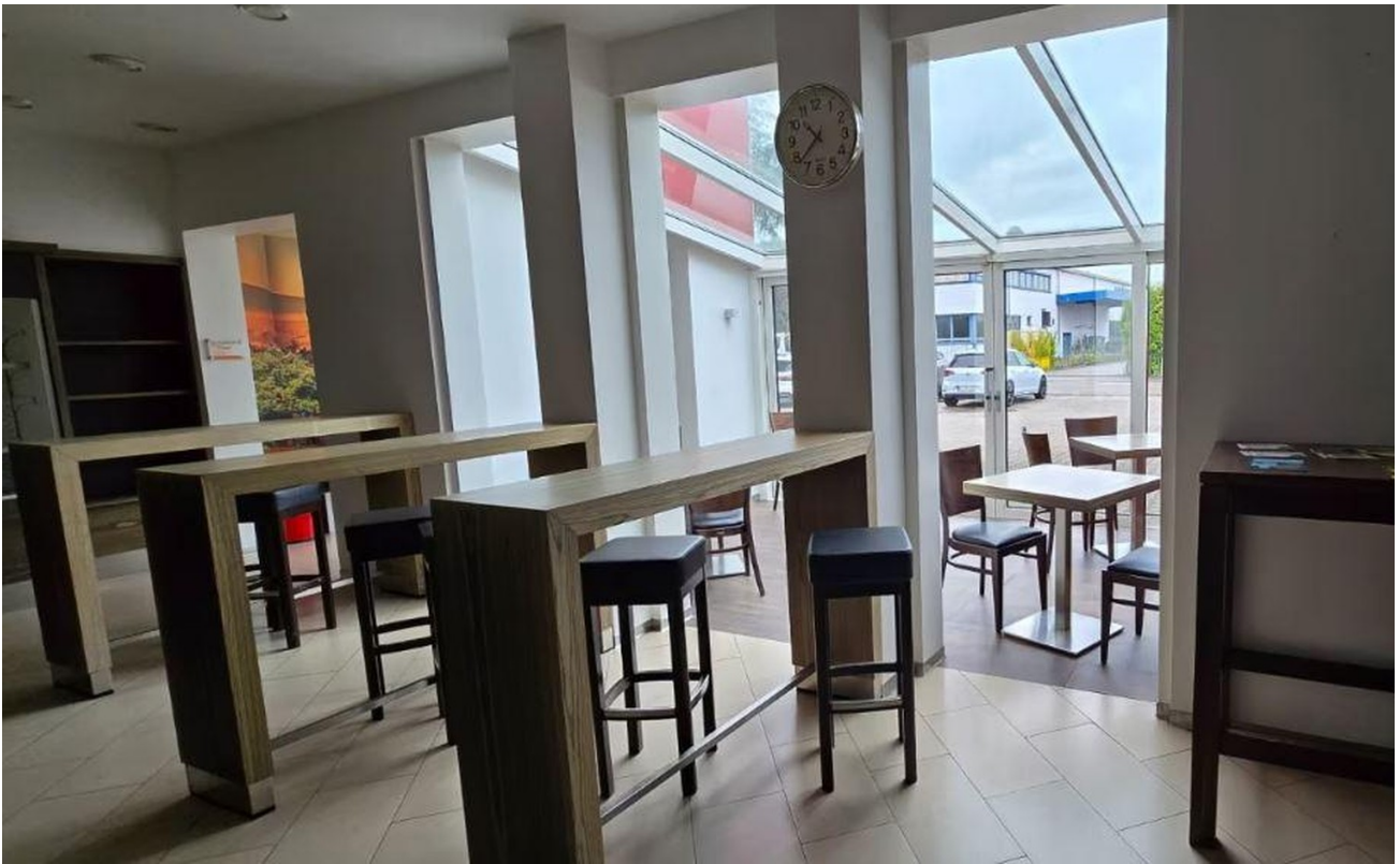
Gastraum mit Wintergarten