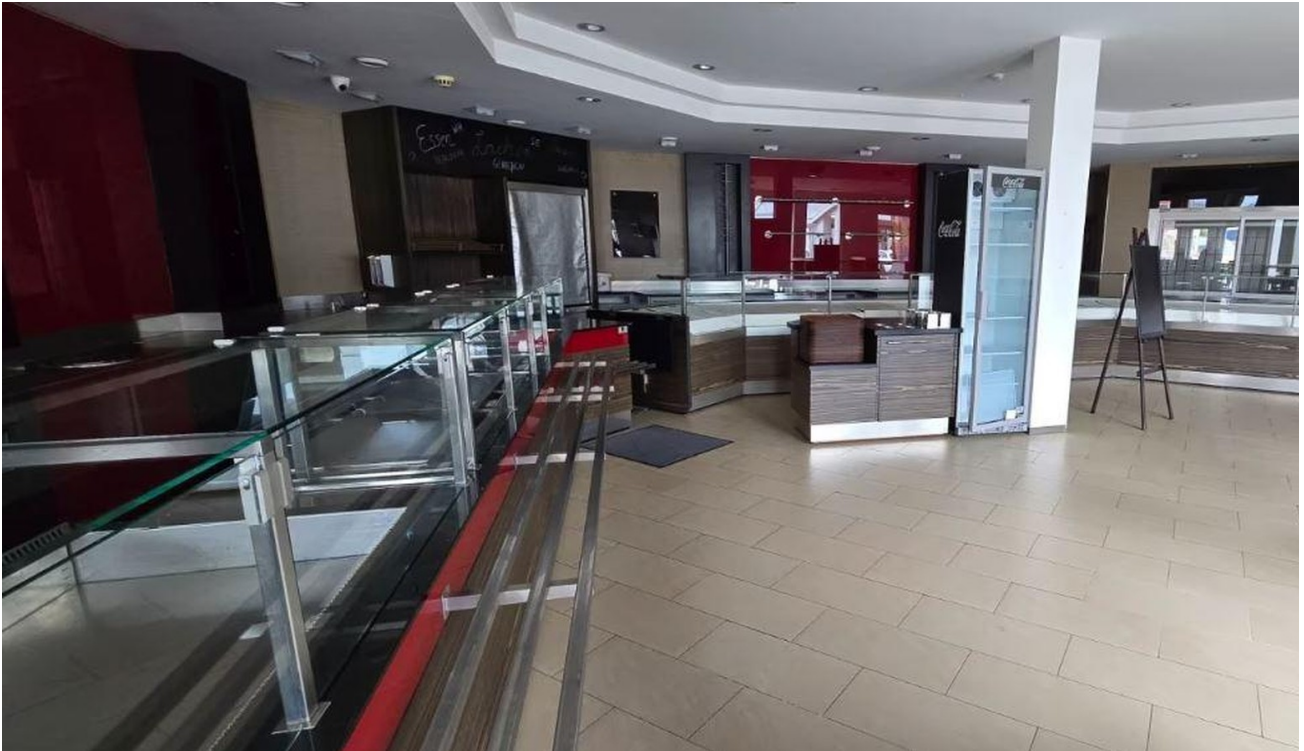
Bedientheke / Kühltheke